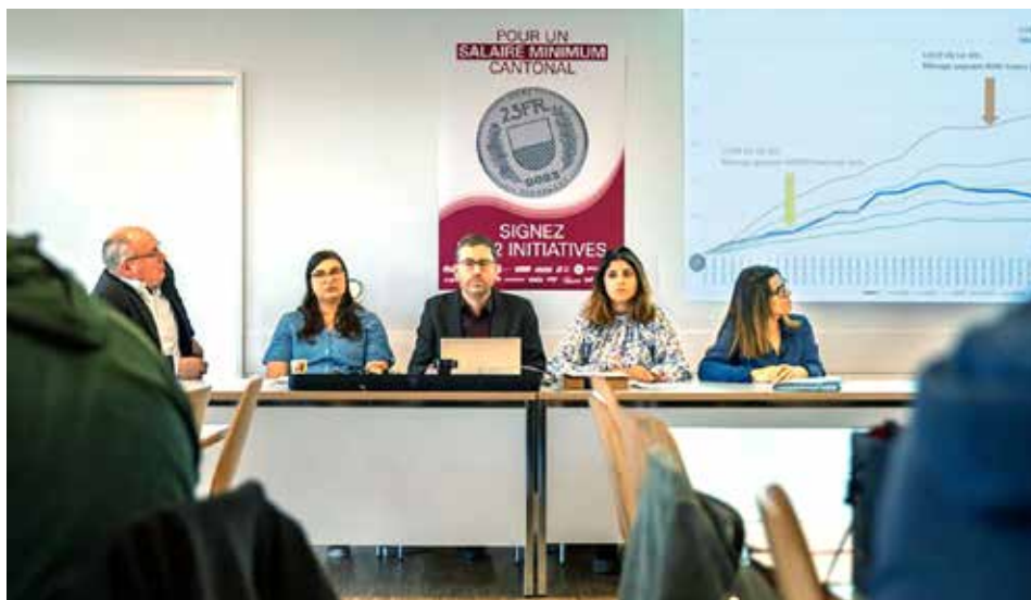
Minimalne plate za zaštitu kupovne moći radnika

Inicijativa za minimalac u kantonu VD dio je napora da se na nivou cijele države odbrani kupovna moć radnika. Nakon što je 2011. na knap odbijena prva kantonalna inicijativa, kanton VD sada ima dobre izgleda da se pridruži kantonima Ženeva, Nešatel, Jura, Bazel i Tesin, koji već imaju obavezan kantonalni minimalac.