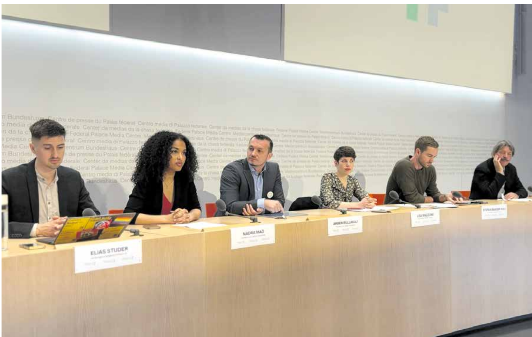
Demokratska inicijativa treba da omogući ravnopravno učestvovanje u društvenom životu