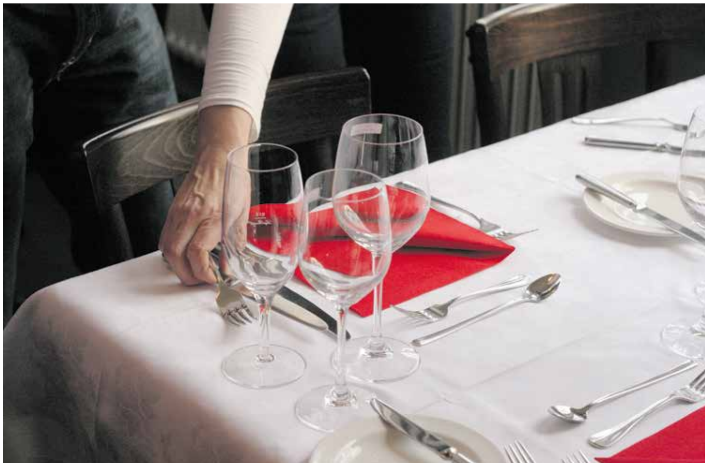
Anketa u ugostiteljstvu pokazuje veliko nezadovoljstvo

Unija je udruženju Gastro Suisse u februaru 2023. predala manifest zaposlenih u ugostiteljstvu koji je sadržao preko 10000 potpisa. U njemu su kao zahtjevi zaposlenih između ostalih navedene bolje plate, pravovremeno pravljenje rasporeda, plaćanje svih planiranih sati, pravo na nedostupnost van radnog vremena, kao i prevencija uznemiravanja i mobinga zaposlenih i njihova zaštita. Vrijeme je da Gastro Suisse preuzme odgovornost.