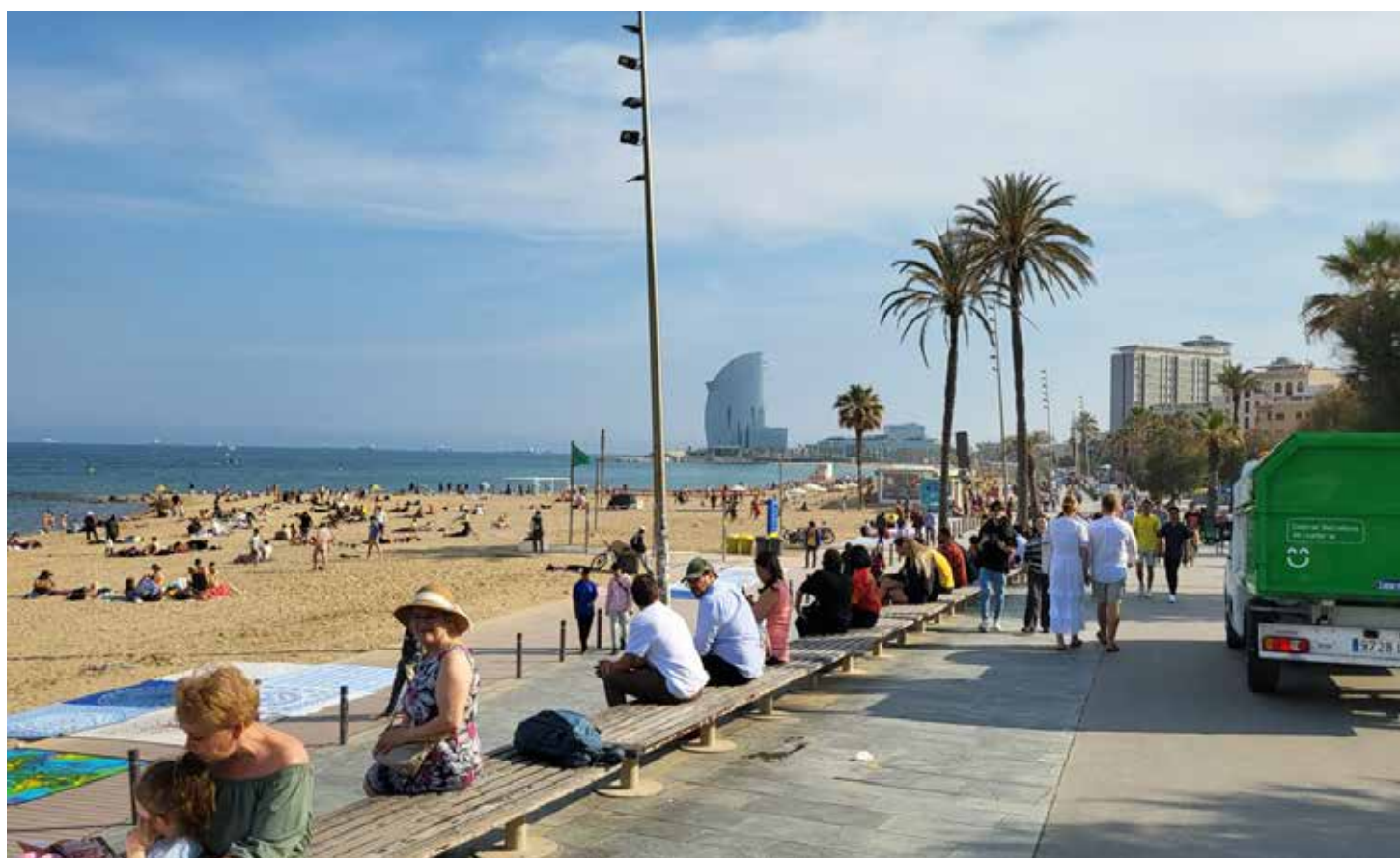
Budite obazrivi na ljetovanju i osigurajte se dobro

Preporučuje se da code ne čuvate u telefonu. U slučaju gubitka (krađe) telefona bitno je da znate serijski broj aparata i da odmah prijavite svome provajderu da vam blokira telefon kako ne biste imali velike troškove. Krađa se prijavljuje policij u tom mjestu i tamo se ostavljaju ali i uzimaju podaci od odgovorne osobe (telefon E-Mail) kako biste komunicirali iz inostranstva, obzirom da je odmor ograničen i ukoliko se telefon ne pronađe u tom periodu. Iz ličnog iskustva savjetujem da sve važnije brojeve zapišete na neki papir ili ih zapamtite kako biste u toj situaciji komunicirali soje bližnje. Sve ovo navedeno ne bi trebalo da umanji radost i opuštenost na odmoru, opreznost ne košta a koristi. Želim vam ugodan ljetni odmor!