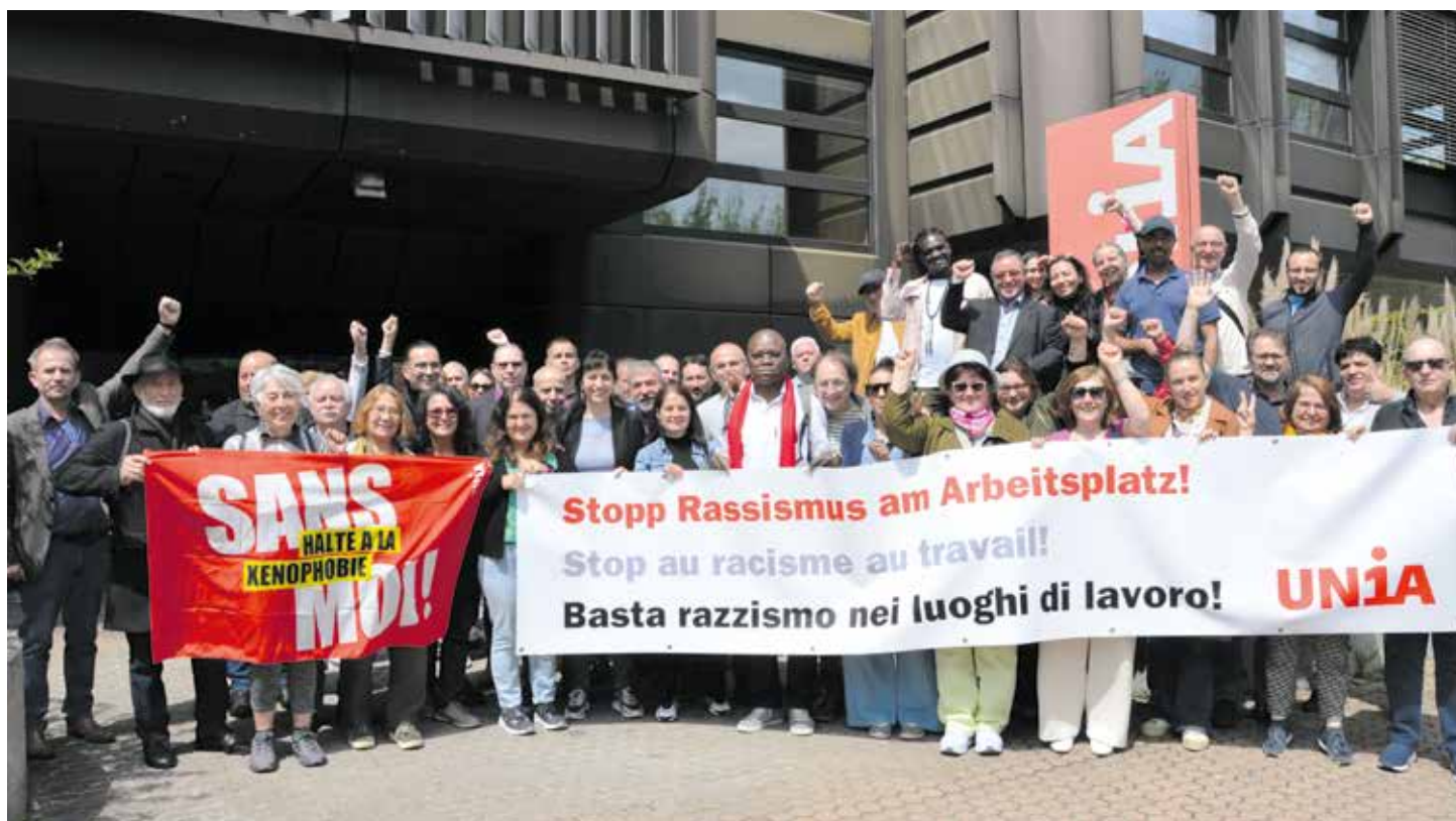
Poslodavac ima obavezu da sudjeluje u pogledu zaustavljanja svake vrste rasizma na radnom mjestu

Vrijeme je da se uvede efikasna zaštita od raznih oblika diskriminacije: prilikom zapošljavanja, unapređenja, usavršavanja, pristupa različitim zanimanjima, priznavanja diploma, kao i po pitanju uslova rada i plata. Unijina konferencija za migracije zahtijeva jačanje krivičnopravnih, civilnopravnih i administrativnih normi u cilju borbe protiv svih oblika diskriminacije na radnom mjestu već u slučaju prvog uznemirujućeg ponašanja, kao i u slučaju govora mržnje i nejednakog tretmana. Pored toga neophodni su i kolektivni ugovori s određenim iznosom minimalca, kao i pristup pravnom aparatu (sa koherentnim mehanizmima postupanja uključujući promjenu toga ko snosi teret dokazivanja, po uzoru na Zakon o ravnopravnosti). Uz to je potrebna i bolja prevencija od strane institucija, kao i anti-rasistička ofanziva informacijama i senzibilizacijom na federalnom, kantonalmom i komunalnom nivou.