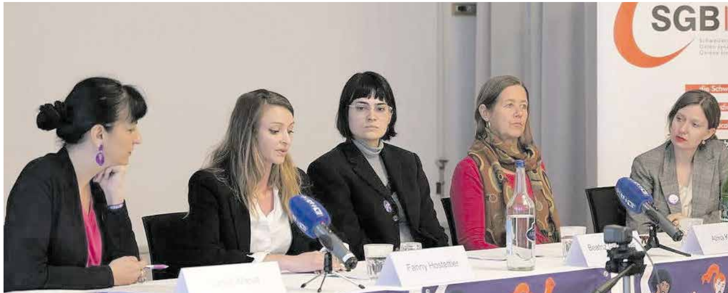
Rad žena za društvo je neophodan uprkos tome nedovoljno cijenjen

nja i privrede. Prema procjenama bi bruto društveni proizvod na svjetskom nivou porastao za oko 15%, ukoliko bi žene mogle ravnopravno da učestvuju u ekonomiji. Švajcarski savez sindikata (SGB) zbog toga zahtijeva hitno povećanje najnižih plata u takozvanim ženskim branšama.