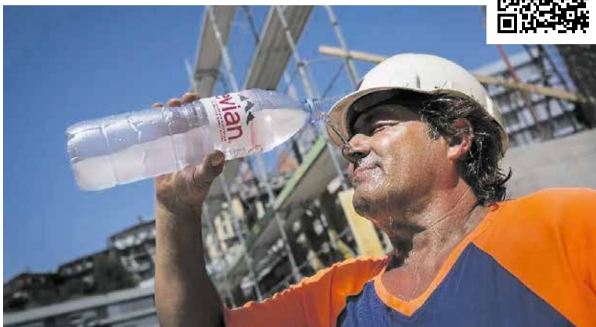
Neophodne mjere zaštite od vrućina na gradilištima