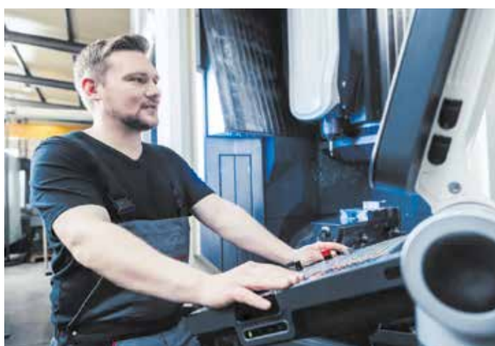
Povećanje minimalca za sve

Nažalost, efektivne plate (plate veće od minimalca) u ugostiteljstvu nisu se dobro razvijale u proteklih nekoliko godina. To je dovelo do toga da mnogi napuštaju ovu branšu i odlaze u druge u kojima su plate bolje, a radno vrijeme manje naporno. Unia od ugostiteljskih preduzeća zahtijeva da i efektivne plate dobiju isto izjednačenje s poskupljenjem kao što je to bio slučaj za minimalce