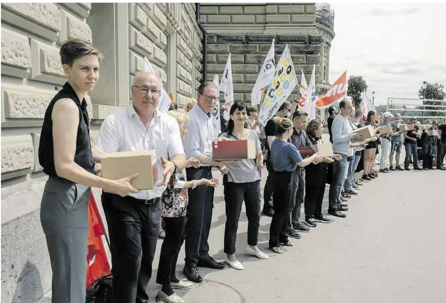
Referendum kao rješenje za drugi stub penzionog osiguranja

Novi zakon bi u teoriji trebalo da stupi na snagu 1. januara 2025. godine. Kako bismo to spriječili, potrebno je da kažemo NE na referendumu. BVG reforma će na red za glasanje najvjerojatnije doći 3. marta 2024. godine.