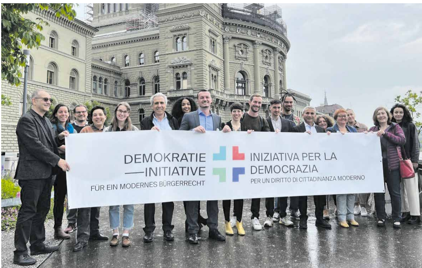
Demokratska inicijativa - za savremena građanska prava

Uloženi su brojni prigovori u cilju revizije građanskog prava. Građanska većina je odbila svaki od njih, samo su SP, Zeleni i Zeleni liberali bili za. Državni savjet ne želi da ukloni prepreke. Time inicijativa za dobijanje državljanstva koju je pokrenulo udruženje Četiri četvrtine još više dobija na značaju. Potrebno je 100 000 potpisa, nakon čega će i narod moći da glasa