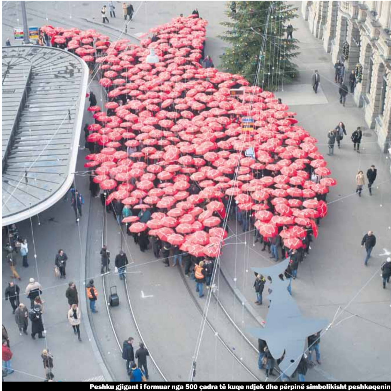
Peshku gjigant i formuar nga 500 çadra të kuqe ndjek dhe përpinë simbolikisht peshkaqenin

Në fjalën e tij përshëndetëse drejtuar Kongresit ministri i qeverisë zvicerane Alain Berset iu falënderua sindikalistëve për punën e tyre të rëndësishme për demokracinë. Ai ndanë me ta qëllimet e përbashkëta për të garantuar sigurinë sociale. Një grup i përzier sindikalistësh aktiv para tij shprehën pakënaqësinë tyre në formë proteste, pasi që Enti Federal për Sigurimet Shoqërore kundërshton edhe më tej zbatimin e Marrëveshjes për Sigurimet Shoqërore me Kosovën edhe përkundër vendimeve të plotfuqishme gjyqësore, dhe pos kësaj u protestua kundër planeve të paralajmëruara për rritjen e moshës së pensionit në 65 vjet për gratë.