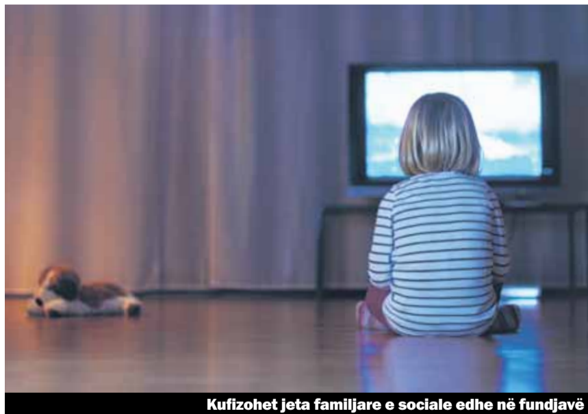
Kufizohet jeta familjare e sociale edhe në fundjavë

Më 14 dhjetor 2012 Parlamenti ka vendosur përfundimisht, të zgjohet orari i punës nëpër shitoret e pikave të karburantit. Ky vendim për Aleancën e së dielës, të cilës i takon edhe Unia, është i papranueshëm. Ai qon në zgjerimin e orarit të punës të dielave deh futja e punës së pandërprerë 24 orësh në tregtimin me pakicë, që me veti bie pasoja të rënda për të punësuarit dhe shoqërinë. Më 8 janar përmes një konference për media u shpall fillimi i Referendumi kundër liberalizimit të orarit të punës.