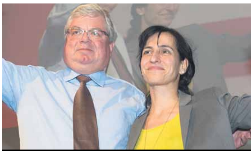
Dy bashkëkryetarët e zgjedhur nga Kongresi

Sekretare për migracion dhe anëtare e redaksisë