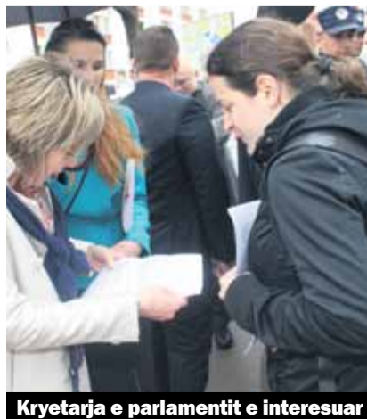
Kryetarja e parlamentit e interesuar