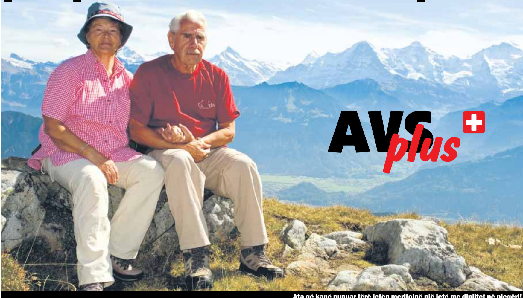
Ata që kanë punuar tërë jetën meritojnë një jetë me dinjitet në pleqëri!

Sigurimi i pleqërisë është ndër të arriturat e të mëdha të Zvicrës. Ky sigurim mundëson që të gjithë të kalojnë me dinjitet moshën e shtyrë. Mirëpo për shumë veta, të cilët kanë punuar tërë jetën e tyre dhe kanë paguar kontribute, sot pensioni i tyre është i pamjaftueshëm. Kjo nuk guxon të ndodhë: Me iniciativën AHVplus pensioni i pleqërisë rritet për 10%.