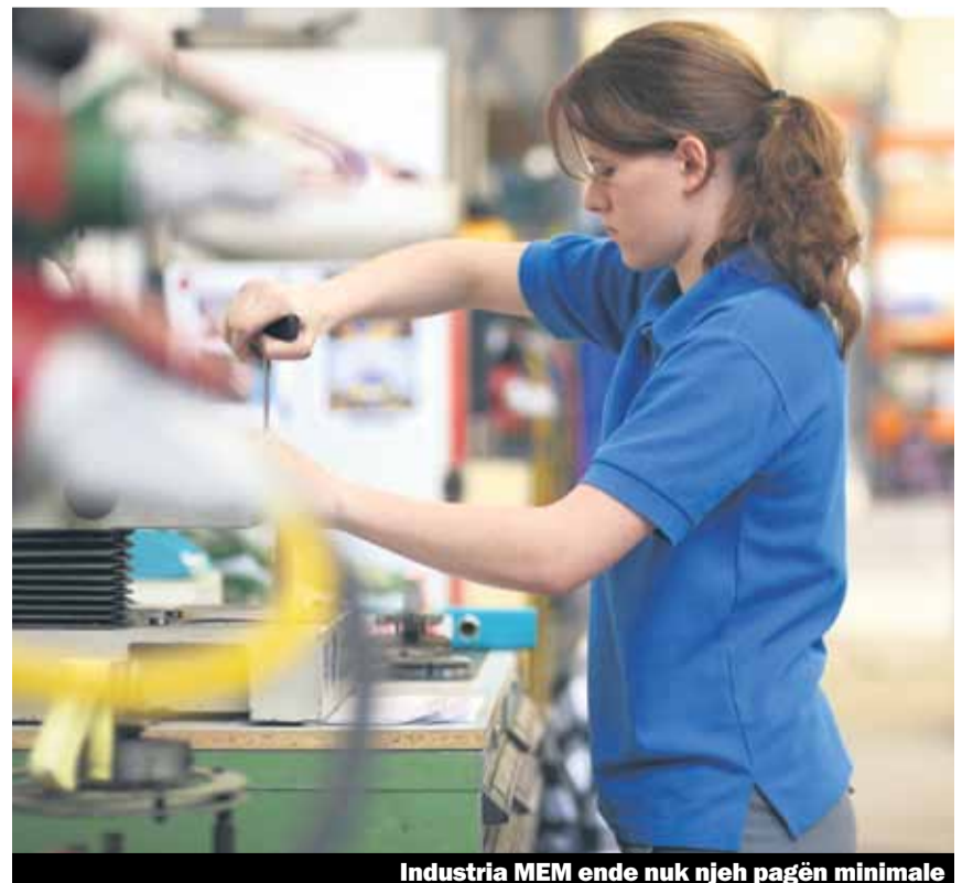
Industria MEM ende nuk njih pagën minimale

Shumice e organizatave të punëmarrësve kërkojnë shumë më pak se sa