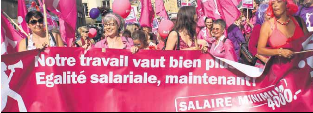
Çdo vit më 14 qershor në ditën e grevës së grave zhvillohen manifestime si në këtë pamje

Si çdo vit festojnë gratë e burrat në tërë Zvicrën më 14 qershor ditën e grevës së grave. Këtë vit Unia do të zhvilloi aksione nëpër regjione të ndryshme, si p.sh. një mbrëmje skare për gra «Barbeculture» me paraqitje kulturore feminist në Bazel. Pasi gratë janë edhe më tej jo proporcionalisht të prekura nga varfëria.