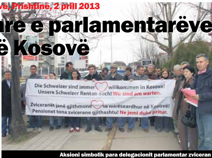
Aksioni simbolik para delegacionit parlamentar zviceran

Një delegacion zyrtar i Parlamentit Zviceran, kryesuar nga kryetarja e Këshillit Nacional dhe e Kuvendit Federal të Zvicrës, z. Maya Graf, po qëndron për një vizitë ka-tërditëshe zyrtare në Kosovë nga 1 deri më 4 prill 2013.