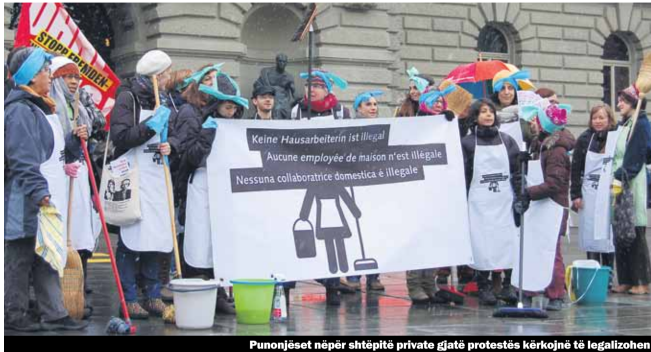
Punonjëset nëpër shtëpitë private gjatë protestës kërkojnë të legalizohen

Punonjësit shtëpiak kontribuojnë në shtimin e kualitetit jetësor të njerëzve të panumërt në Zvicër: Ato mundësojnë harmonizimin e jetës profesionale dhe asaj familjare ose angazhimin në profesione ambicioze. Pa migrantët në përgjithësi dhe pa personat pa letra në veçanti ky sektor nuk do të funksiononte. Një koalicion i gjerë i organizatave, të cilit i takon edhe Unia, nisi për këtë në mars kampanjë e cila kërkon nga qeveria që për punonjësit pa leje qëndrimi më shumë të drejta dhe rregullimin e lejes së qëndrimit.