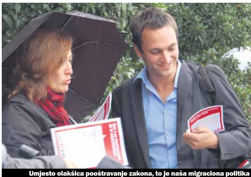
Umjesto olakšica pooštavanje zakona, to je naša migraciona politika