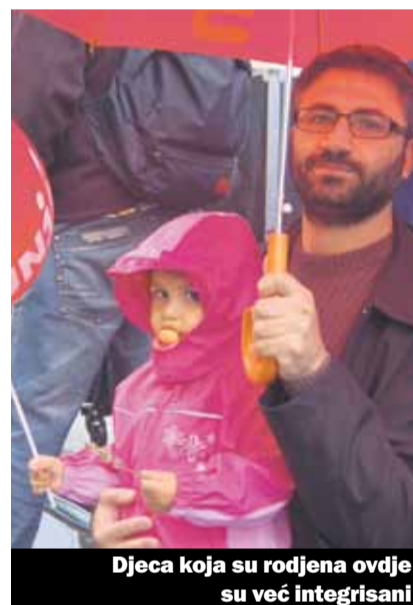
Djeca koja su rođena ovdje su već integrirani