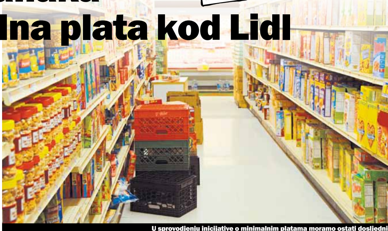
U sprovođenju inicijative o minimalnim platama moramo ostati dosljedni

Minimalna zarada od 4000 franaka za nekvalifikovane radnike to bi bilo najviše što bi se jednim opštim kolektivnim ugovorom moglo regulisati i bilo bi sigurnost za zaposlene u maloprodaji. Ovo povećanje bi trebao Lidl da primjeni od decembra ove godine. Lidl je od kako je ovo objavljeno u javnosti pravio puno reklama u vezi s tim povećanjem plata: «Lidl se isplati – i za naše zaposlene». Novosti i ako su za pozdraviti imaju i nekoliko «ali». Jedno od tih «ali» je da samo one radnice koje su zaposlene puno radno vrijeme mogu dobiti to povećanje. Ipak raditi u Lidl, kao i u cjelokupnoj maloprodaji, nekvalifikovani mogu da dobiju najviše zaposlenje do 60%. Tako da platu za minimalnu egzistenciju u Lidl ima mali broj zaposlenih.