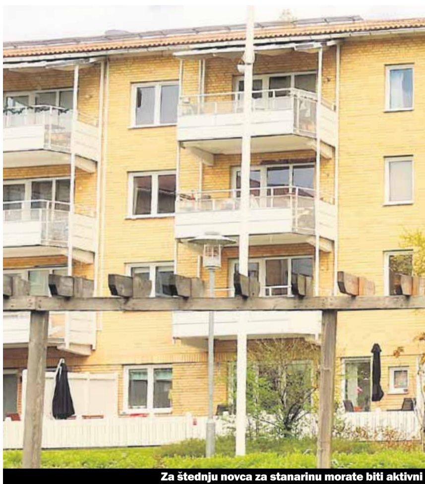
Za štednju novca za stanarinu morate biti aktivni

Zbog situacije na tržištu hipoteke postaju jeftinije. To može da djeluje na visinu stanarine samo ukoliko Vi zahtijevate od Vašeg stanodavca.