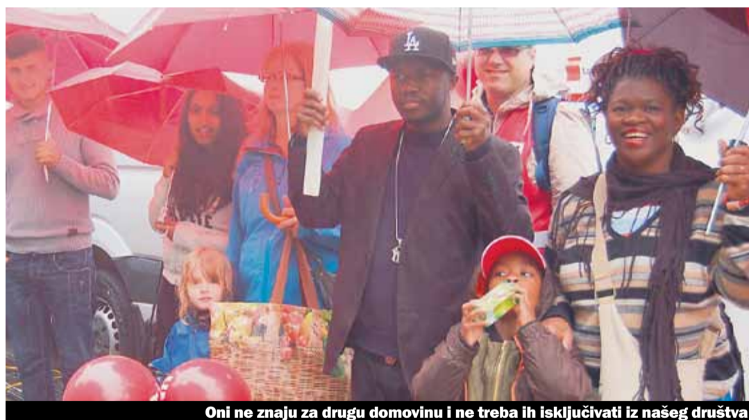
Oni ne znaju za drugu domovinu i ne treba ih isključivati iz našeg društva

Već nekoliko godina je u toku totalna revizija zakona za sticanje švajcarskog državljanstva. Ove godine je kako Savezno vijeće tako i Parlament politiku sticanja državljanstva preinacio u integracionu politiku.