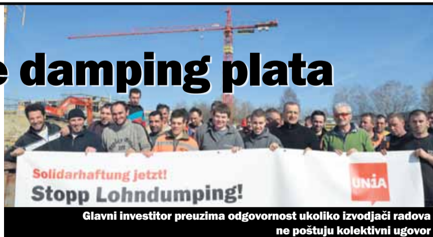
Glavni investitor preuzima odgovornost ukoliko izvođači radova ne poštuju kolektivni ugovor

Kada glavni investitor raspodijeli poslove na manje firme-izvođače radova mora da dokaže da je to uradio s posebnom pažnjom, kako bi sebe oslobodio od bilo kakve dalje odgo-