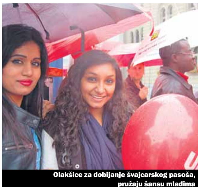
Olakšice za dobijanje švajcarskog pasoša, pružaju šansu mladima