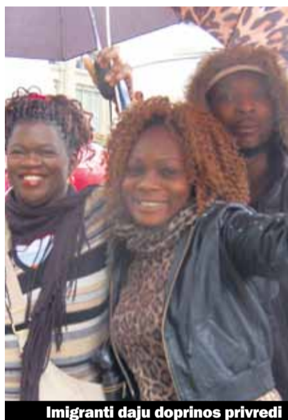
Imigranti daju doprinos privredi