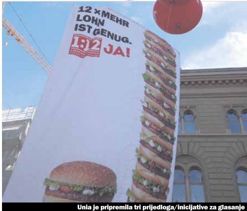
Unia je pripremila tri prijedloga/inicijative za glasanje

24. novembra je nacionalno glasanje. Mi imamo tri prijedloga koja smo pripremili za glasanje. Između ostalog će se glasati o inicijativi mladih socijalista 1:12 (Juso-inicijative), kojom se zahtijeva postavljanje gornje granice za plate bogatih. Morali smo da prihvatimo poraz od posljednjeg glasanja koje je održano u Cirihi: u Cirihi je inicijativa o pravu glasanja stranaca odbijena. S druge strane prošireno radno vrijeme u šopovima na benzinskim stanicama je usvojeno. Liberalno radno vrijeme prodavnica i dalje je dobro prihvaćeno od strane naroda.