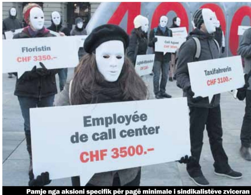
Pamje nga aksioni specifik për pagë minimale i sindikalistëve zviceran

18 maji të gjithë punëmarrësve mund tu bie përparim të madh: Atë datë do të votohet për iniciativën e sindikatave «Për më shumë mbrojtje të pagave korrekte», thënë shkurt do të votohet për pagë minimale dhe kështu për fuqizimin e pagës mujore 4000 frangash të garantuar me ligj, e cila do të zbatohet brenda tre vjetëve pas votimit aprovues. Kampanja parasheh shumë aksione ditore e javore. 8 marsi, dita ndërkombëtare e grave do të jetë dita e aksionit të parë të madh të kampanjës votuese. Por, për cilat arsye angazhohemi ne për pagën minimale të garantuar me ligj?