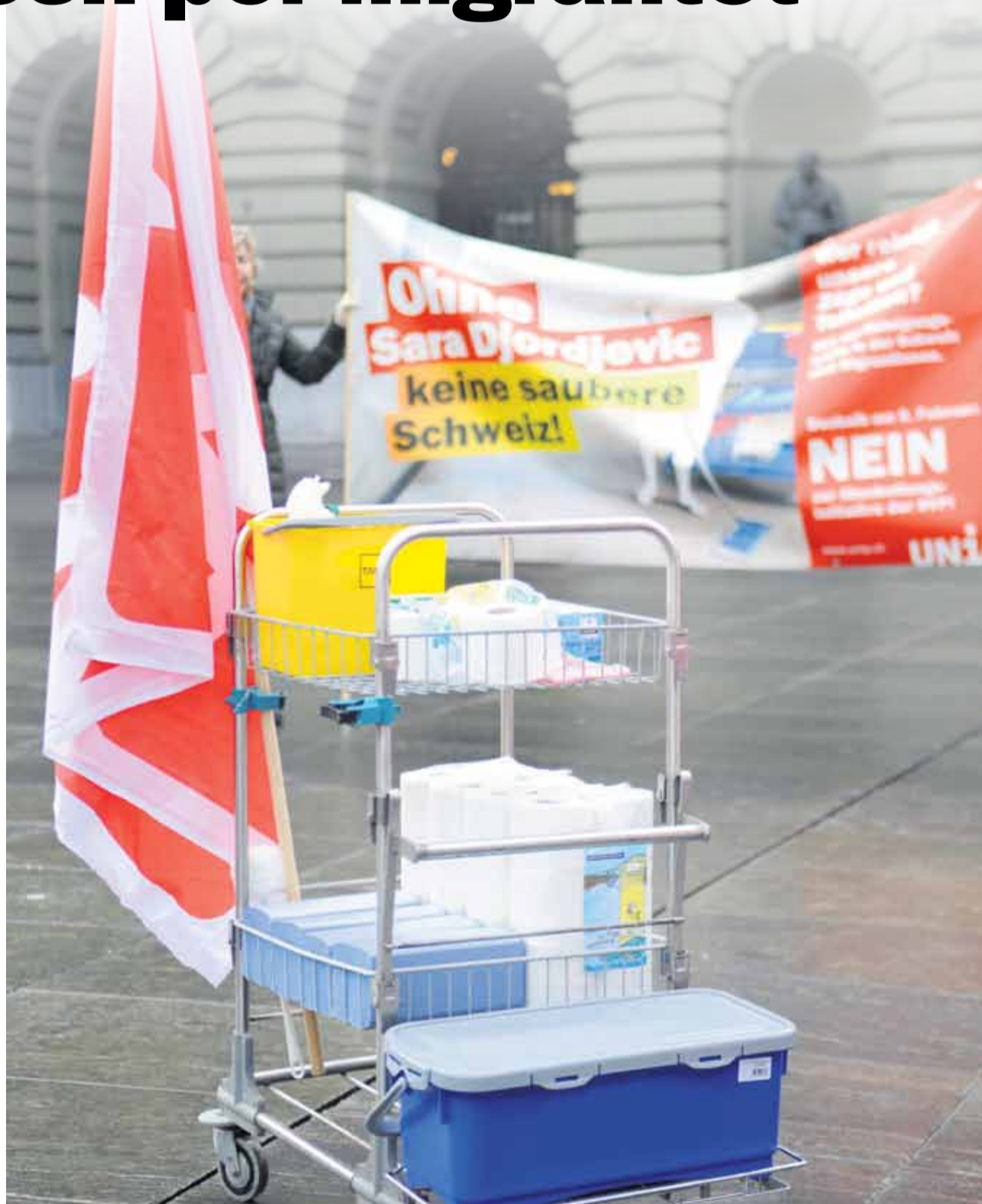
Pamje nga aksioni me 18.12.2013, Ditës Ndërkombëtare të Migracionit, në sheshin federal të Bernës

Iniciativa seleksionuese është iniciativa e fundit nga radhët e inicia-