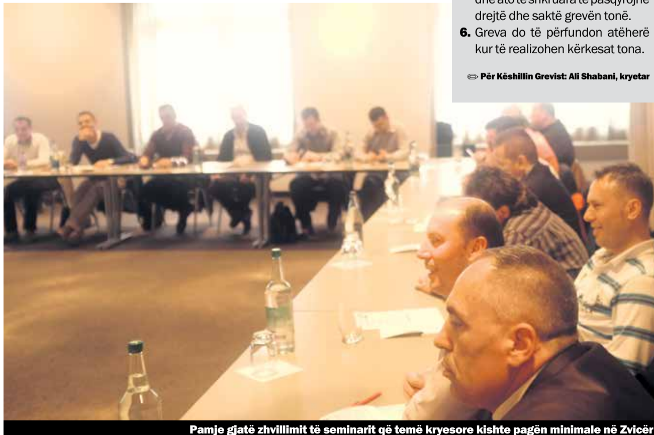
Pamje gjatë zhvillimit të seminarit që temë kryesore kishte pagën minimale në Zvicër