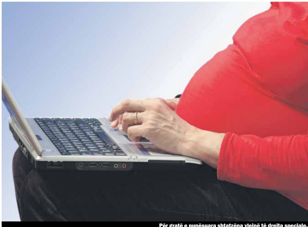
Për gratë e punësuar shtatzëna vlejnë të drejta speciale.

Ju pritni një fëmijë? Kur mbeteni shtatzënë lindin shumë pyetje – shëndetësore, personale dhe profesionale. Në vijim do të trajtojmë disa nga këto pyetje. Çka ju medoemos duhet të dini: Për ju vlejnë të drejta speciale. Këtu vlen edhe mbrojtja e pushimit nga papa.