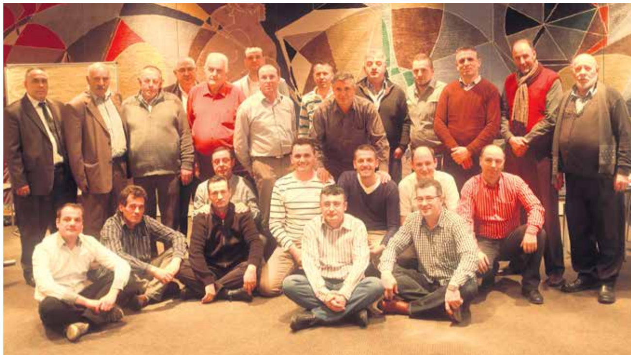
Pjesëmarrësit e seminarit për aktivistëve shqiptar të sindikatë Unia në foto solidariteti

Greva e filluar më 13.03.2014, e cila organizohet për shkak se Institucionet përgjegjëse të Republikës së Kosovës (Qeveria dhe AKP-ja) nuk po e ekzekutojnë Aktgjykimin e Gjykatës Kushtetuese të Republikës së Kosovës Nr. KI 08/09, të 17 dhjetorit 2010, respektivisht refuzojnë të paguajnë borxhin punonjësve të Fabrikës së Gypave të Ferizajt. Grevistët kanë shtruar 6 kërkesa dhe ata janë të vendosur që Greva do të përfundon vetëm atëherë kur të realizohen kërkesat e tyre.