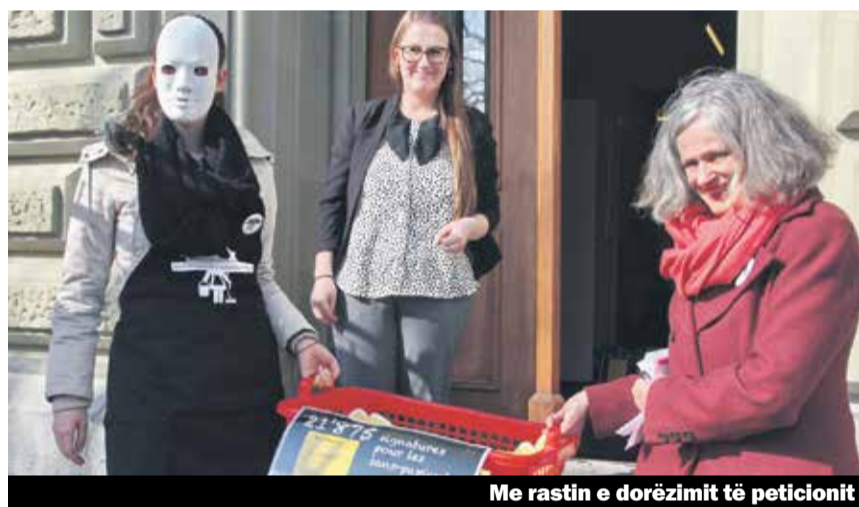
Me rastin e dorëzimit të peticionit