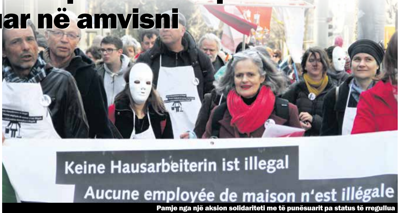
Pamje nga një aksion solidariteti me të punësuarit pa status të rregulluar

Më 5 mars shoqata «të vlerësohet puna në ekonominë shtëpiake – të rregullohen ligjërisht personat pa letra» ia dorëzoi qeverisë federale një peticion me 21875 nënshkrime. Shoqata që përbëhet nga 30 Organizata anëtare, ndër të cilat edhe Unia, kërkonë përmes këtij peticioni lejen e qëndrimit për punonjësit në amvisni, të cilët nuk e kanë të rregulluar qëndrimin, për mbrojtje sociale dhe qasje në gjyqësi pa rrezikun për dëbim nga Zvicra.