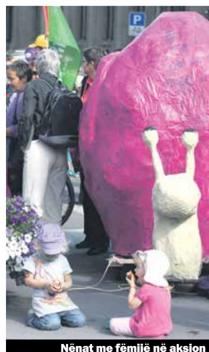
Nënat me fëmijë në aksion