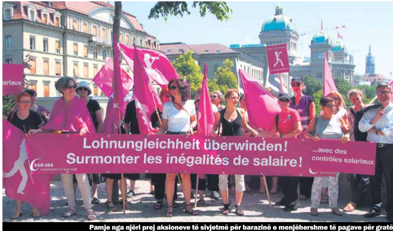
Pamje nga njëri prej aksioneve të sivjetmë për barazinë e menjëhershme të pagave për gratë

Kjo situatë ka alarmuar gratë e USZ-së për të ardhur në përfundim se