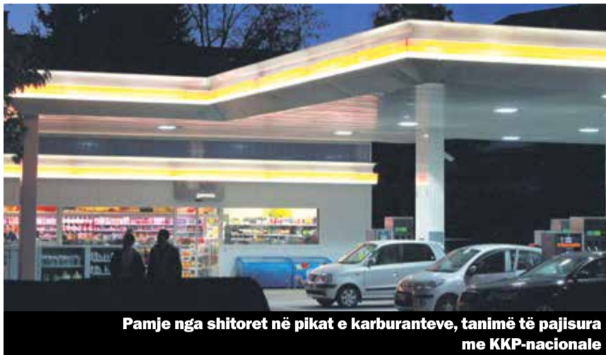
Pamje nga shitoret në pikat e karburanteve, tanimë të pajisura me KKP-nacionale

Se ia vlen që partneriteti social të merret seriozisht, tregon shumë mirë edhe shembulli i KKP-së së re të firmës Belimed Sauter, e cila vepron në sektorin e sterilizimit dhe e cila punëson rreth 300 veta. KKP-ja e re tanimë është fuqizuar dhe vlen deri në vitin 2019. Rishtas në kuadër të KKP-së përshihen edhe punonjësit temporal dhe shegertët. Posaçërisht e