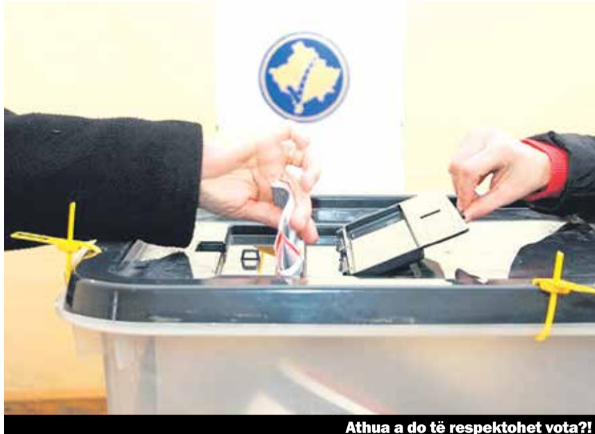
Athua a do të respektohet vota?!