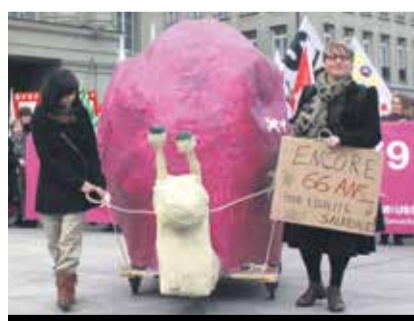
Pamje nga aksioni tjetër