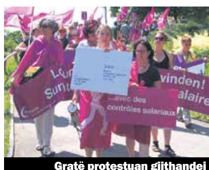
Gratë protestuan gjithandej