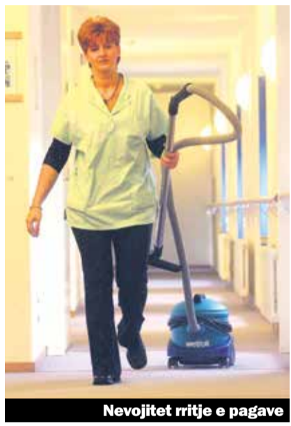
Nevojitet rritje e pagave