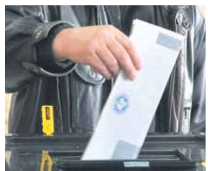
Pamje nga procesi votues, i cili zakonisht përcillet me parregullsi të shumta

Fakti se, sipas të dhënave zyrtare, në zgjedhjet komunale të vendit në vitin të kaluar kanë votuar gjithsejtë rreth 1500 qytetarë të Republikës së Kosovës jashtë vendit, arsyeve dhe fuqizon këtë kërkesë dhe nevojë të drejtë dhe potenciale për vendin dhe shoqërinë. Kështu mërgimtarëve të shumtë për herë të parë në historinë e shtetit të tyre, për të cilin kanë merita të veçanta, do të duhej tu mundësohet pjesëmarrja edhe në mënyrë të drejtpërdrejtë përmes votës së tyre në vendvotimet e vendlindjes së tyre, me çka diaspora e Kosovës e përbërë prej 700 mijë deri 1 milion njerëz, do të filloj të bëhet pjesë aktive jo vetëm në proceset zgjedhore në Kosovë.