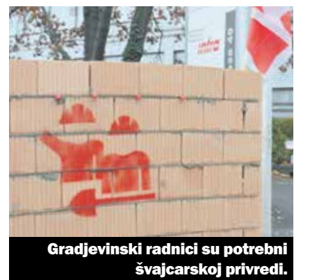
Gradjevinski radnici su potrebni švajcarskoj privredi.