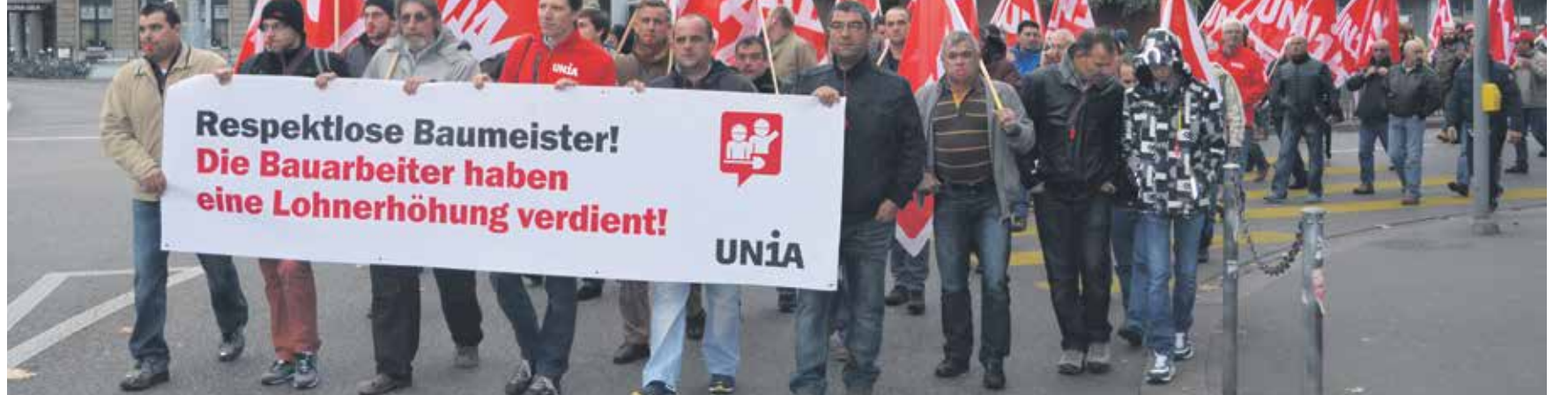
Savez Švajcarskih poslodavaca treba da nas prihvati kao socijalnog partnera i da se pregovori o platama i obnovi opštih kolektivnih ugovora nastave.

Pregovori o platama u građevinarstvu su u velikom zastoju ali i pregovori za obnovu Zemaljskog okvirnog ugovora i obnovu Opšteg kolektivnog ugovora za posredničke firme. Oba primjera pokazuju: Pregovori o platama i o nastavku ugovora nisu uvijek jednostavna tema i poboljšanja se mogu postići samo ako se zaposleni ujedine – i zajednički se bore za svoja prava.