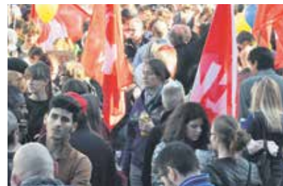
Borba se nastavlja istim intezitetom.

nirajućih postupaka u vezi dozvola za migrante.