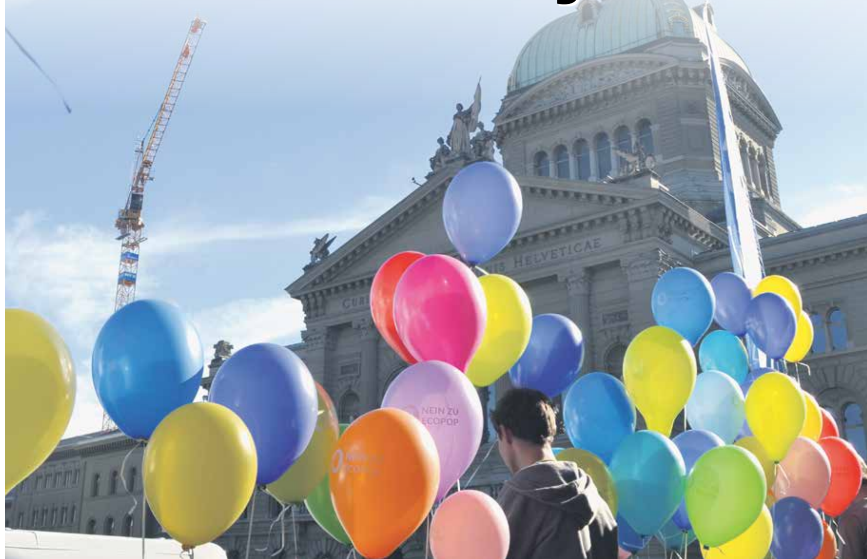
Desničarski krugovi će i dalje nastaviti akcije protiv stranaca, bilo da ih optuže za «betoniranje» Švajcarske ili zato što su vozovi puni.

Nakon intezivne kampanje progresivne snage u državi mogu lakše da dišu: Ecopop je jasno odbijen sa 74,1% glasova. Iako je ovaj rezultat uspješan migranti će i dalje ostati «krivci» za sve. Stoga i dalje nedvosmisleno važi da treba da se borimo i da se zalažemo protiv kontigenata i diskriminacije u pogledu boravišnih dozvola i migraciono značajnih pitanja. U sprovođenju velikih imigracionih inicijativa kao što je inicijativa koja je u februaru usvojena protiv masovne imigracije.