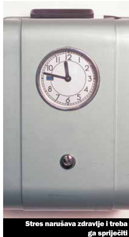
Stres narušava zdravlje i treba ga spriječiti

U 2015. će se na ovu temu sprovesti kampanja. Prva kampanja pod motom «Svaka minuta se broji» će biti lansirana u maloprodaji. Za-