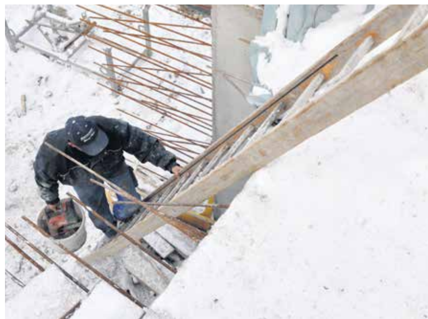
Ako polir ne prekida posao kod lošeg vremena radnik ga može opomenuti

Važno je: ako postoji rizik zbog hladnoće snijega ili kiše imate pravo da prekinete sa radom. Poslodavci ne prekidaju uvijek posao iako su veoma