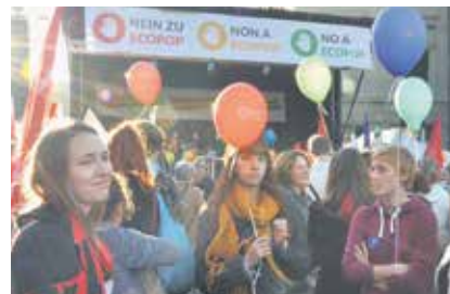
Mi treba da pokažemo našu jačinu.

Nakon odbijanja Ecopop inicijative, Unia će se i dalje zalagati kod sprovođenja inicijative o masovnom doseljavanju protiv novih diskrimi-