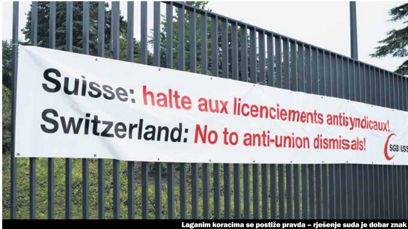
Laganim koracima se postiže pravda – rješenje suda je dobar znak

Usred borbe za radna prava najavljuje radio Frajburg da su dva predstavnika zaposlenih osudjeni. Savezni sud donosi nepravednu presudu.