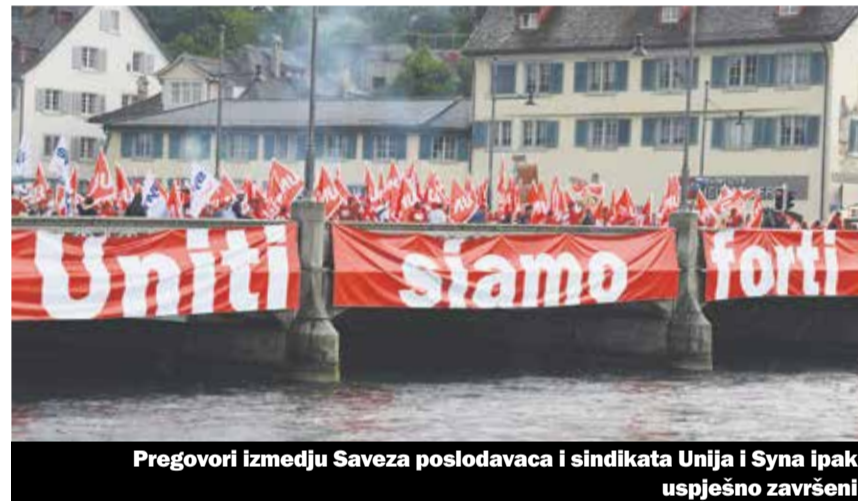
Pregovori između Saveza poslodavaca i sindikata Unija i Syna ipak uspješno završeni