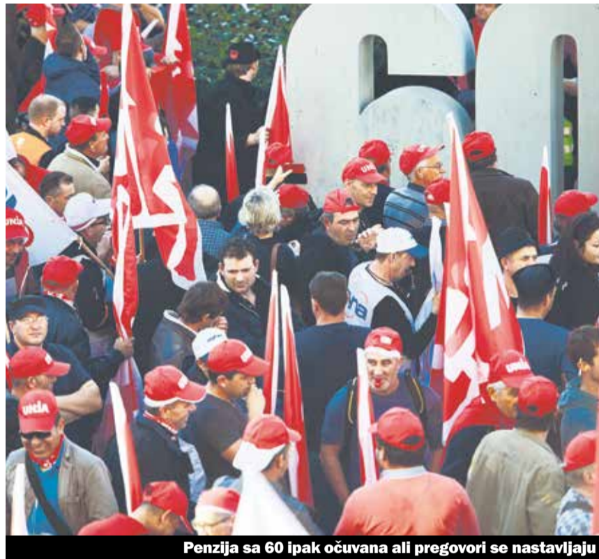
Penzija sa 60 ipak očuvana ali pregovori se nastavljaju

Savez građevinskih poslodavaca Švajcarske i sindikati Unija i Syna složili su se oko Opšteg kolektivnog ugovora (ZOU) za građevinsku industriju od početka 2016. do kraja 2018. Ugovor sadrži tek malo prilagođavanja. Uz to je zagwarantovana penzija u 60. godini bez smanjenog učinka.