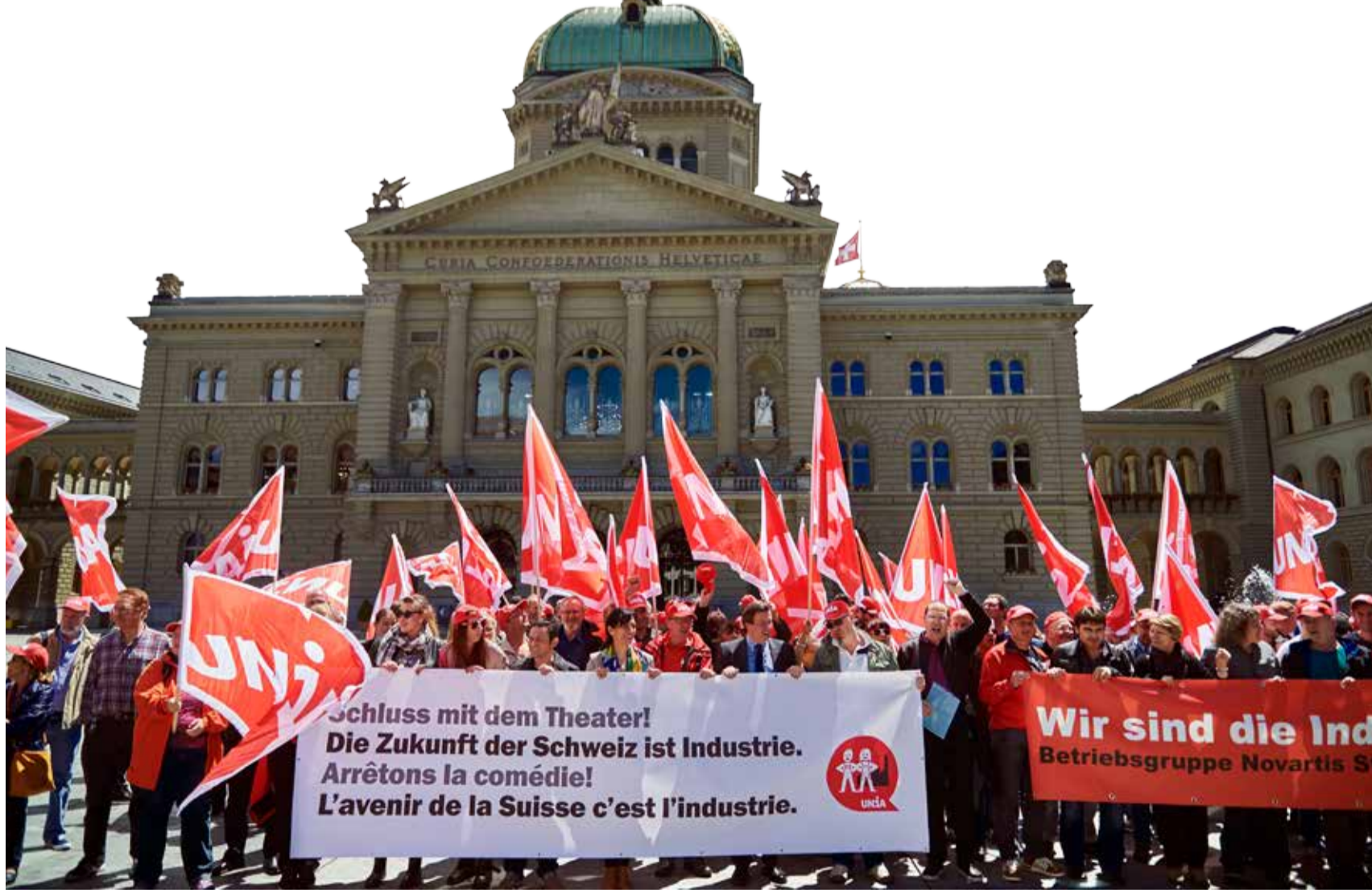
Le 17 juin 2016 lors de la Journée de l'Industrie d'Unia, 500 délégué-e-s ont revendiqué une politique industrielle forte.

L'abolition du taux plancher du franc face à l'euro a été une capitulation devant les spéculateurs. Elle a coûté des dizaines de milliers d'emplois. Il faut maintenant mener une politique qui préserve les emplois au lieu de les détruire.