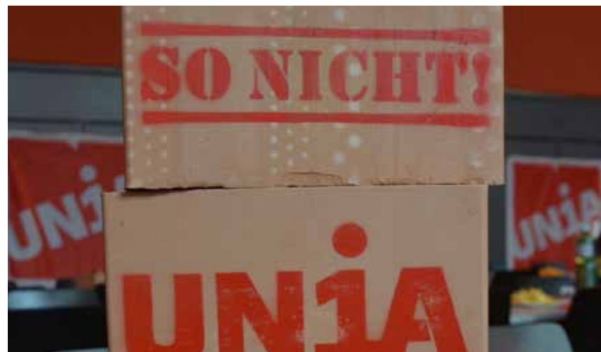
Građevinski radnici, koji su cijeli svoj život proveli na gradilištima zaslužuju poštovanje i povišicu plate

Međutim, umjesto da konačno poviši plate, predsjednik građevinskih upravnika, Gian-Luca Lardi, zahtijevao je da se smanji minimalac za sve. Naše plate su u poređenju sa Evropom previsoke. A visoke troškove života u Švajcarskoj potpuno ignoriše. Uz to Lardi želi manje plate za starije građevinske radnike, jer je njihov učinak zbog godina manji. Gdje je tu nestalo poštovanje prema