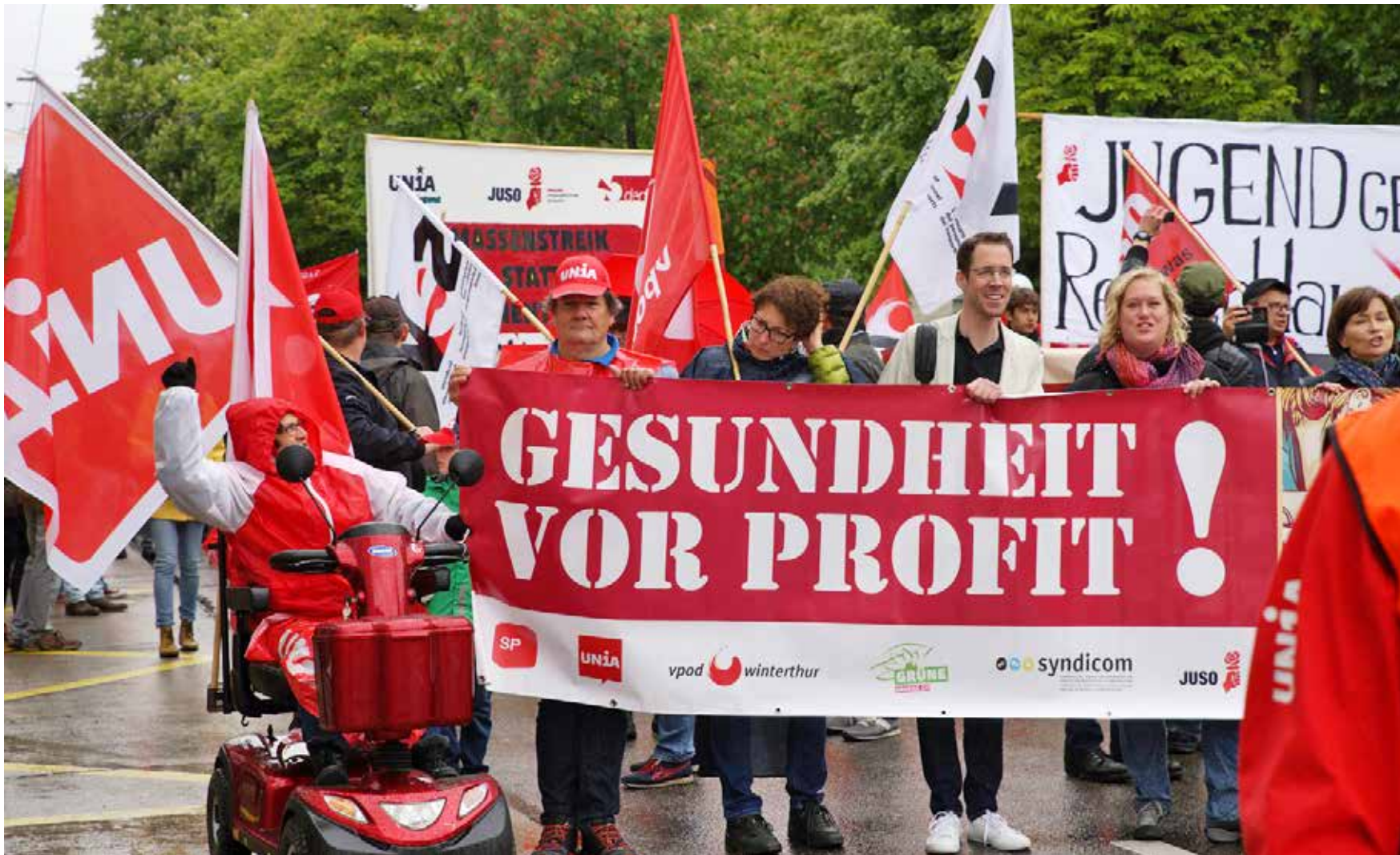
Dobar profit se može ostvariti samo sa zdravim radnicima, dakle zdravlje prije profita

Dugo radno vrijeme šteti psihičkom i fizičkom zdravlju. Nove australske studije pokazuju da osobe koje nedeljno rade više od 39 sati ugrožavaju svoje zdravlje. Upravo bi Švajcarska sa svojim izuzetno dugim normalnim radnim vremenom morala ozbiljno da shvati ovo upozorenje.