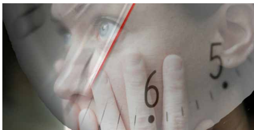
Invalidsko osiguranje čeka na doktorske nalaze iako je dijagnoza jasna