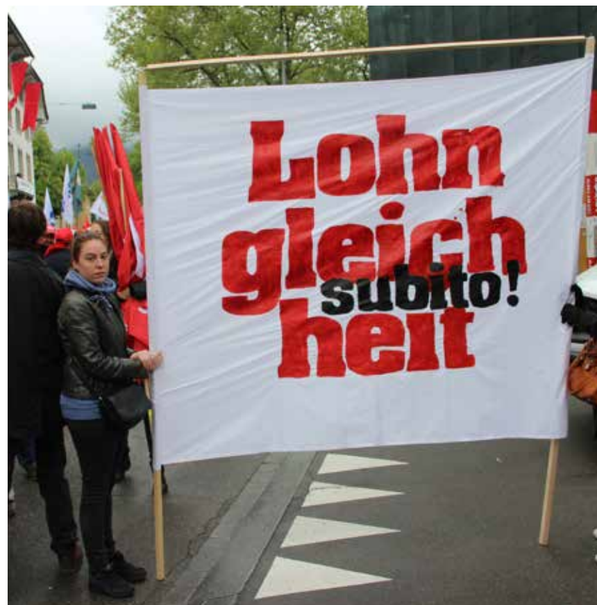
Jednakost plata neophodna i to odmah

Po pitanju jednakosti plata hitno mora da se dogodi nešto! Savezno vijeće Švajcarske i parlament moraju biti prisiljeni da se konačno pobrinu za sprovođenje jednakosti! Aktuelna planirana reforma Zakona i ravnopravnosti, koja bi trebalo da dođe u parlament na jesen, međutim nikako nije dovoljna! Jer, iako preduzeća moraju da provjere svoje plate na svake četiri godine, nisu predviđene nikakve sankcije niti kazne ukoliko oni to odbiju, ili pak ne prilagode plate. Takav zakon ničemu ne vrijedi, kao što mi sindikalci veoma dobro znamo.