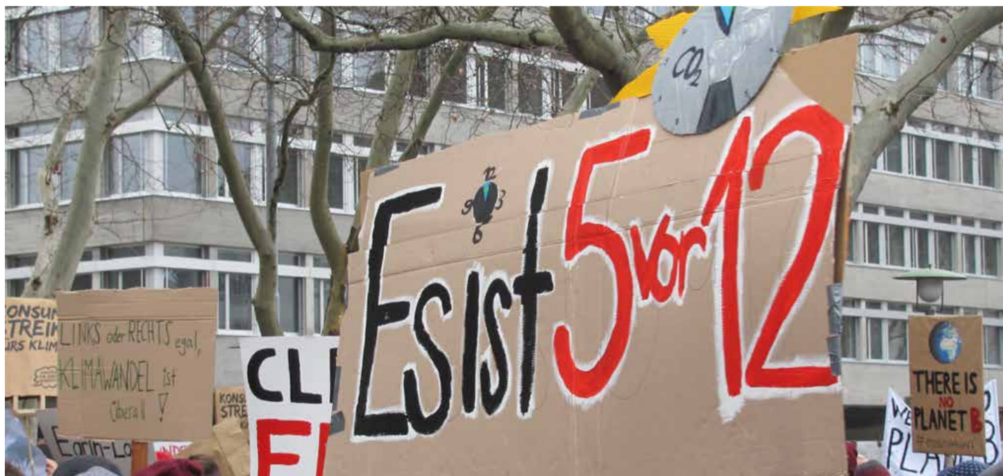
Za zaštitu klime i prirodne sredine treba da se angažujemo svi i to znatno aktivnije

Klimatska omladina ima pravo: minut do dvanaest je! Borba mladih mora postati borba cjelokupne ljevice Švajcarske i svijeta. Unija se zbog toga solidariše s klimatskim pokretom i podržava i veliku demonstraciju za klimu 28.09.2019.