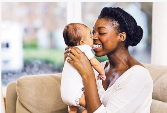
PORODILJSKO: U slučaju smanjenja obima posla osiguranje za nezaposlene nažalost smanjuje i osiguranu zaradu.