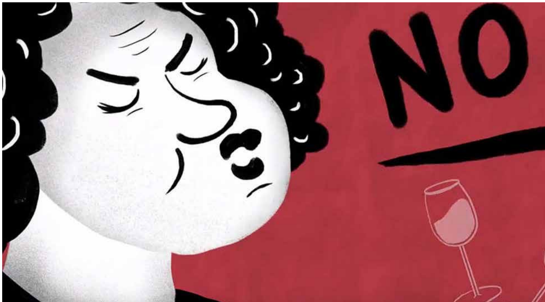
Niko ne smije trpiti zlostavljanje bilo koje vrste a posebno ne mladi ljudi, koji su na početku svoje karijere

Saopštenje za medije sindikata Unija, Bern, 12.08.2019