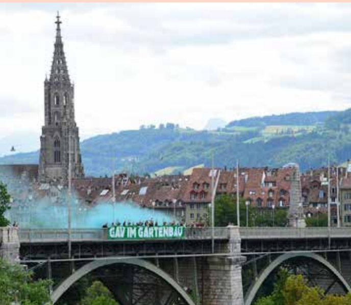
Za očeve više odmora za porodicu

Djeca su u Švajcarskoj i dalje primarno ženska stvar. Ako su bolesni, majka ostaje kod kuće. Ako bebisiterka ne može da dođe, ili ako otac ne može brzinski da organizuje svoj očinski dan, preuzima majka. A u većini porodica očevi rade puno radno vrijeme, a majke ili djelimično ili neplaćeno. Četiri ili dvije nedjelje porodiljskog odmora za očeve: Savez kantona Švajcarske odlučuje o tome. Jasno je: ako Švajcarska neće da zaostaje po pitanju porodične politike, mora da učini da djeca više ne budu majčina, već porodična odgovornost. Međutim, na ovogodišnjem ljetnom zasjedanju prvo se radi o minimalnom rješenju: Švajcarskoj je potrebno porodiljsko za očeve – i to pune četiri nedjelje u skladu s inicijativom, a ne samo polovina, kako predviđa kontra-prijedlog komisije Saveza kantona. Da svi očevi nezavisno od poslodavca od početka mogu biti dio porodice, preuzimati odgovornost za svoju djecu i rasteretiti majke. Da djeca više ne budu odgovornost majke, već odgovornost porodice.