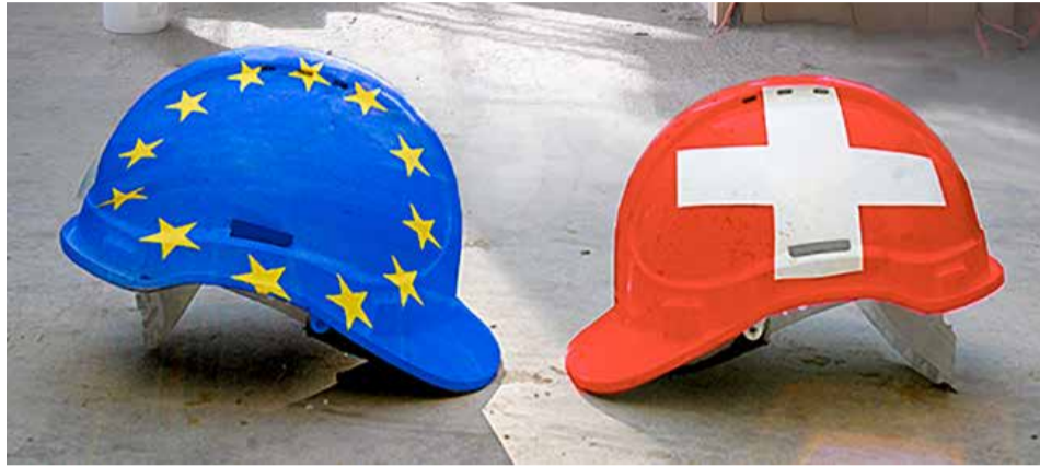
Plate možemo zaštititi primjenom pratećih mjera a ne zabranom slobode kretanja

Važan dio slobode kretanja čine prateće mjere (FlaM). One dozvoljavaju da