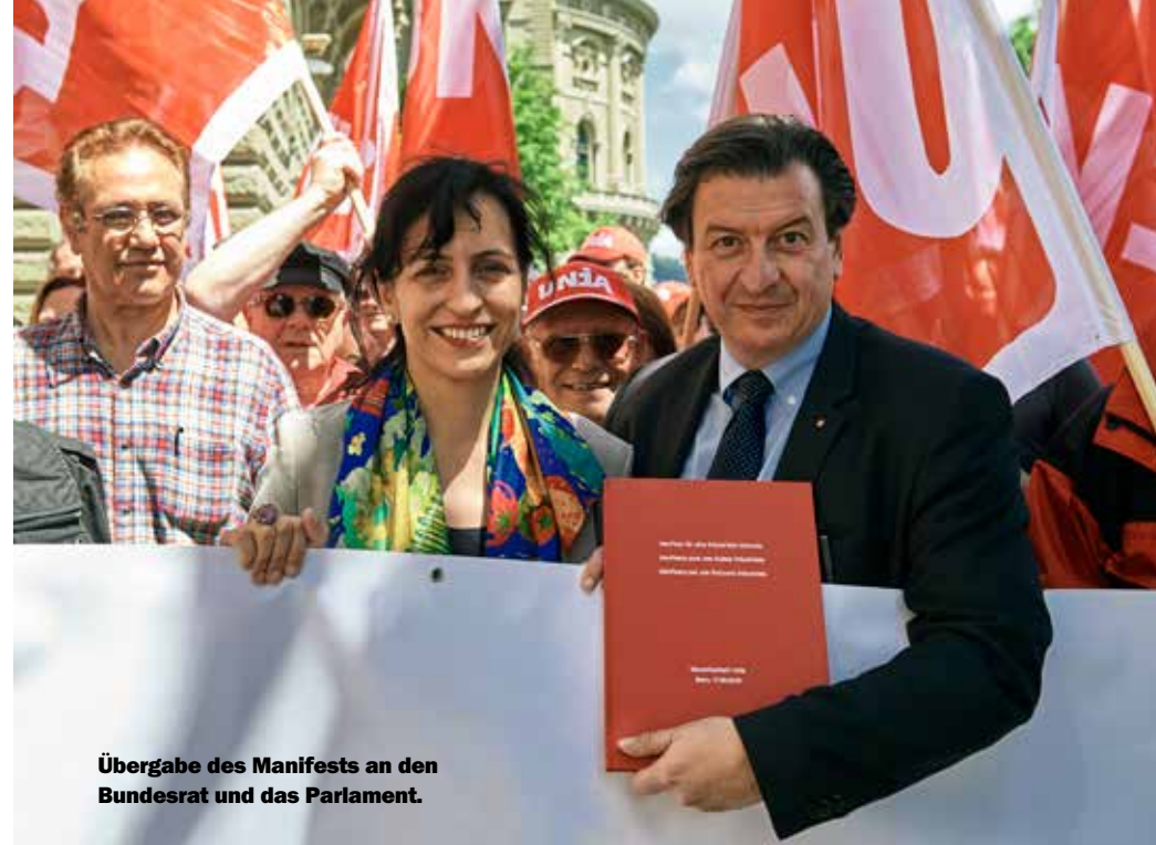
Übergabe des Manifests an den Bundesrat und das Parlament.

Wir sind Industrie! Nous sommes l'industrie! Noi siamo l'industria!