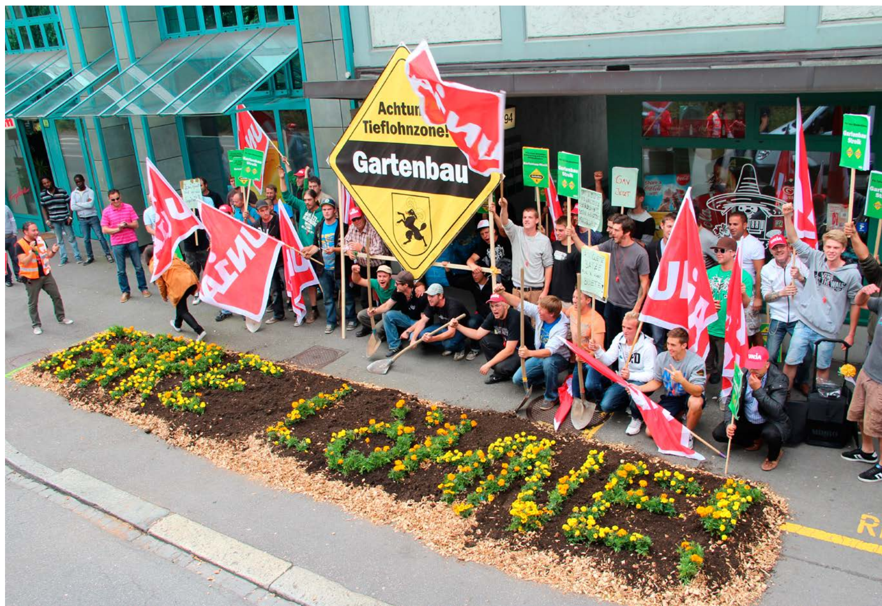
Težak rad baštovana treba nagraditi opšteobvezujućim Opštim kolektivnim ugovorom

Težak rad za niske plate i bijedne uslove rada. Hortikultura je kao i dosad u izuzetno lošem stanju. Sada je Unija širom Švajcarske lansirala peticiju za bolje uslove rada i želi da zajedno sa baštovanima poboljša njihovo angažovanje u branši.