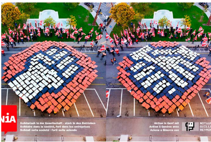
Sindikata Unia postavio pravac za budućnost