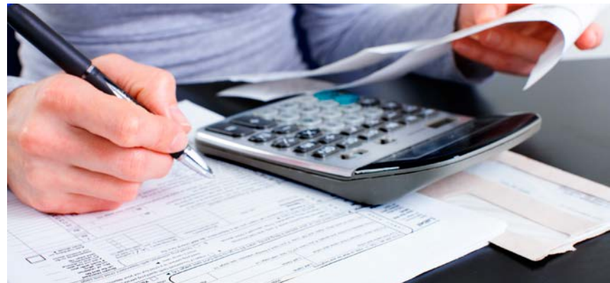
Od Nove godine detaljna deklaracija imovine iz inostranstva za porez

Švajcarska i 28 zemalja članica Evropske unije potpisale su sporazum za AIA. On na snagu stupa 1.1.2017. AIA je učinkovita mjera protiv prekogranične utaje poreza i za transparentan švajcarski finansijski centar u skladu sa zakonom.