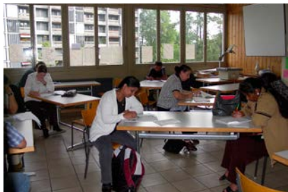
Za privremeno zaposlene mogućnost usavršavanja

Vlasti i organizacije uključene u integracioni dijalog zajedno su ustanovile 15 ciljeva, kako bi poboljšali integraciju zaposlenih imigranata. Po riječima predsjednika TAK-a, Guya Morina, većina ciljeva je ostvarena. Ponude za informisanje poslodavaca i zaposlenih znatno su poboljšane,