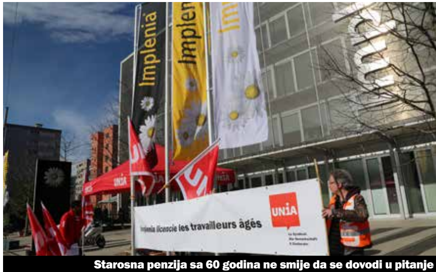
Starosna penzija sa 60 godina ne smije da se dovodi u pitanje

Već u decembru prošle godine je Livio*, otpušten 14 mjeseci prije penzionisanja, ponovo zaposlen u Impleniji nakon medijske kampanje sindikata Unija. Najveća firma švajcarskog građevinskog sektora izvinila se za takvo ophodjenje i obećala poboljšanje. Unija je iskoristila priliku da se suprotstavi Impleniji sa sličnim slučajevima. Riječ je o starijim građevinskim radnicima, koji su otpušteni samo nekoliko mjeseci prije penzionisanja. Njih treba ponovo zaposliti. «Implenija je u januaru obećala da će sa Unijom razgovarati o tome», izjavio je Yves Mugny, nadležni za građevinu. «Međutim, poslije toga ništa nismo čuli od njih.» Sindikat je krajem januara pokušao da ugovori novi sastanak sa Implenijom. Uzalud. Zbog toga su tri radnika protestovala 23. februara ispred ženevskog sjedišta zajedno sa Unijom.