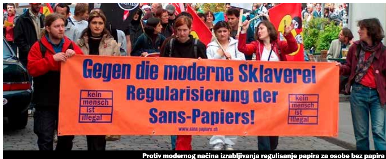
Protiv modernog načina izrabljivanja regulisanje papira za osobe bez papira