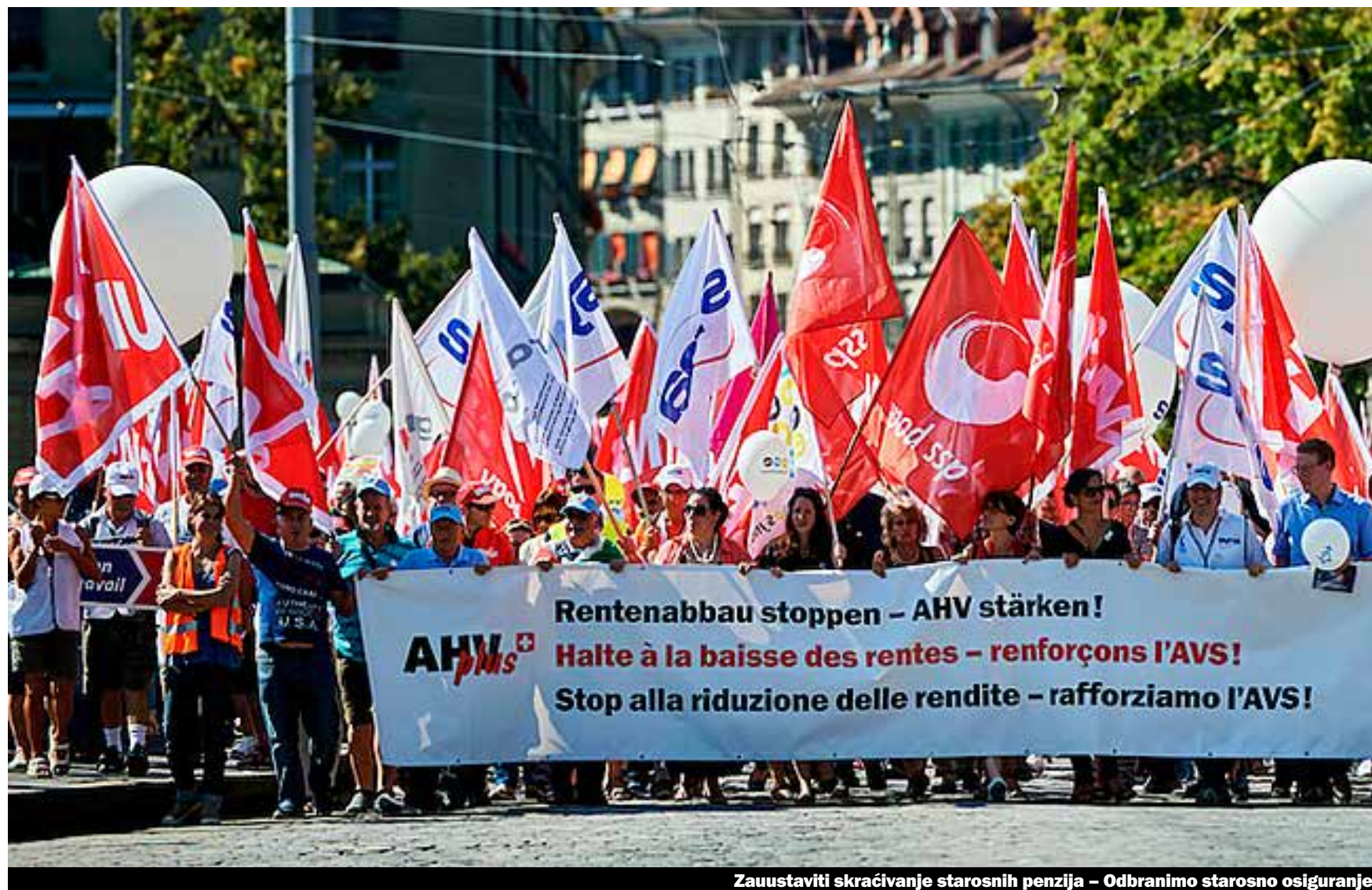
Zauustaviti skraćivanje starosnih penzija - Odbranimo starosno osiguranje

Reforma starosnog osiguranja 2020 je reforma 1. i 2. Stuba osiguranja. To obuhvata starosno državno osiguranje i drugi stub tkzv. penzionu kasu ili profesionalno starosno osiguranje. Ova reforma nudi priliku da se strukturni problemi penzija u potpunosti riješe