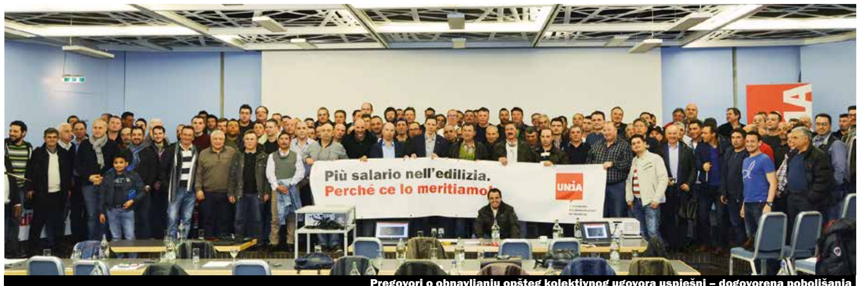
Pregovori o obnavljanju opšteg kolektivnog ugovora uspješni – dogovorena poboljšanja

Kampanja za plate 2017. Zaključena. Na dobro posjećenoj profesionalnoj konferenciji 4. marta 2017. u Bernu delegati su donijeli dva važna zaključka. Prihvatili su rezultat pregovora ZOU. Pozdravljeni su podijela naknade za bolovanje između radnika i poslodavca, osnovno pravo na platu kategorije B nakon tri godine, kao i sigurnost Parifonda. S druge strane, odbijanje građevinskih nadzornika da se povise plate bilo je podsticaj za mnogo diskusija i bijesa.