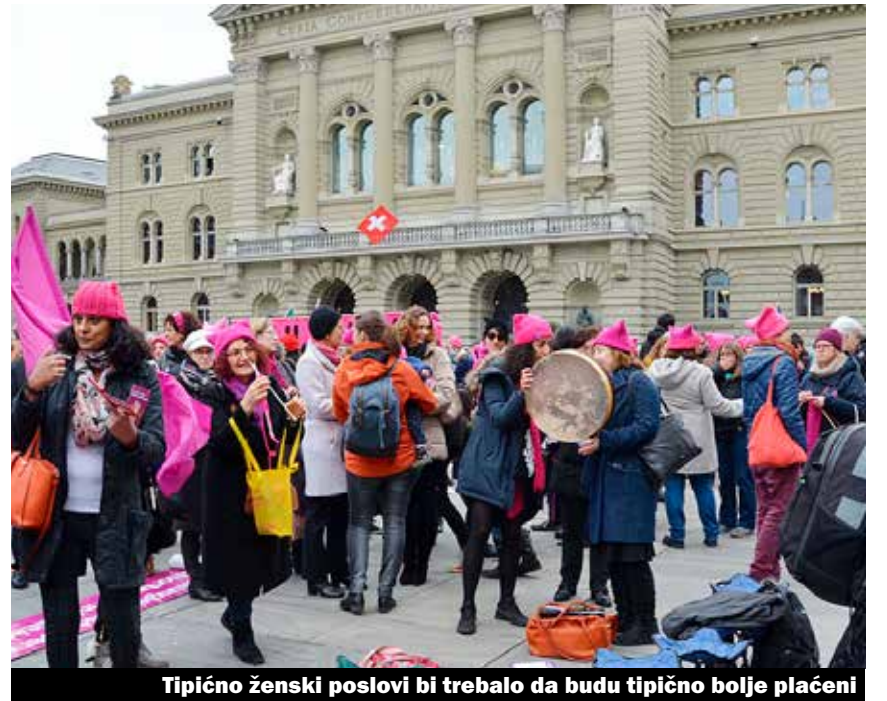
Tipično ženski poslovi bi trebalo da budu tipično bolje plaćeni