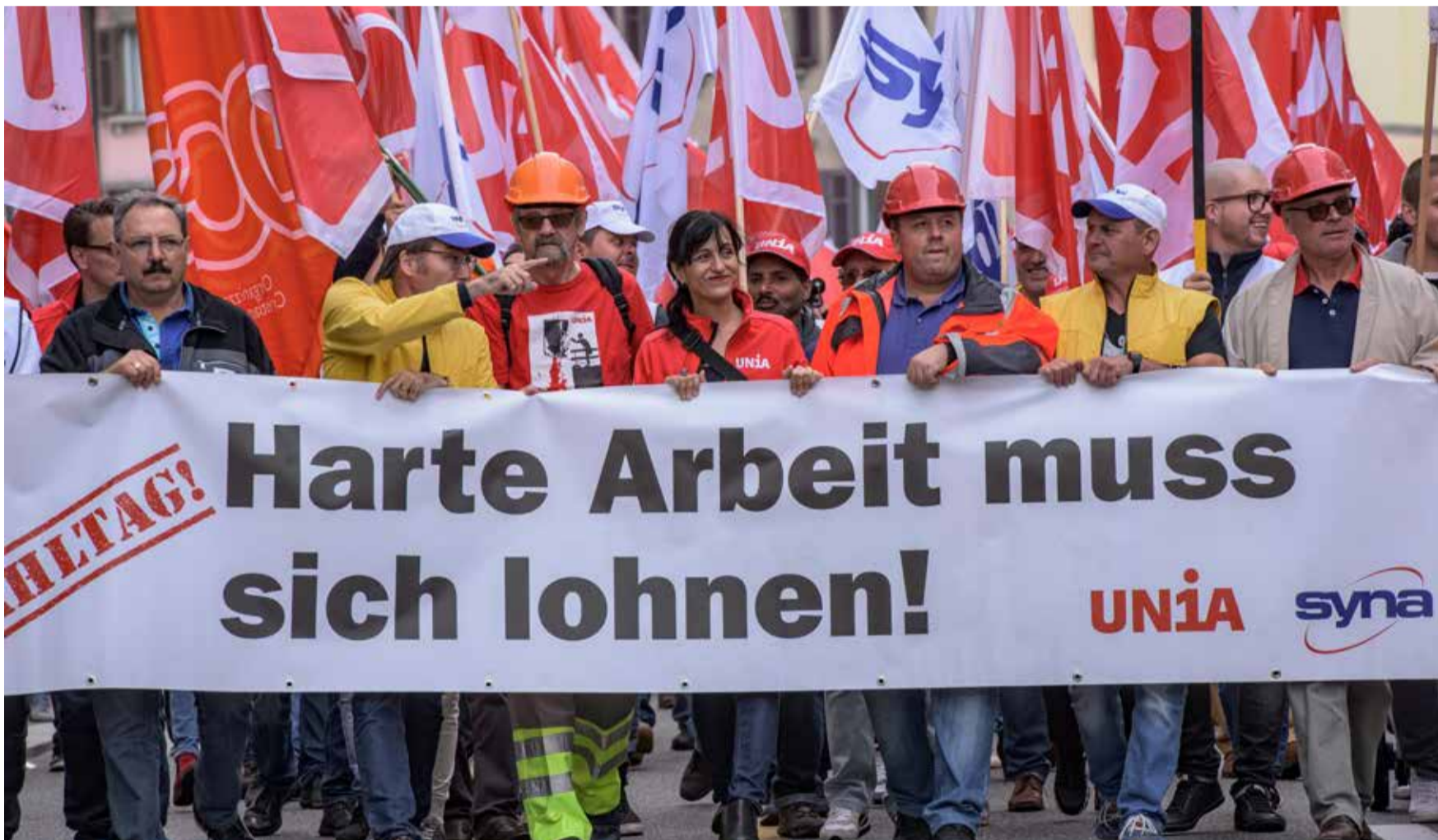
Naporan rad mora odgovarati da se plati, ista prava i za radnike zaposlene na određeno vrijeme

Privremeni rad doživljava pravi bum. U mnogim preduzećima se privremeni radnici zapošljavaju pod lošijim uslovima u odnosu na stalno zaposlene. A mnoga preduzeća ne prezaju ni od toga da otpuštaju zaposlene, kako bi na njihovo mjesto doveli privremeno zaposlene. Hitno je potrebno poboljšanje kolektivnog radnog ugovora (GAV), kako bi se zloupotreba privremenog zapošljavanja smanjila.