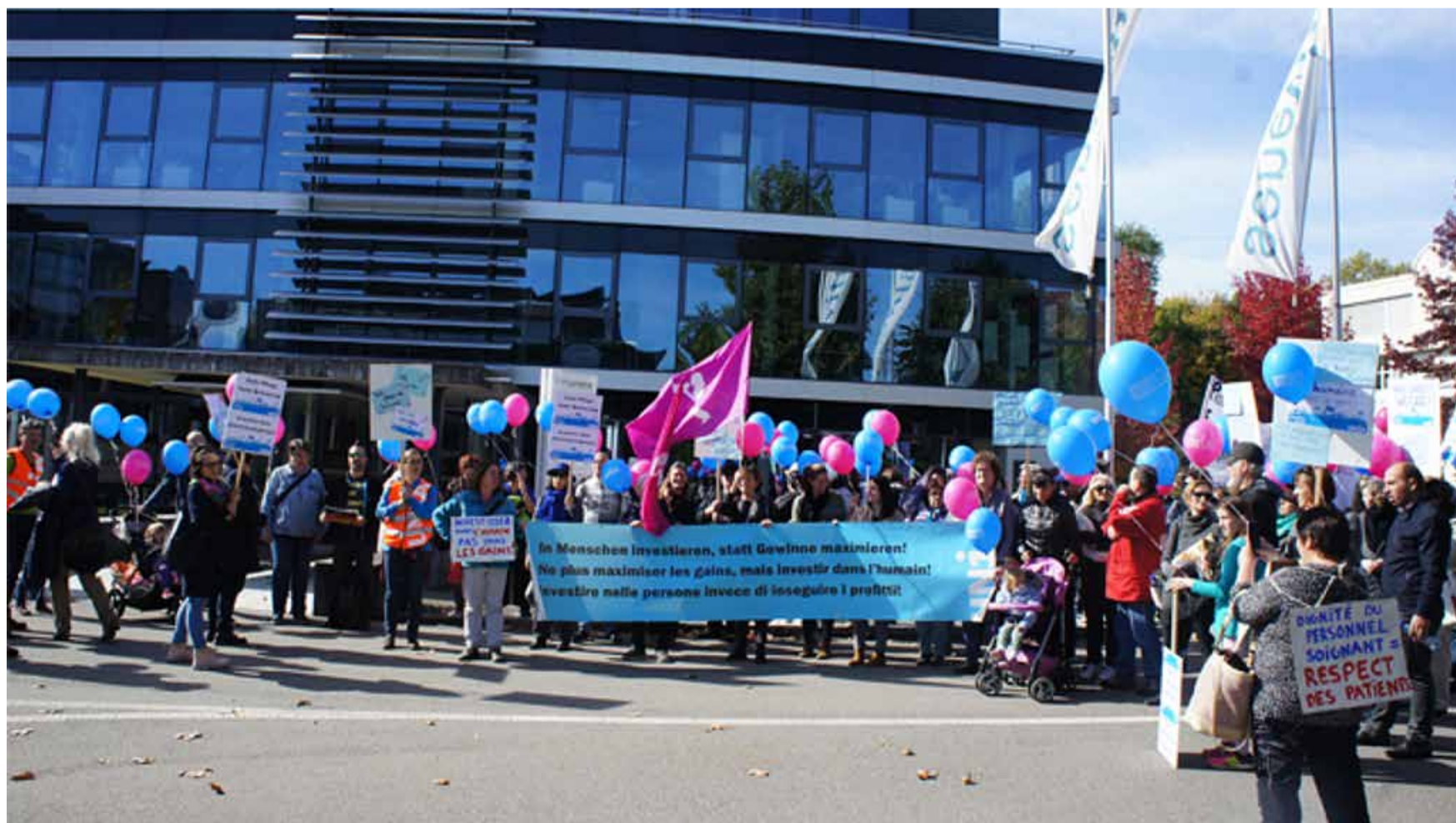
Ulaganje za ljude umjesto samo za profit- Pokažimo respekt prema pacijentima i njegovateljskim radnicima