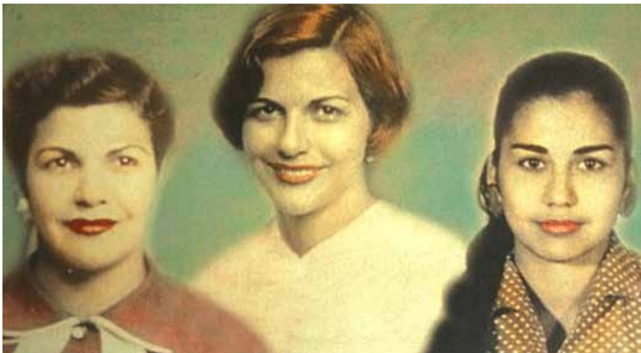
Ne postoji opravdanje za nasilje nad ženama