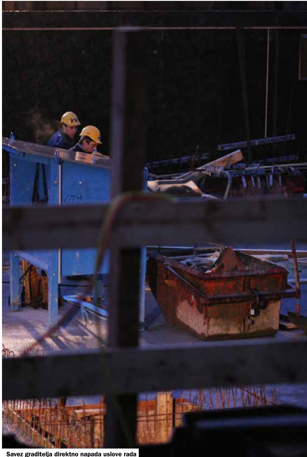
Savez graditelja direktno napada uslove rada