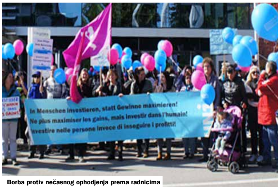
Borba protiv nečasnog ophodjenja prema radnicima