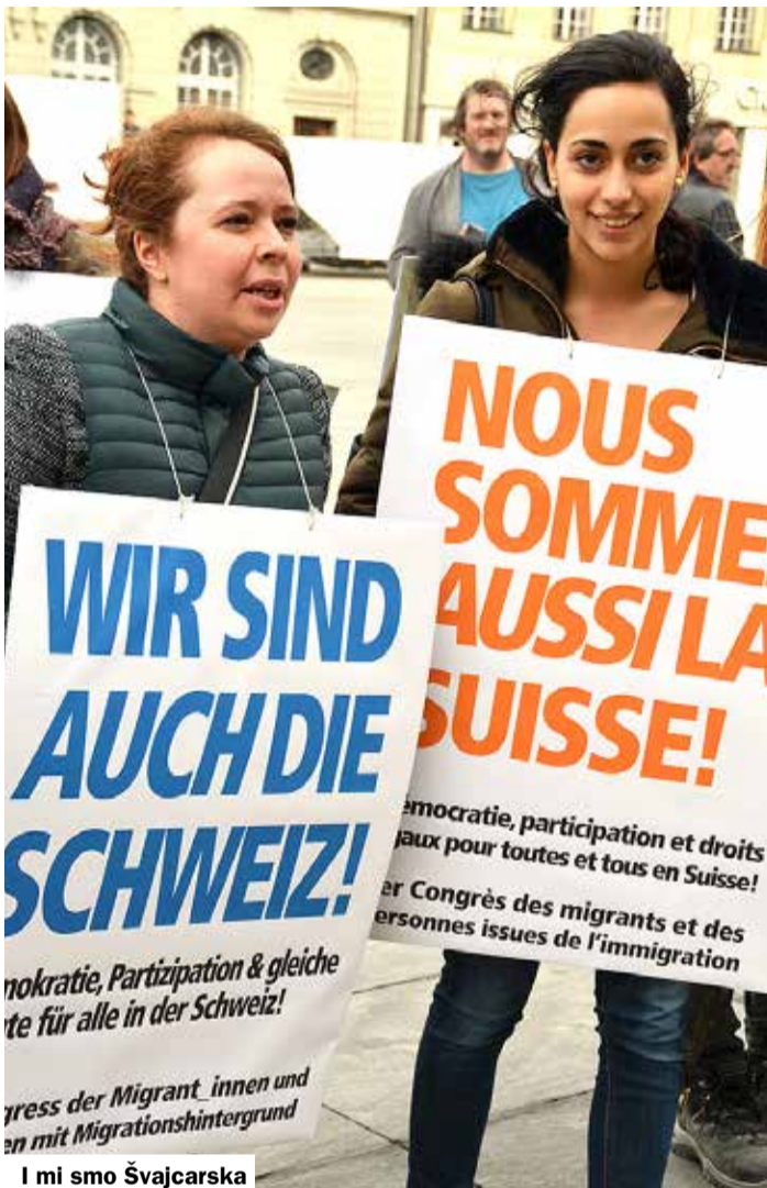
I mi smo Švajcarska