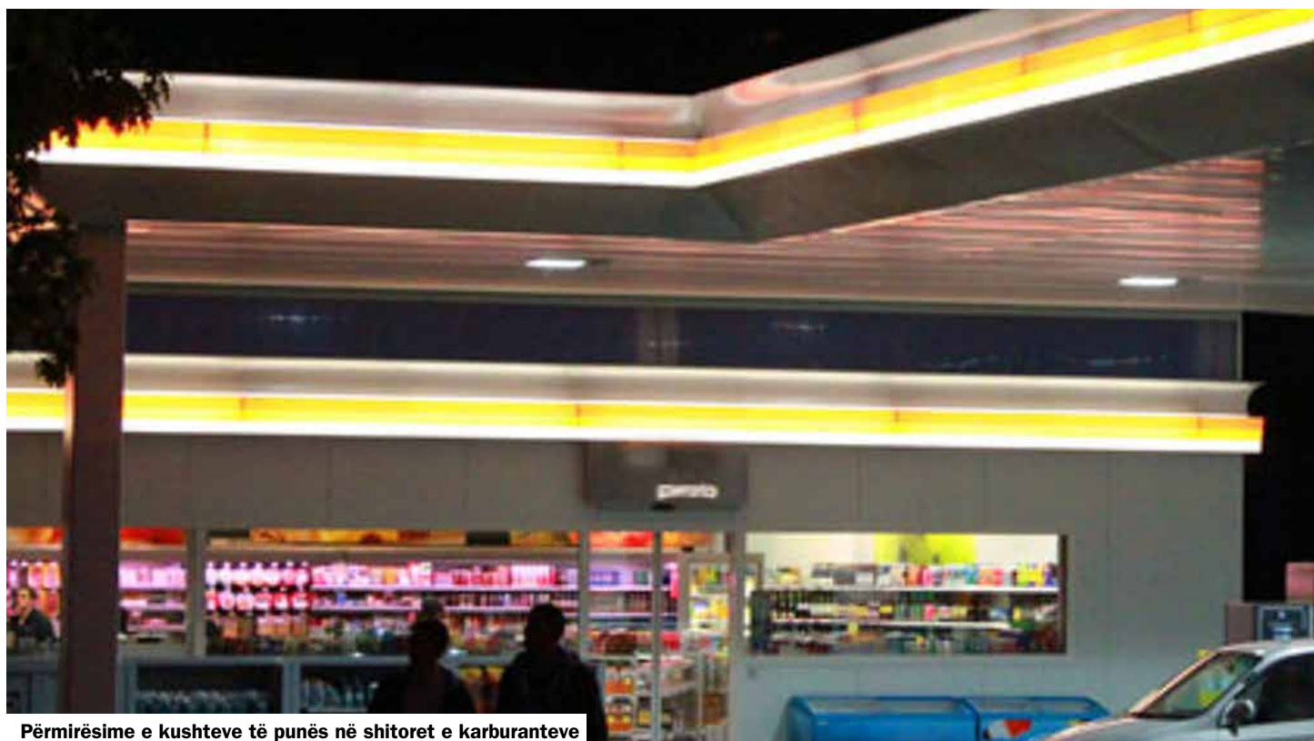
Përmirësime e kushteve të punës në shitoret e karburanteve