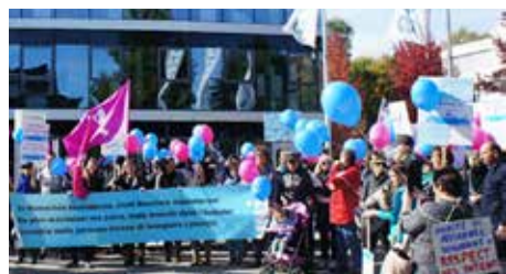
Protesta e personelit dhe të përkujdesurve

Kritika drejtuar Senevita vjen më së shumti nga shtëpitë e pleqve, të cilat janë hapur kryesisht në vitet e fundit. Që nga viti 2014 rrjeti Senevita është rritur nga 13 në 25 shtëpi pleqsh – dhe tanimë është ofruesi i dytë privat për nga madhësia në Zvicër. Senevita fillimisht ishte krijuar nga një zviceran dhe në vitin 2014 ishte blerë nga korporata franceze e përkujdesjes Orpea. Kjo është njëra ndër lojtarët më të mëdhenj në tregun e përkujdesjes në tërë botën.