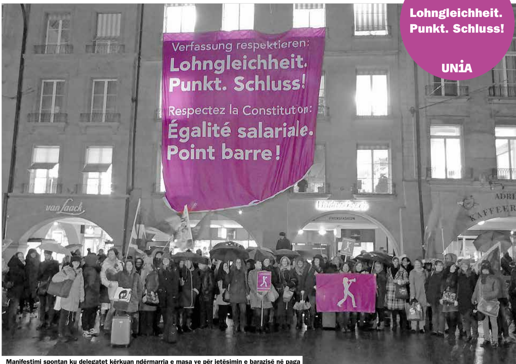
Manifestimi spontan ku delegatet kërkuar ndërmarrja e masa ve për jetësimin e barazisë në paga

Botohet si shtojcë në gazetën «work» | Redaksia T +41 31 350 21 11, F +41 31 350 22 11 | info@unia.ch | www.unia.ch