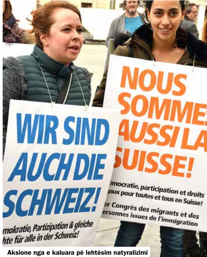
Aksione nga e kaluara për lehtësim natyralizimi