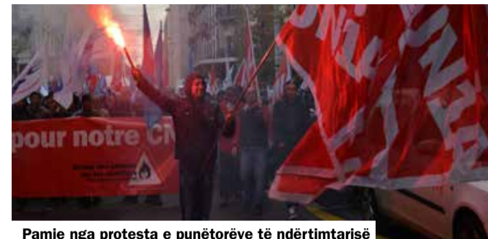
Pamje nga protesta e punëtorëve të ndërtimtarisë