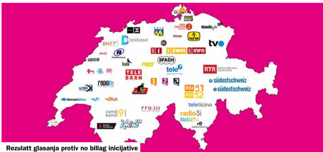
Rezultat glasanja protiv no billag inicijative

Kao privrženost javnim uslužnim djelatnostima može se posmatrati i jasno «da» finansijskom redu. Stanovništvo želi da savez pruži dobar javni servis i spremno je da za to i plati. To pokazuje i da je konačno došlo vrijeme da se direktni savezni porezi definitivno ukorene u Ustavu. Tako savez može da nastavi da i dalje sprovodi svoje javne zadatke.