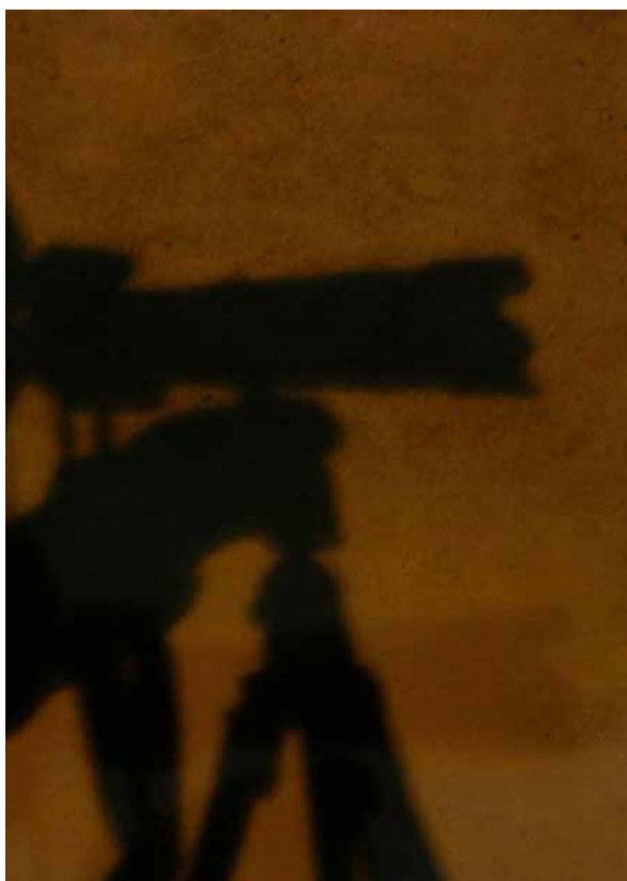
Na udaru svi korisnici socijalnih osiguranja, iako svi nisu prevaranti

Za korisnike penzija i dodataka na penziju je važno napomenuti da su obavezni, prije nego dobiju nalog, da prijave svaku promjenu. Svejedno da li će ta promjena uticati pozitivno ili negativno na njihovo rješenje, od njih se očekuje i zahtijeva da samoinicijativno prijave sve promjene. Na taj način mogu izbjeći neprijatnosti koje ih sleduju za slučaj neprijavlivanja nekih promjena iz njihovog života. (prihodi iz inostranstva, ostvarivanje prava na penziju iz inostranstva, promjen abračnog stanja, stana itd.)