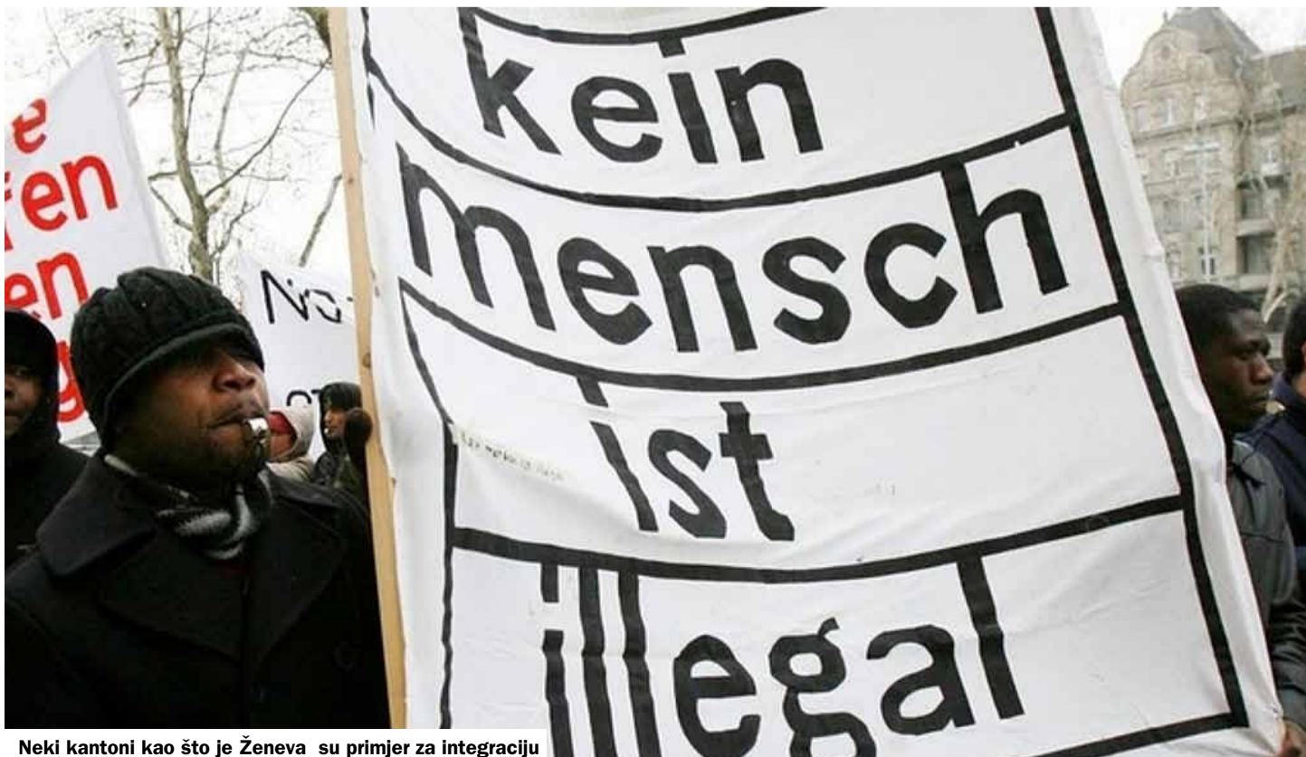
Neki kantoni kao što je Ženeva su primjer za integraciju