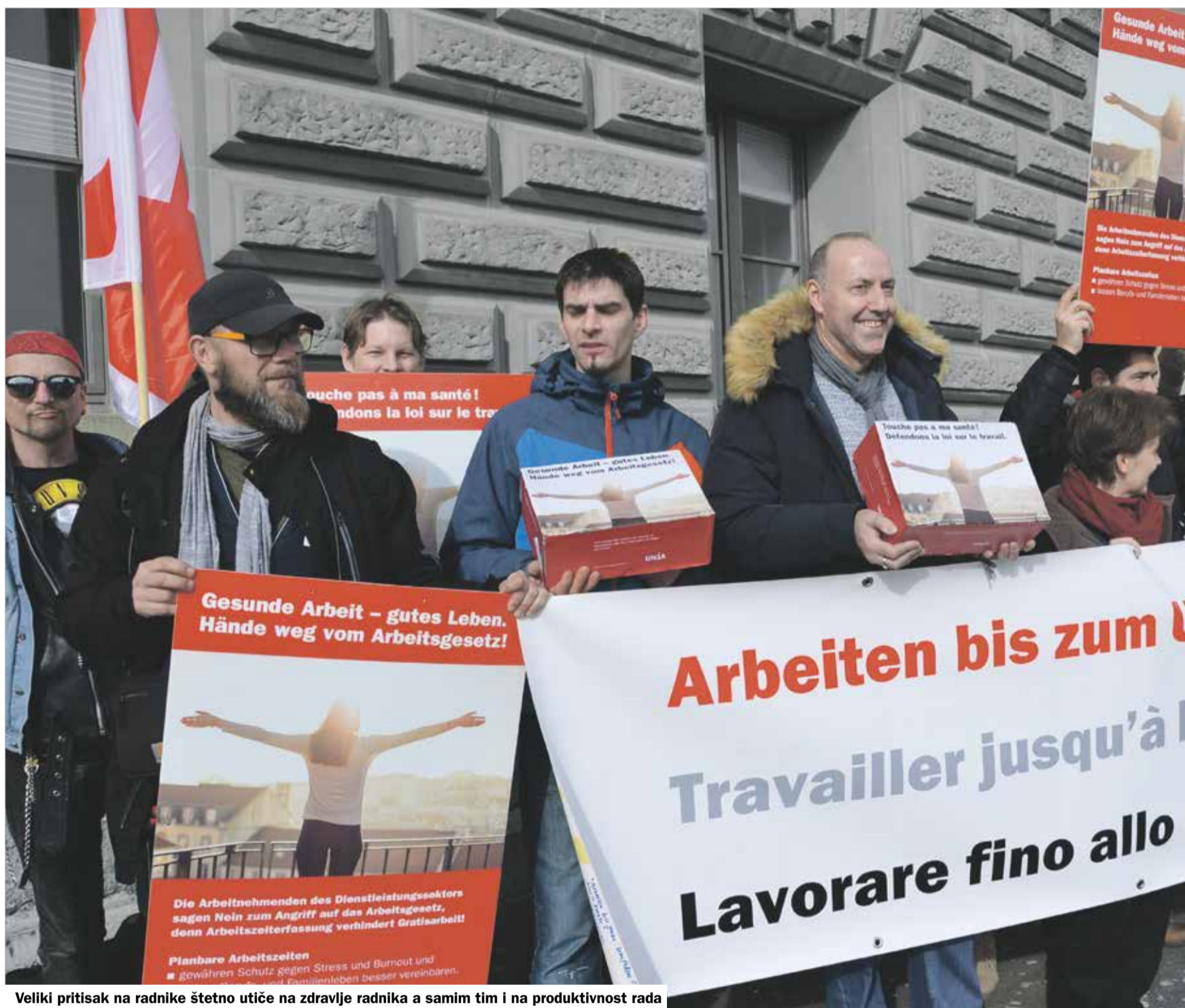
Veliki pritisak na radnike štetno utiče na zdravlje radnika a samim tim i na produktivnost rada

Dodatak «work» novinama | Redakcija T +41 31 350 21 11, F +41 31 350 22 11 | info@unia.ch | www.unia.ch