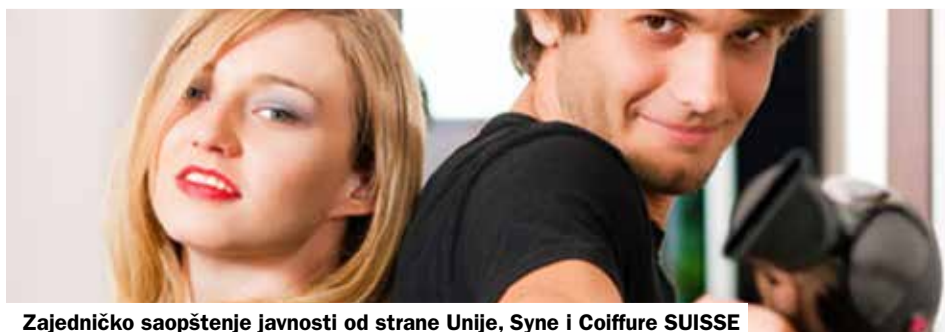
Zajedničko saopštenje javnosti od strane Unije, Syne i Coiffure SUISSE

Za socijalne partnere je ORU za frizersku djelatnost bez sumnje napredak. Dogovori sadrže i poboljšanja radnih uslova za žene i porodice. Socijalni partneri usaglasili su se oko instrumenata za borbu protiv prividnog preduzetništva i pseudo-praksi. Takođe su preduzeli mjere kako bi se poboljšala kontrola, posebno u Tessinu. Sada se svi nadamo da ćemo ovim novim ORU-om moći učinkovitije da se borimo protiv dampaing platama.