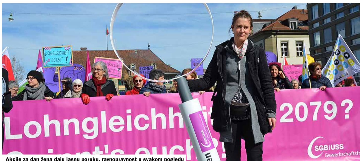
Akcije za dan žena daju jasnu poruku, ravnopravnost u svakom pogledu

Njemačka socijalistkinja Klara Cetkin je na Drugoj međunarodnoj socijalističkoj konferenciji žena 27.08.1910. predložila da se uvede međunarodni dan žena protiv volje njenih partijskih kolega muškaraca, bez posebne favorizacije nekog odrijeđenog datuma. ideja za datum došla je iz SAD-a. Tamo su žene Američke socijalističke partije (SPA) 1908. osnovale Međunarodni komitet žena, koji je odlučio da pokrene poseban nacionalni dan borbe za pravo glasa za žene. Prvi dan žena proslavljen je 19.03.1911. u Danskoj, Njemačkoj, Austrougarskoj i Švajcarskoj. Od 1921. on se održava 08. marta. Tekst «Međunarodni dan žena» preuzet je sa www.kleiner-kalender.de .