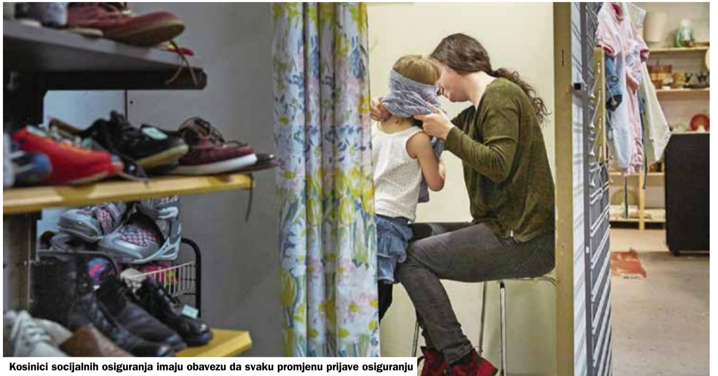
Kosinici socijalnih osiguranja imaju obavezu da svaku promjenu prijave osiguranju

Usvajanjem odluke desničara da invalide mogu provjeravati šta rade u svojim stanovima čak i posmatranje dronovima kako i kuda se kreću je izazvala žestoku polemiku medju desničarima i ljevičarskim strankama u Švajcarskoj.