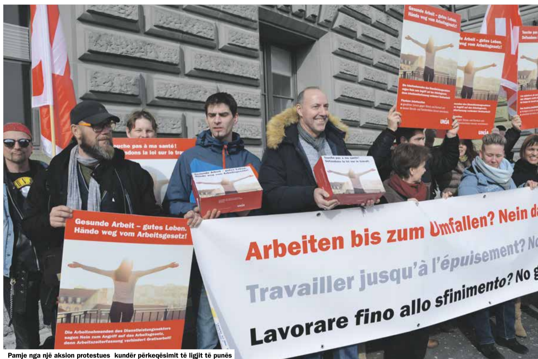
Pamje nga një aksion protestues kundër përkeqësimit të ligjit të punës

Botohet si shtojcë në gazetën «work» | Redaksia T +41 31 350 21 11, F +41 31 350 22 11 | info@unia.ch | www.unia.ch