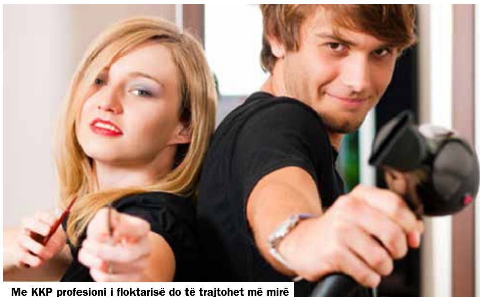
Me KKP profesioni i floktarisë do të trajtohet më mirë

Për partnerët social KKP-ja për floktari është pa dyshim një përparim. Kontrata përbën edhe përmirësime të kushteve të punës për gratë dhe familjet. Partnerët social janë pajtuar edhe për luftimin e vetëpunësimi fals dhe pseudo praktikantëve. Ata gjithashtu kanë ndërmarr hapa për të shtuar aktivitetin kontrollues veçanërisht në Tiçino. Tani shpresojmë të gjithë që përmes kësaj KKP-je të ndikojmë më shumë kundër dumpingut në paga.