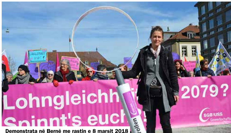
Demonstrata në Bernë me rastin e 8 marsit 2018

Teksti «Dita ndërkombëtare e gruas» është marrë nga www.kleiner-kalender.de