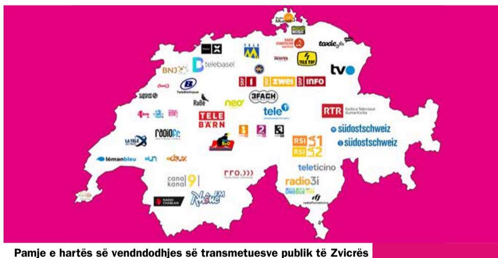
Pamje e hartës së vendndodhjes së transmetuesve publik të Zvicrës