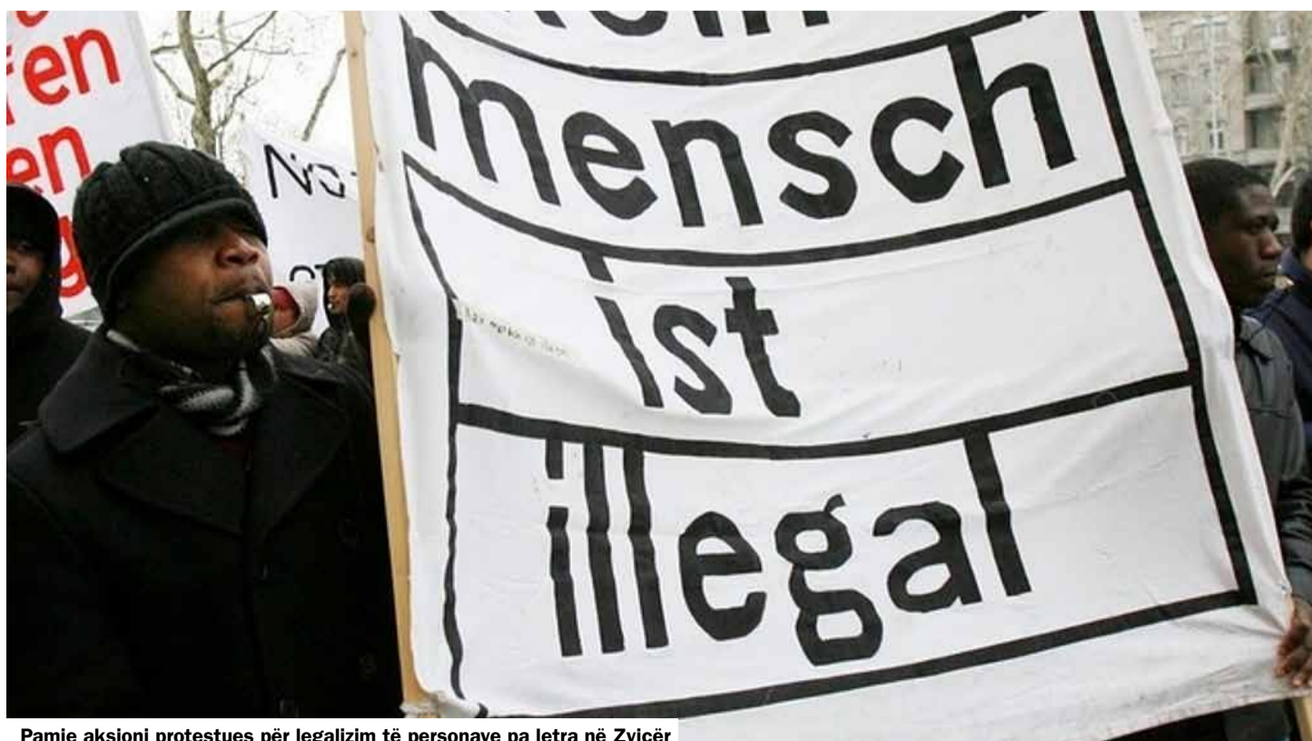
Pamje aksioni protestues për legalizim të personave pa letra në Zvicër