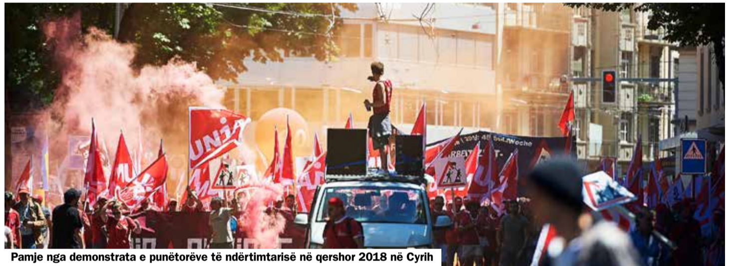
Pamje nga demonstrata e punëtorëve të ndërtimtarisë në qershor 2018 në Cyrih