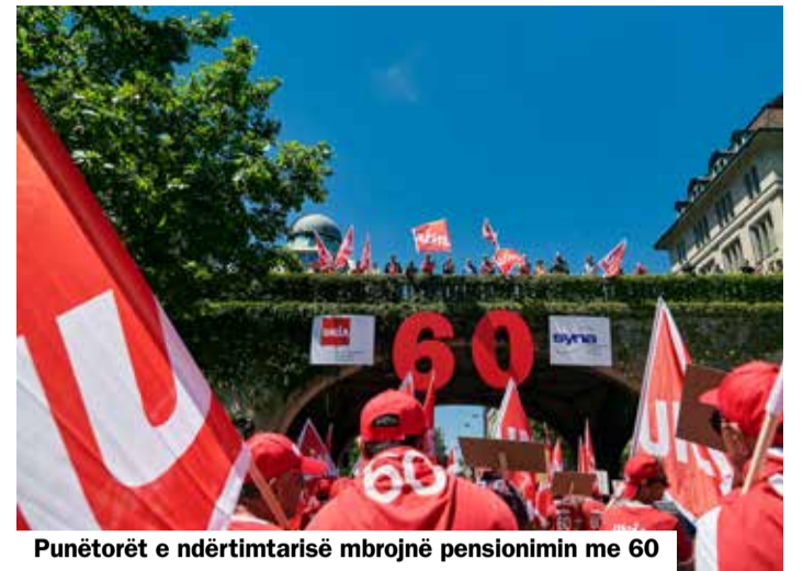
Punëtorët e ndërtimtarisë mbrojnë pensionimin me 60

Por: qysh tani ditët e punës për punëtorët e ndërtimtarisë janë të gjata. Tani duhen të mundësohen 300 orë fleksibel dhe të bëhet normë e re standarde 12 orë punë në ditë. Kjo është e paarsyeshme. Në të njëjtën kohë shoqata e pronarëve donë që punëtorët e moshuar, pas ndërrimit të vendin e punës ti zhvendosin në një shkallë më të ultë të pagës; dhe firmave nga jashtë Zvicrës tu mundësojë që punëtorët e tyre ti dërgojë këtu si «praktikantë» me paga