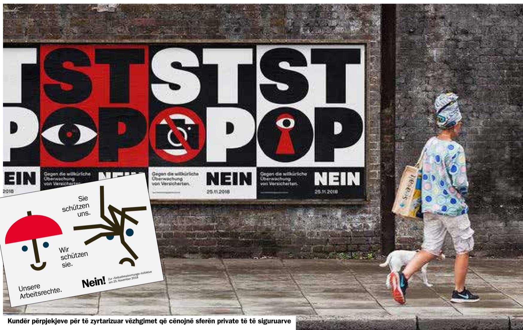
Kundër përpjekjeve për të zyrtarizuar vëzhgimet që çenojnë sferën private të të siguruarve

Më 25 nëntor do të votohet për dy çështje me rëndësi. Nën petkun e «vetëvendosjes», SVP/UDC (Partia Popullore e Zvicrës) përmes iniciativës «drejtësi zvicere në vend të gjyqtarëve të huaj» ia mësynë të drejtave njerëzore dhe atyre të punëmarrësve. Kësaj iniciative sindikata Unia i thotë qartas JO. Votimi tjetër popullor është kundër ligjit, i cili venë në pikëpyetje të drejtën për sferën private. Ky ligj i lejon detektivëve privat që pa leje a vendim të gjykatës të përgjojnë në dhoma banime dhe ballkone. Unia thotë JO!