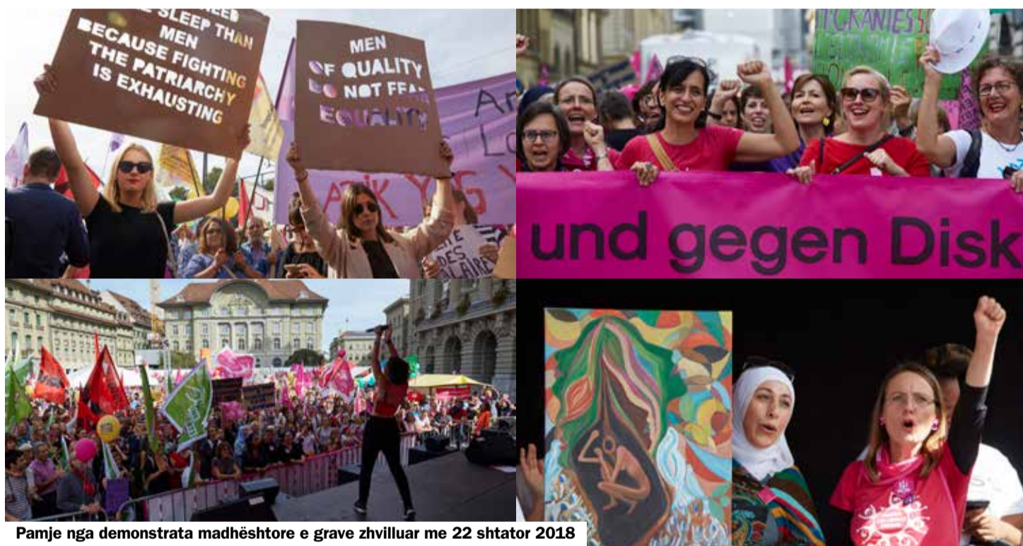
Pamje nga demonstrata madhështore e grave zhvilluar me 22 shtator 2018