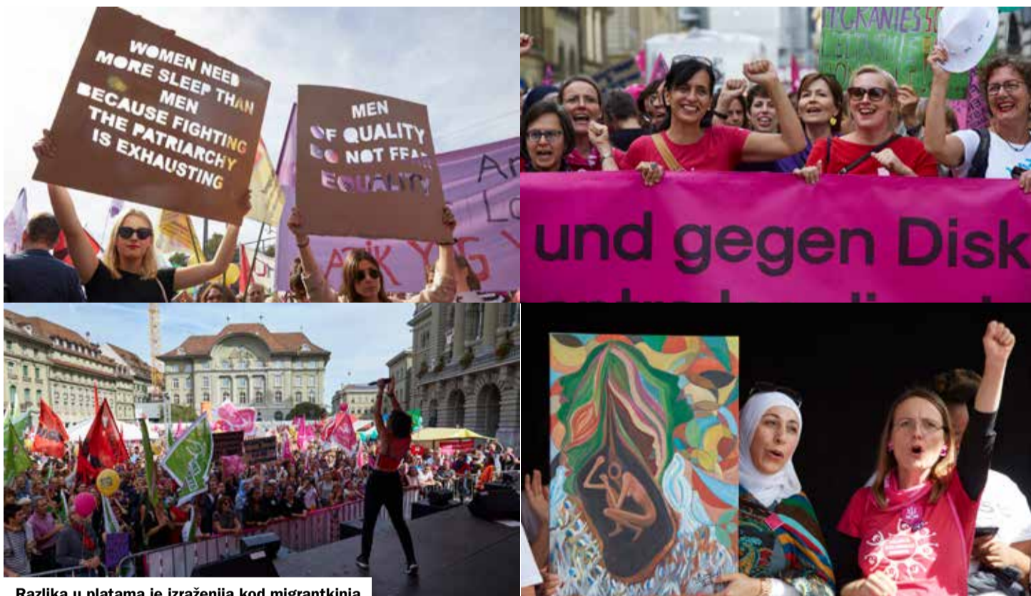
Razlika u platama je izraženija kod migrantkinja