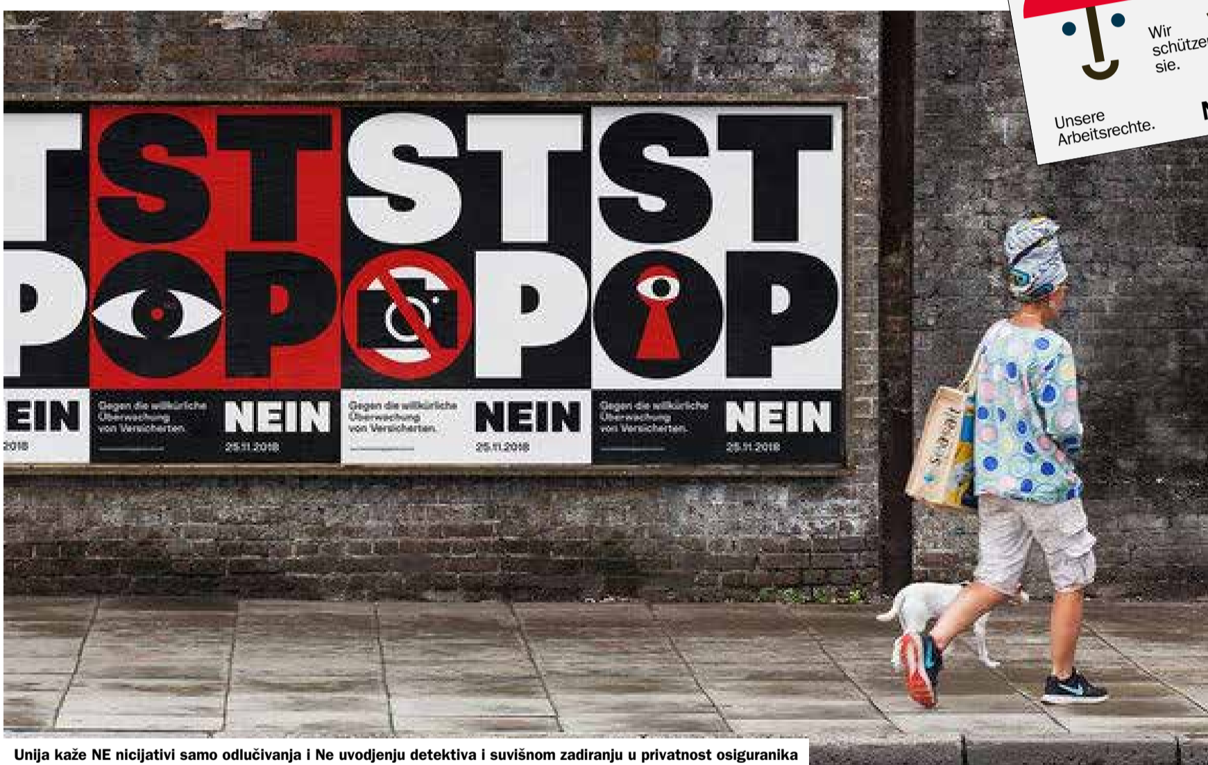
Unija kaže NE inicijativi samo odlučivanja i Ne uvođenju detektiva i suvišnom zadiranju u privatnost osiguranika

25. novembra 2018. na glasanje se stavljaju dva važna prijedloga. Pod pokrićem «samoodlučivanja» SVP-ova inicijativa «Švajcarsko pravo umjesto stranih sudija» napada prava čovjeka i zaposlenih. Ovoj inicijativi Unija jasno kaže NE. Drugi prijedlog je referendum protiv zakona, koji će privatnost dovesti u pitanje. Zakon koji bi trebao da dozvoli privatnim detektivima da bez sudske dozvole istražuju u dnevnim sobama i na balkonima mi ne podržavamo. Unija je protiv zakona koji će narušiti privatnost građana!