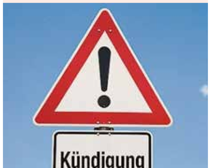
ZLUPOTREBA: Ako Vam firma nepravedno da otkaz, možete da na sudu tražite oštetu od najviše šest mjesečnih plata.