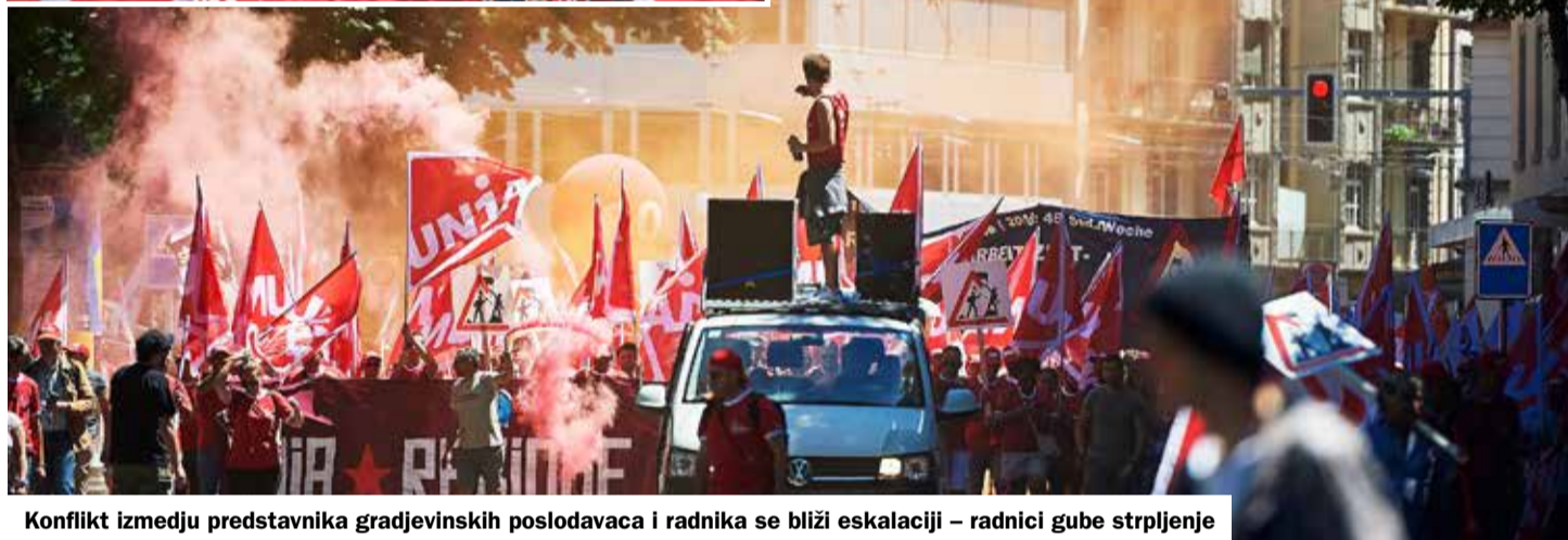
Konflikt između predstavnika građevinskih poslodavaca i radnika se bliži eskalaciji – radnici gube strpljenje