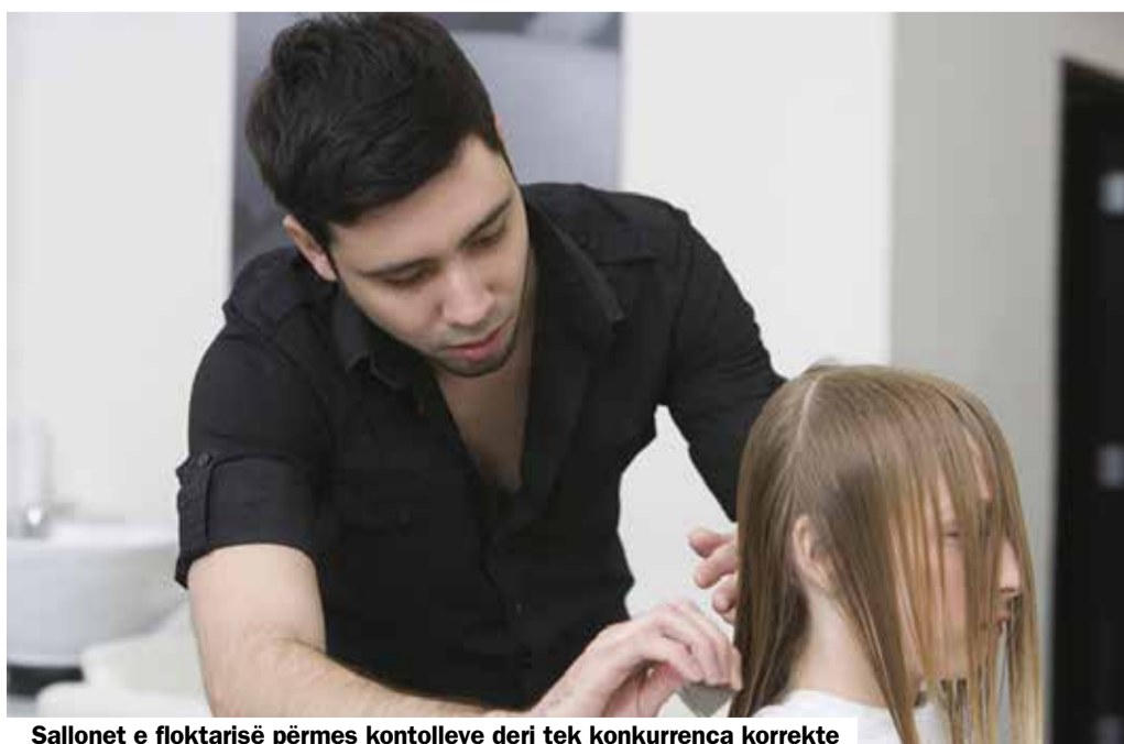
Sallonet e floktarisë përmes kontrolleve deri tek konkurrenca korrekte

Marrë nga kumtesa për media e sindikatës Unia e Syna si dhe shoqatës së salloneve zvicerane të floktarisë