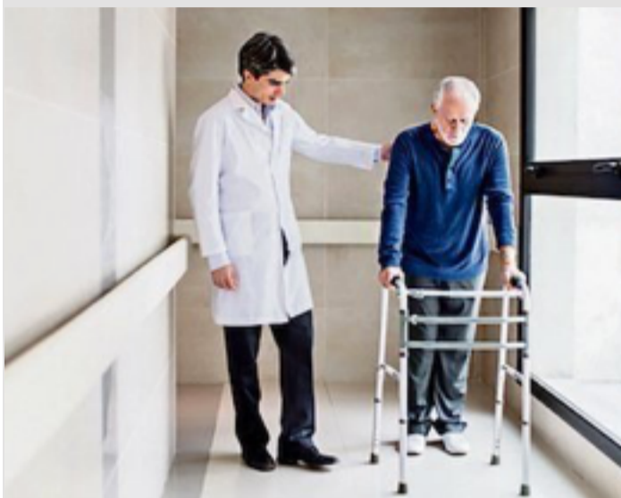
Aksidenti: Përderisa nuk jeni shëruar plotësisht, edhe pas pensionimit merrni mëdijtjen e kompensuar.

Unë kam pësuar aksident në janar të vitit 2018. Andaj unë nga sigurimi aksidental kam marrë mëdijtjen. Në nëntorin e fundit, sigurimi aksidental më ka komunikuar, që nuk do të mi paguaj më tej mëdijtjen, pasi unë do të pensionohesha në dhjetor. A është kjo procedurë e saktë?