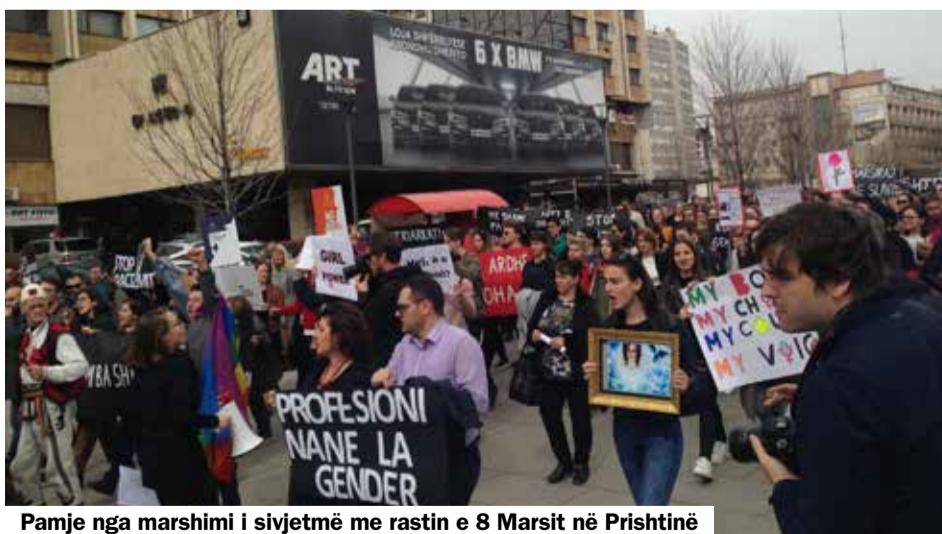
Pamje nga marshimi i sivjetmë me rastin e 8 Marsit në Prishtinë