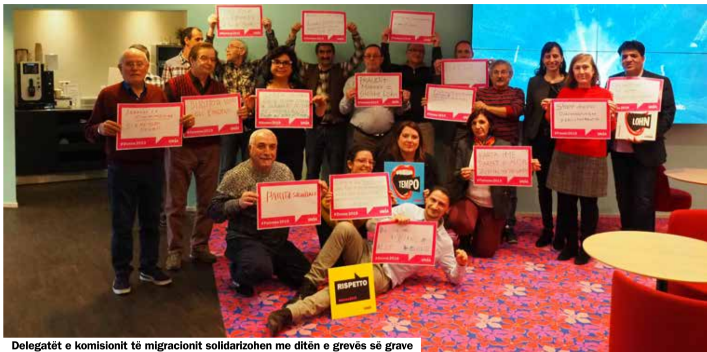
Delegatët e komisionit të migracionit solidarizohen me ditën e grevës së grave