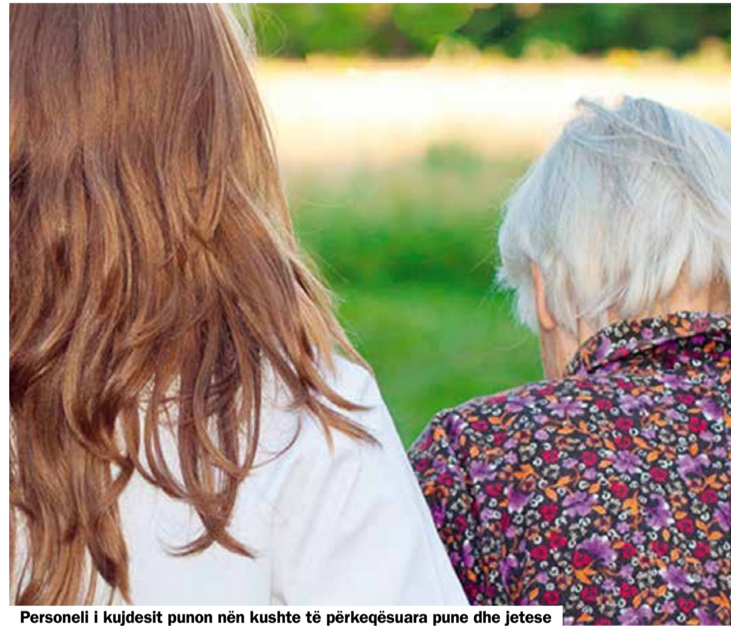
Personeli i kujdesit punon nën kushte të përkeqësuar pune dhe jetese