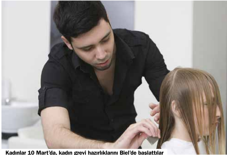
Kadınlar 10 Mart'da, kadın grevi hazırlıklarını Biel'de başlattılar

Socijalni partneri podvlače pozitivan bilans nakon godinu dana od stupanja na snagu kolektivnog ugovora za frizersku branšu. Minimalci i zahtjevanje stručnog usavršavanja doprinose porastu ugleda branše i poboljšanju budućih perspektiva za personal. Po pitanju široko rasprostranjenih damping plata socijalni partneri su odlučili da 2019. u salonima češće sprovedu nenajavljene kontrole radi održavanja kolektivnog ugovora.