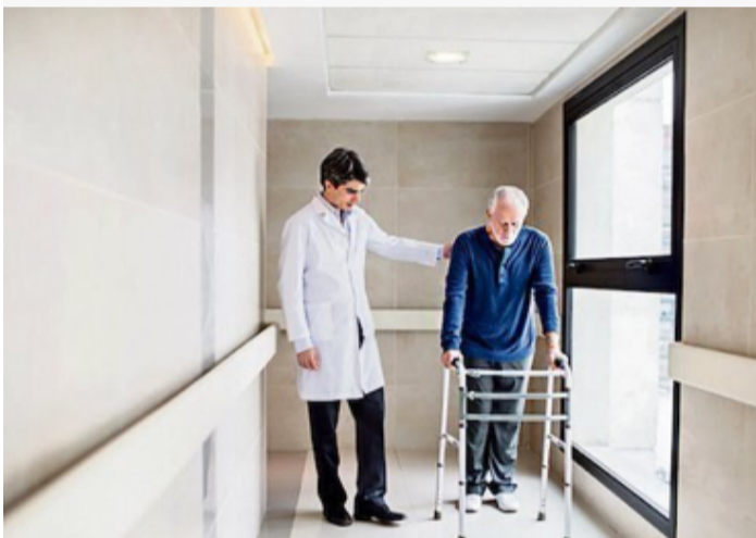
NESREĆA: sve dok niste potpuno izliječeni i nakon penzionisanja treba da dobijate dnevnice.