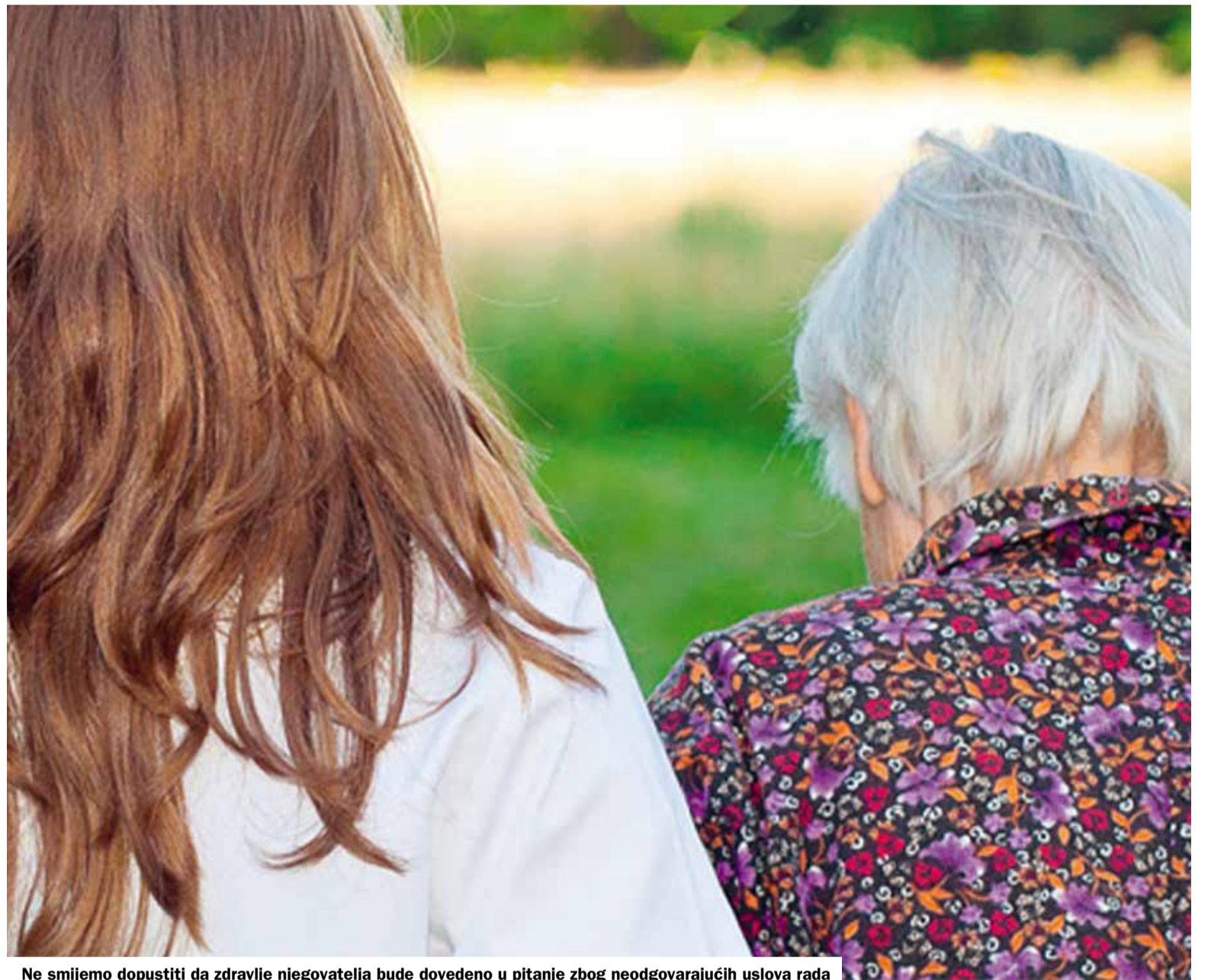
Ne smijemo dopustiti da zdravlje njegovatelja bude dovedeno u pitanje zbog neodgovarajućih uslova rada