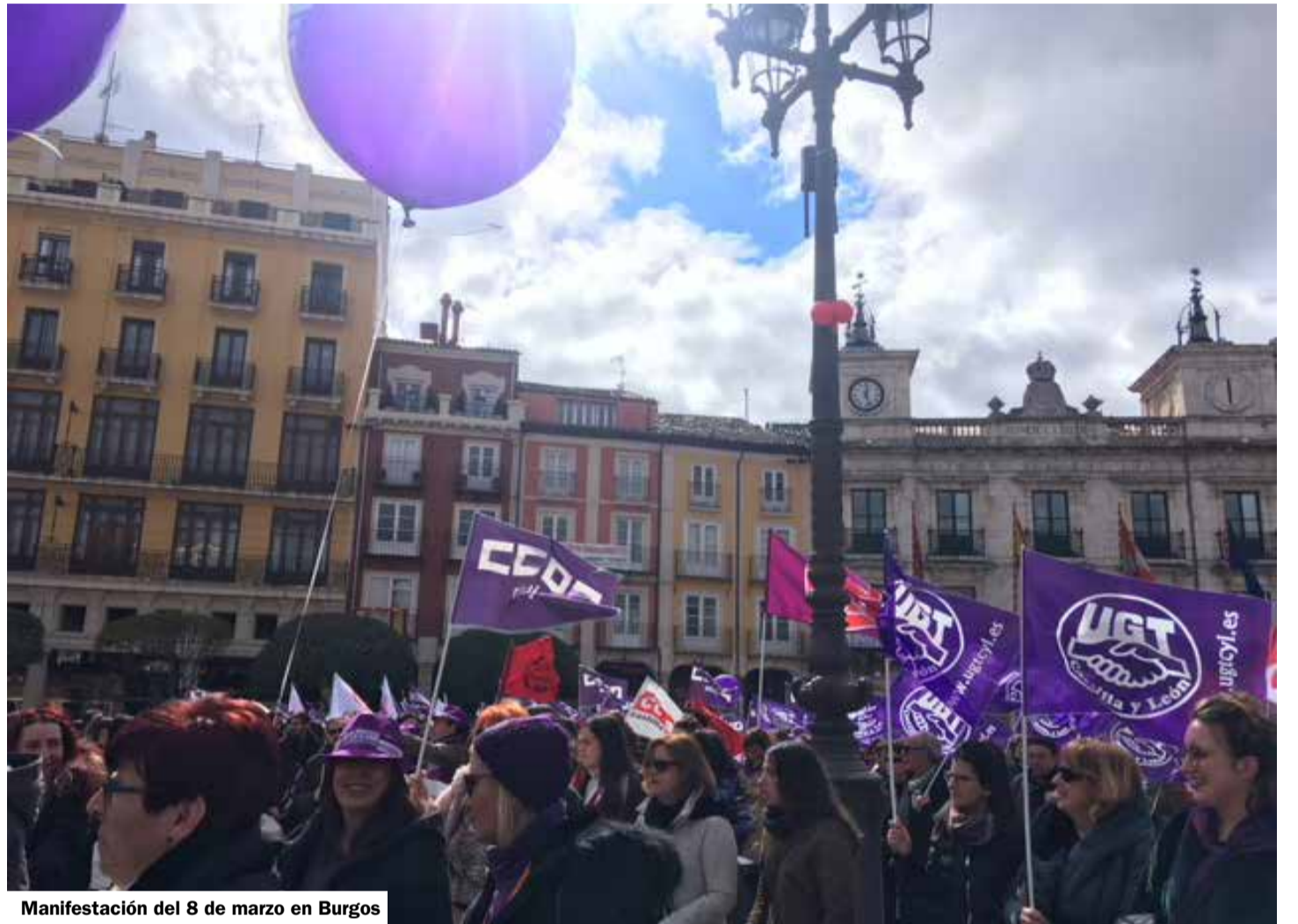
Manifestación del 8 de marzo en Burgos

Por segundo año consecutivo, el pasado 8 de marzo, Día Internacional de la Mujer, las mujeres españolas volvieron a tomar las calles para reivindicar la igualdad real de derechos entre los hombres y las mujeres, protestar frente a la violencia contra las mujeres y denunciar la grave situación que sufren muchas mujeres, tanto en el ámbito laboral, como en el familiar o privado.