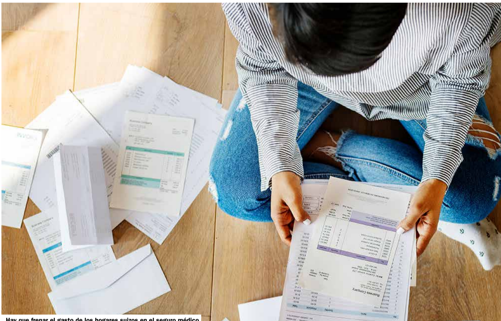
Hay que frenar el gasto de los hogares suizos en el seguro médico

Esto no puede continuar así: la salud no es un producto de lujo al que se pueda renunciar, sino algo esencial para tener una buena calidad de vida. Por lo tanto, es indispensable que el sistema de salud vuelva a ser asequible para todos. Esto es precisamente lo que se pretende con la iniciativa por primas accesibles.