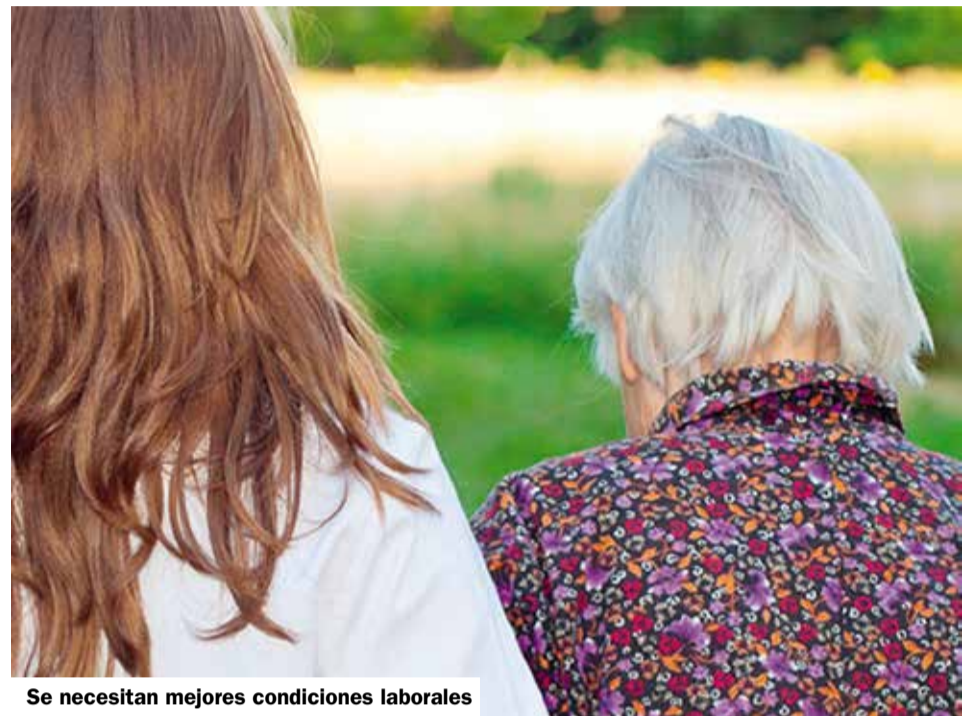
Se necesitan mejores condiciones laborales

Los problemas de salud son uno de los motivos por los que los/as cuidadores/as quieren dejar la profesión. Los/as encuestados/as afirmaron: el 70 por ciento están sujetos/as a un gran estrés durante el trabajo; el 86 por