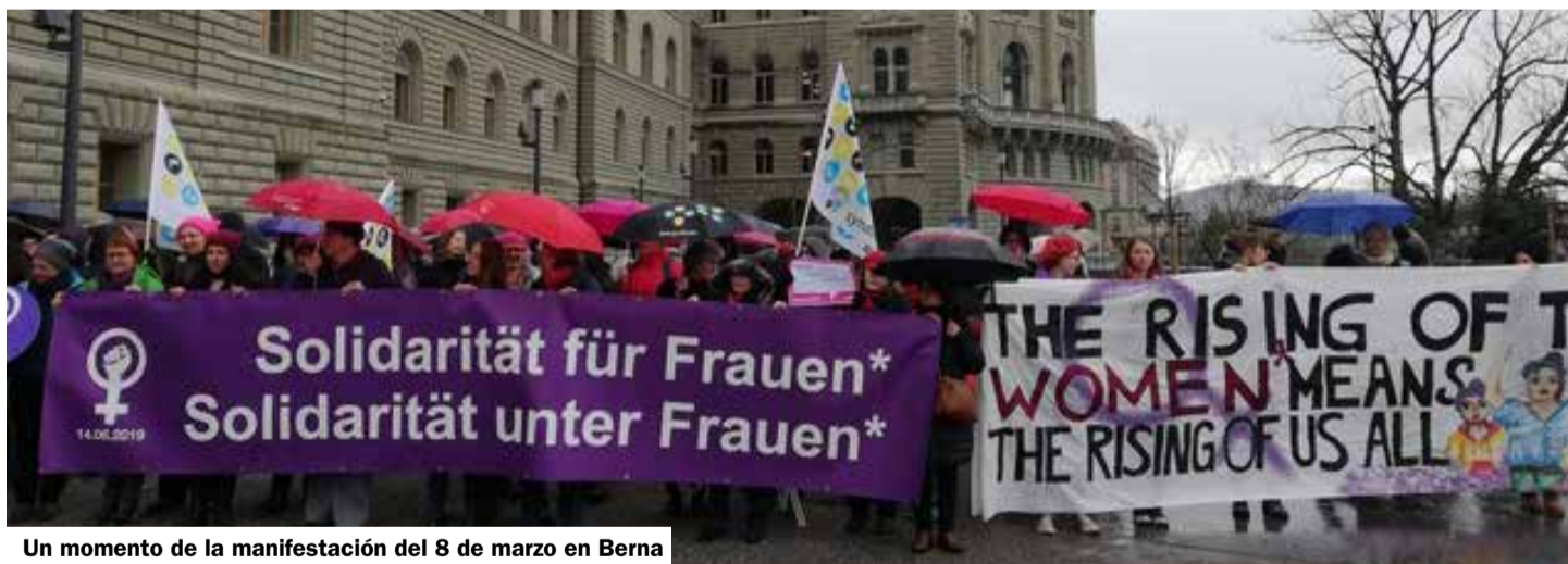
Un momento de la manifestación del 8 de marzo en Berna