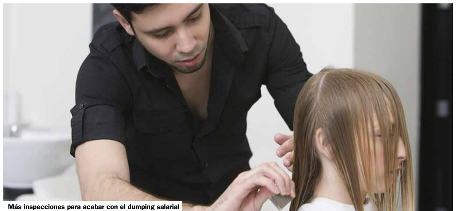
Más inspecciones para acabar con el dumping salarial