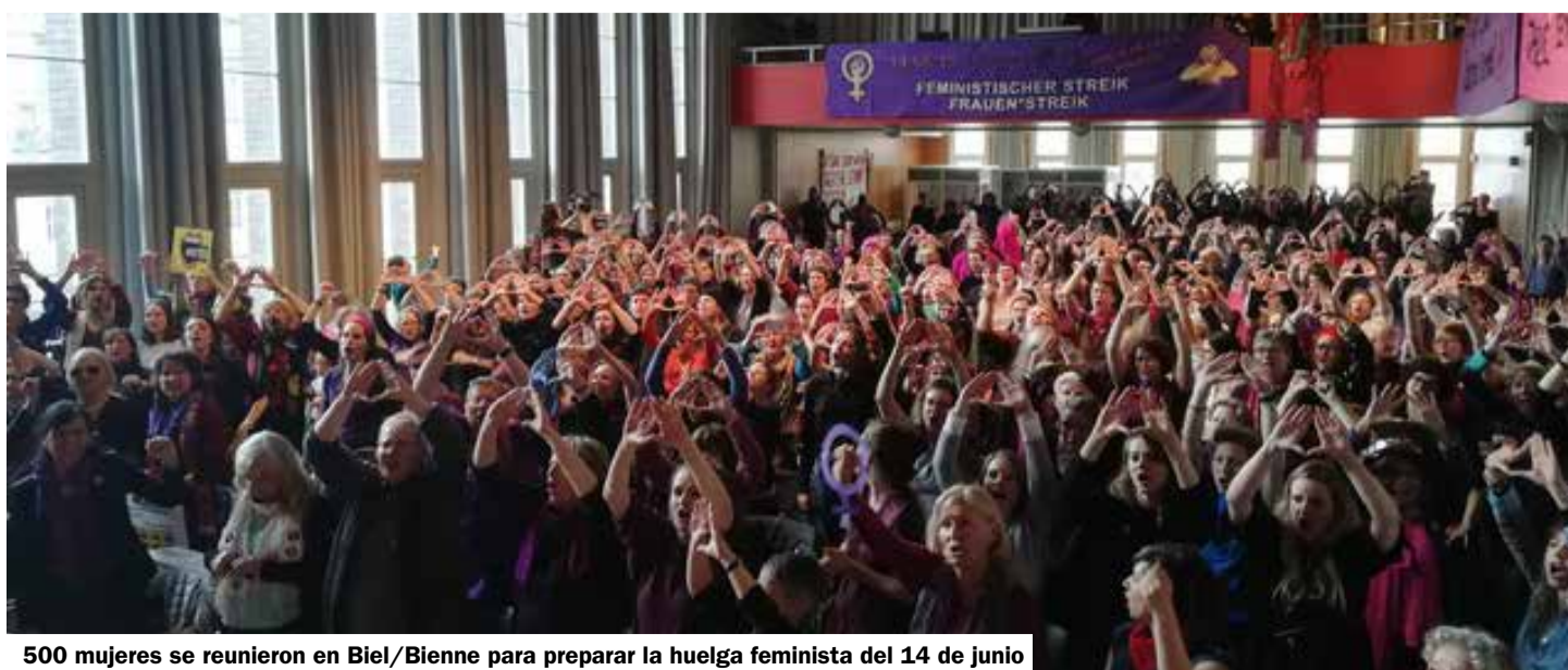
500 mujeres se reunieron en Biel/Bienne para preparar la huelga feminista del 14 de junio