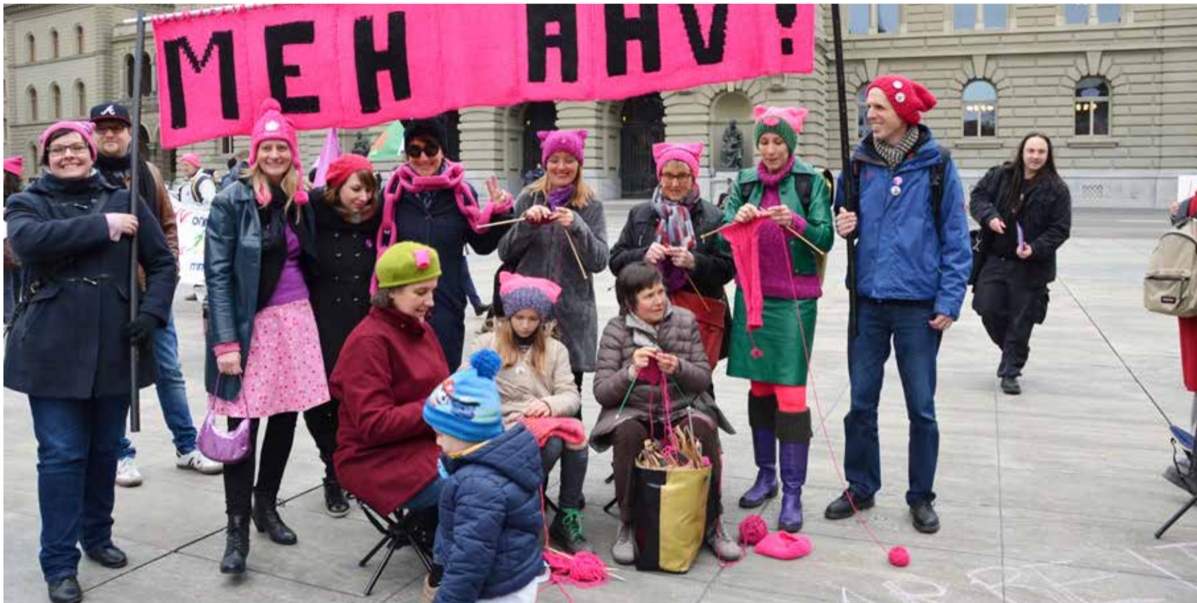
Ojačati starosno porodično osiguranje – osigurati penziju u starosti

Onaj ko je cijeli život radio zaslužuje da u starosti od svoje penzije dostojanstveno živi. U principu se većina ljudi slaže sa ovim. Međutim, starosno osiguranje stoji pred velikim izazovima, a situacija se zaoštrava. Jer penzije se smanjuju – iako privreda raste.