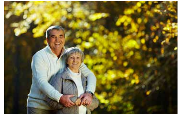
Izmjene u plaćanju doprinosa ali i u plaćanju iz fondova

Srednje premije obaveznog zdravstvenog osiguranja porašće u ovoj godini za 0,2%. Srednja premija u obzir uzima sve premije plaćene u Švajcarskoj i odgovara prosječnom opterećenju po osobi. Ovo je veoma skroman porast u odnosu na prethodne godine. Od 1996. premije u prosjeku rastu za 3,8% godišnje. Konkretno promjene za 2020. razlikuju se od kantona do kantona i variraju između -1,5% i 2,9%. U deset kantona (AG, BE, BS, LU, SH, SO, SZ, VD, ZG, ZH) će prosječna premija biti i niža. U pet kantona (AR, GR, NE, TI i VS) povećanje iznosi preko 1,5%. U preostalih jedanaest kantona (AI, BL, FR, GE, GL, JU, NW, OW, SG, TG i UR) porast je između 0 i 1,5%.