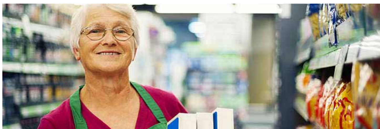
I pored svog dugogodišnjeg profesionalnog iskustva, stariji nezaposleni moraju pružiti dvostruko više napora protiv nezaposlenosti

Ovo nije prihvatljivo. Svi bi trebali imati pristup poslu koji im osigurava sredstva za život. Pravo da radite do penzije i da možete dostojanstveno završiti svoju profesionalnu karijeru je jedno od osnovnih ljudskih prava. Takođe bi trebalo razmotriti i specifične potrebe starijih radnika, posebno ako je riječ o dodjeljivanju fizički zahtjevnog posla.