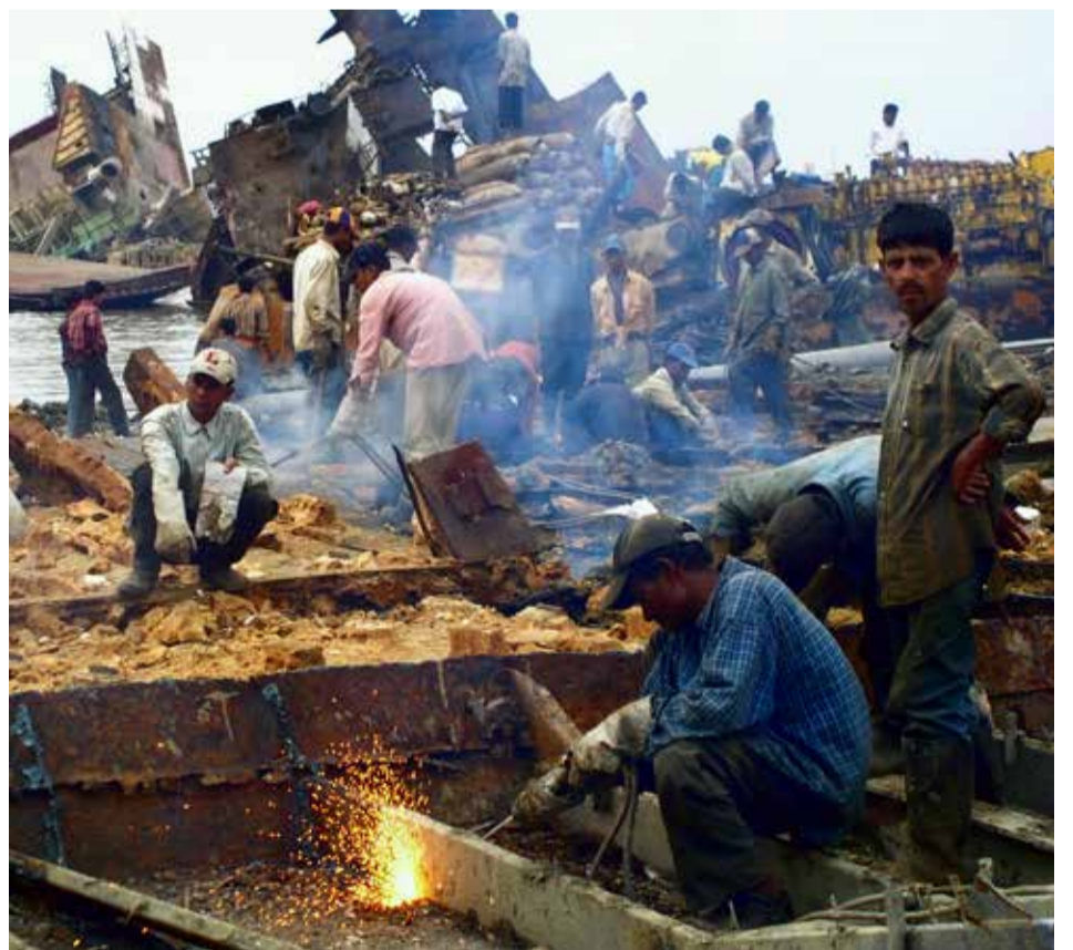
«Najopasniji posao na svijetu»: rezači brodova u Bangladešu

Nezavisni sindikati zalažu se za prava rezača brodova i bolju zdravstvenu zaštitu. Unija i Solidar Suisse podržavaju ovaj važan posao.