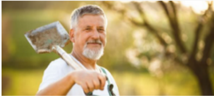
Baštovan van Penzije: ako radite i u penziji, morate da plaćate doprinose za AHV.

Uskoro punim 65, a tada ću primati penzije AHV-a i penzionog osiguranja. Međutim, i nakon penzionisanja bih volio da radim dio radnog vremena. Moram li onda i dalje uplaćivati doprinose za AHV?