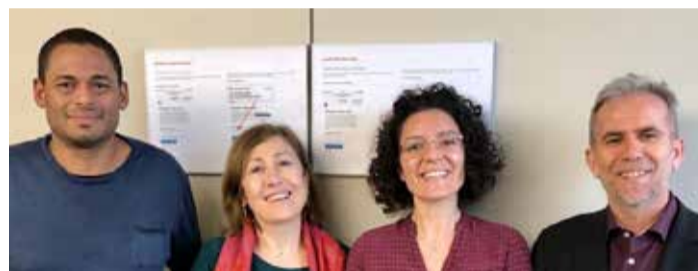
Migranti u Centralnom odboru sindikata Unia

Na sjednici centralnog odbora decembra 2019. sindikat Unija je odredio svoje ciljeve za 2020. Unija će se i u 2020. zalagati za prava zaposlenih, migranata, ista prava za sve, kao i socijalno i pravedno društvo, a boriti se protiv napada na Zakon o radu, diskriminacije i rasizma.