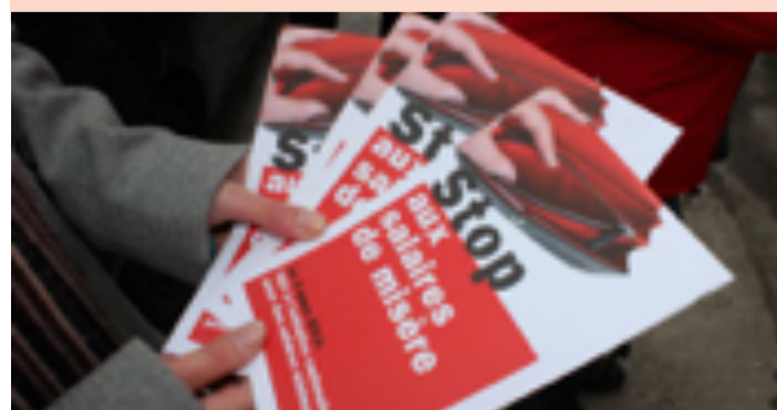
En marzo de 2013 los/as ciudadanos/as del Jura dijeron «Sí» al salario mínimo cantonal

Desde el pasado 1 de febrero los/as empleadores/as del cantón de Jura tienen la obligación de pagar un salario de, al menos, 20 francos por hora. La iniciativa cantonal, sobre la que se votó en el 2013, fue lanzada por el partido de los Jóvenes Socialistas (JUSO) y apoyada, entre otros, por el sindicato Unia. Tras años de debates, tergiversaciones y maniobras dilatorias, el salario mínimo cantonal de 20 francos por hora ya es una realidad en el cantón de Jura. Con ello, es el segundo cantón en el que se establece un salario mínimo. El primero fue Neuchâtel, el que en el 2017 desempeñó un papel pionero, fijando un salario mínimo por hora de 20 francos suizos. El Tesino será el tercer cantón, después del cantón de Jura, en introducir un salario mínimo. Tras la votación de una iniciativa de los Verdes en 2015, el Gran Consejo del Tesino aprobó una ley de aplicación el pasado mes de diciembre. A partir de 2021 se aplicará un salario mínimo por hora de entre 19 y 19,50 francos suizos, según el sector económico, el cual se irá incrementando gradualmente a lo largo de un periodo de tres años hasta alcanzar una cuantía de entre 19,75 y 20,25 francos suizos. Ginebra puede convertirse en el cuarto cantón de la lista, ya que el próximo 17 de mayo se votará sobre la iniciativa sindical «23 francs, c'est un minimum!». Y también en Basilea-Ciudad se está debatiendo sobre la introducción de un salario mínimo cantonal.