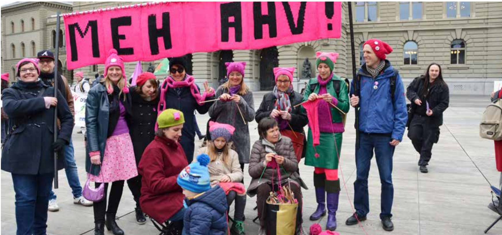
Las mujeres reivindican pensiones del seguro de vejez que les permitan llevar una vida digna tras la jubilación

Quien ha trabajado toda su vida, tiene que percibir una pensión que le permita vivir dignamente tras la jubilación. En principio, la mayoría de las personas están de acuerdo con esta afirmación. Sin embargo, el sistema de pensiones se enfrenta a grandes retos y la situación está cada vez más difícil. A pesar de que la economía crece, lo cierto es que la cuantía de las pensiones es cada vez menor.