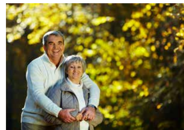
Cotizar más para poder disfrutar de una buena vejez

En el cantón Appenzell Rodas Exteriores el aumento de los subsidios familiares tendrá lugar a partir del 1 de abril del 2020: el subsidio por hijo/a pasará a 230 francos (anteriormente 200) y el de formación a 280 francos (anteriormente 250).