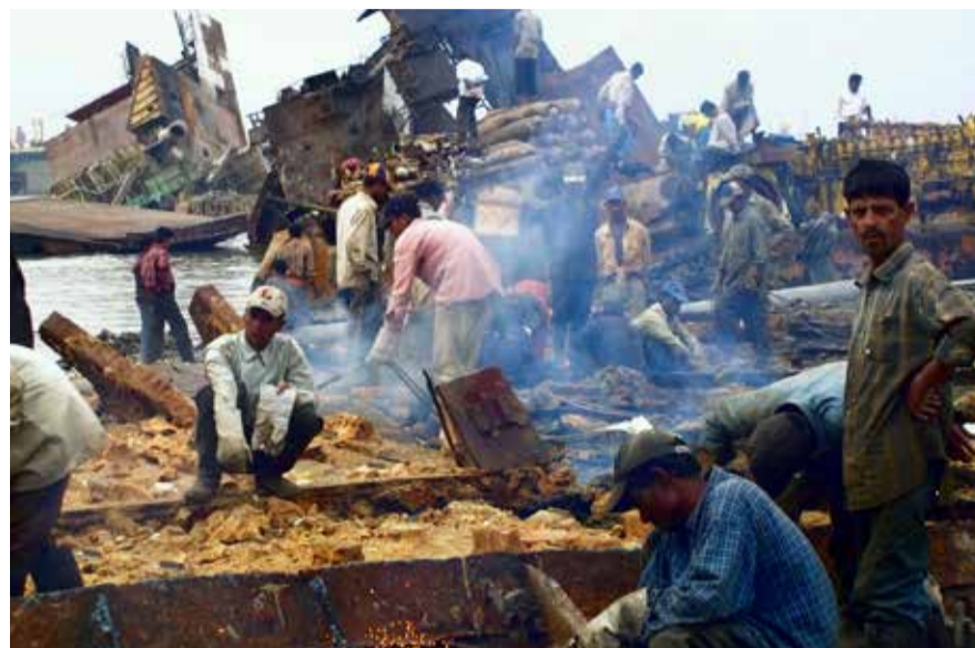
«El trabajo más peligroso del mundo»: Desguazador de barcos en Bangladesh

Por ello, el Unia está luchando por una prohibición mundial del amianto. A través de la organización Solidar Suisse, apoya las campañas sindicales en varios países asiáticos que reclaman una mejor protección y atención a los afectados/as, así como, una prohibición general de la utilización de este material.