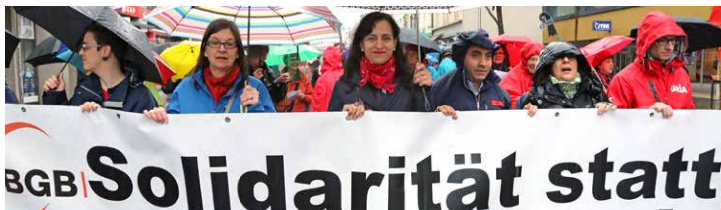
Hay que luchar frente a las medidas de exclusión de las personas más vulnerables y necesitadas

Todas las fuerzas progresistas deben luchar con determinación frente a esto, es una cuestión de justicia y dignidad para las personas necesitadas, independientemente de cual sea su estatuto de residencia. ¡Hay que parar los ataques a las personas que perciben ayuda social!