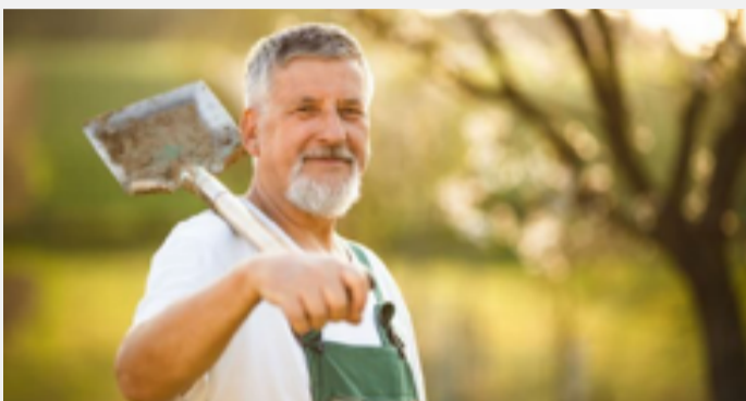
JARDINERO JUBILADO: Si quiere continuar trabajando tras la jubilación, tiene que seguir cotizando al seguro de vejez AHV/AVS.

Cumpliré pronto los 65 años y cobraré la pensión del seguro de vejez de la AHV/AVS y la de la Caja de Pensiones. Sin embargo, me gustaría seguir trabajando un poco. ¿Tengo que seguir cotizando para el seguro de AHV/AVS?