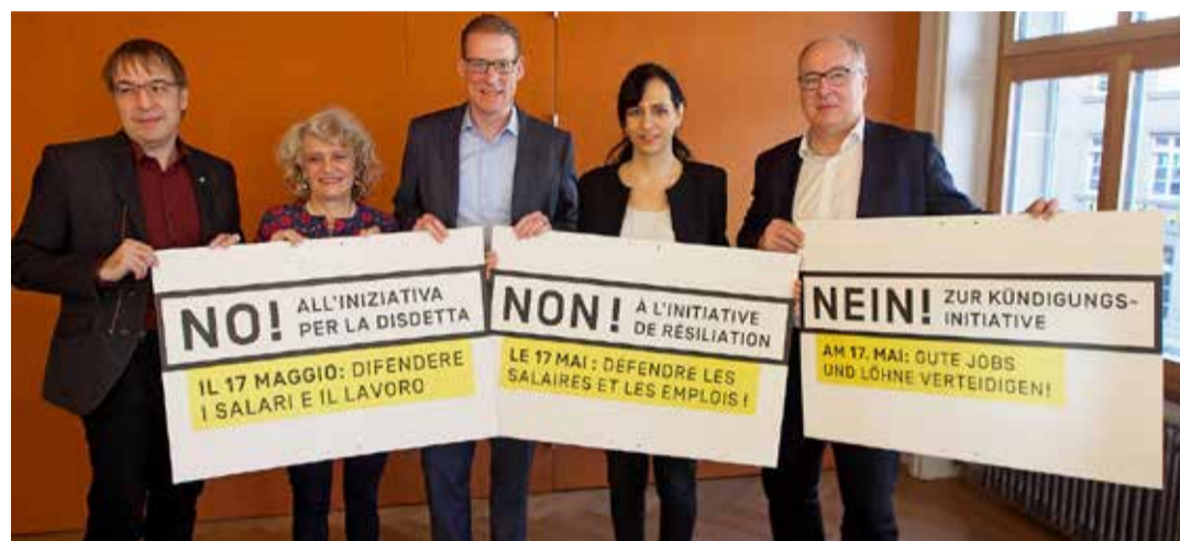
Pružimo otpor inicijativi koja ugrožava prava radnika

28. marta 2020. održaće se sljedeća veliko okupljanje kako bi se pokrenula zajednička kampanja. Pozvani su predstavnici udruženja migranata i svi solidarni ljudi. Pored podijum diskusije planirani su i konkretni predlozi za reagovanje. Želimo da samouvjereno nastupimo protiv uništavanja svih naših prava! Ne dozvolimo da SVP koristi nas migrantkinje i migrante za sprovođenje svoje antisocijalne i rasističke politike i da dijeli društvo.