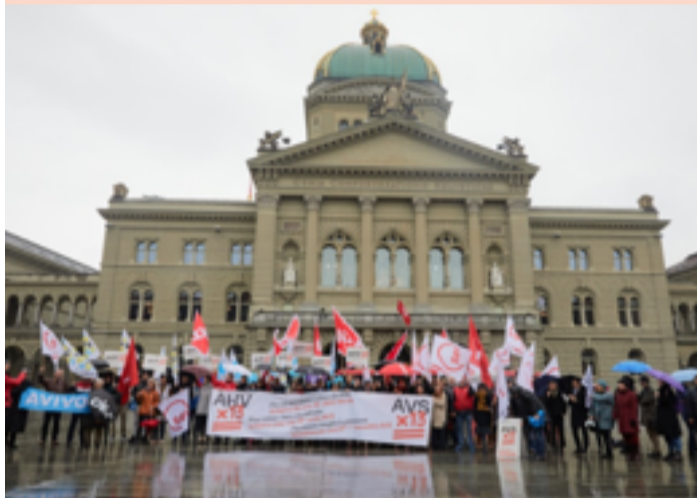
Podrži inicijativu za bolji život u starosti

Iza Inicijative za 13. AHV penziju stoji veliki komitet. Zajedno želimo da ojačamo AHV i obezbedimo bolji život u starosti. Podrži i ti ovu inicijativu i sakupi potpise. Dalje informacije nalaze se na: www.AHVx13.ch .