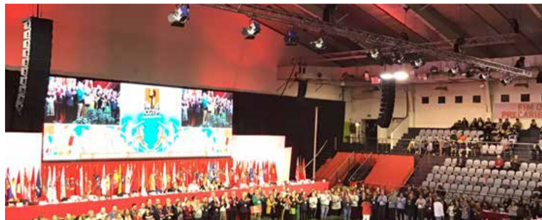
Štrajk za bolju ekološku Švajcarsku – nužna ekosocijalna reorganizacija

Zahvaljujući klimatskoj omladini globalno zagrijavanje drastično se popelo na političkom dnevnom redu i ovu šansu treba iskoristiti. Unija zbog toga podržava sljedeću veliku akciju klimatske omladine u Švajcarskoj, Strike for Future koji će se održati 15. maja. Ovo je jednoglasno odlučeno na skupštini delegata 7. decembra. Strike for Future je decentralizovan dan akcije, pa Unija u skladu s tim poziva na akciju u mnogim regionima, bilo u preduzećima ili na gradilištima ili u javnosti. Zbog toga se proteklih mjeseci razvila saradnja između Unije i lokalnih klimatskih grupa.