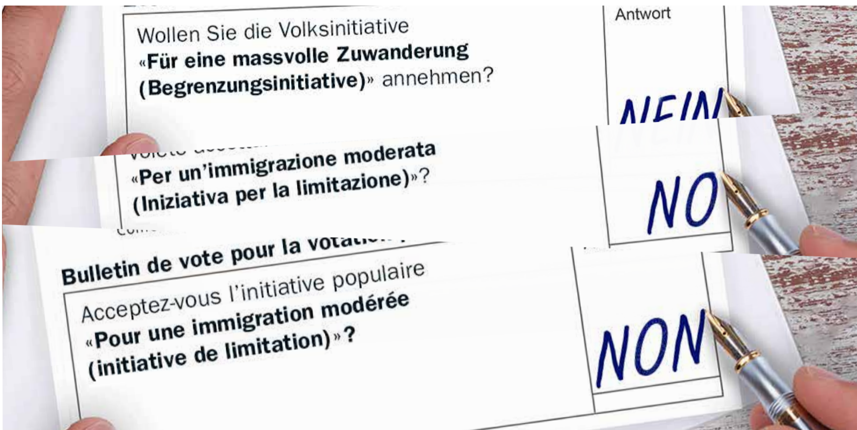
Pružimo otpor inicijativi koja ugrožava prava radnika i plate radnika

Postoji mnogo razloga protiv SVP-ove Inicijative za ograničenje stranaca (KI). Ona dovodi u pitanje prava migrantkinja i migranata, diskriminišuća je, podstiče predrasude protiv migrantkinja i migranata, okreće mnogobrojne grupe jedne protiv drugih. Švajcarsku bi stavila u izolaciju i prouzrokovala pravni haos. Ali prije svega napala bi prava radnika. Inicijativu odbijaju mnogobrojne ličnosti najrazličitijih političkih stavova. Ali ne zavaravajmo se: i za Inicijativu o masovnoj imigraciji se činilo da nailazi na slično odbijanje, pa je uprkos tome usvojena. Zbog toga je važno boriti se za većinu protiv ovo inicijative sve do samog kraja.