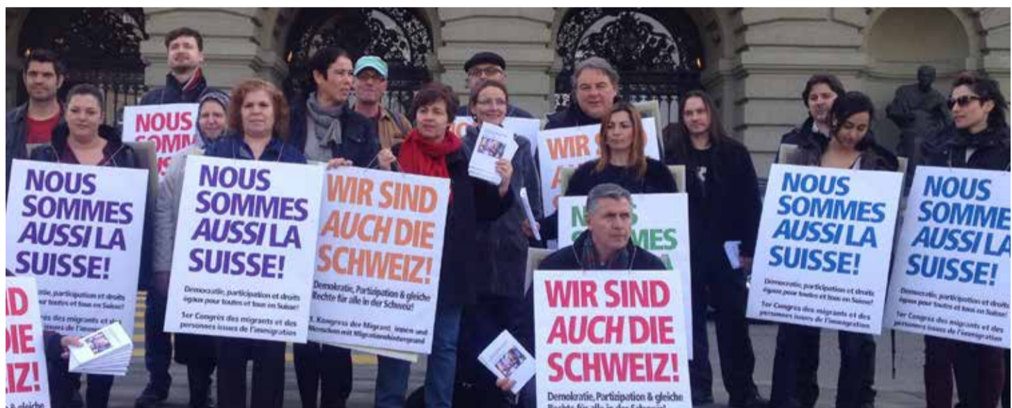
Pamje nga aksioni i sindikalistëve të Unia në kuadër të fushatës «Edhe ne të gjithë jemi Zvicra!».

Për të mënjeluar vuajtjen njerëzore, nevojiten zgjidhje pragmatike. Kush nuk mund të përfitojë nga puna me kohë të shkurtuar, sigurimi i papunësisë dhe rregullorja e kompensimit të të ardhurave, mbetet pa para. Andaj, Unia kërkon nga Qeveria Federale një fond kalimtar përballimi, për të mbështetur njerëzit, të cilët edhe në kushte të vështira e të pasigurta kontribuojnë për ekonominë e Zvicrës dhe të cilët tani mbeten të anashkaluar.