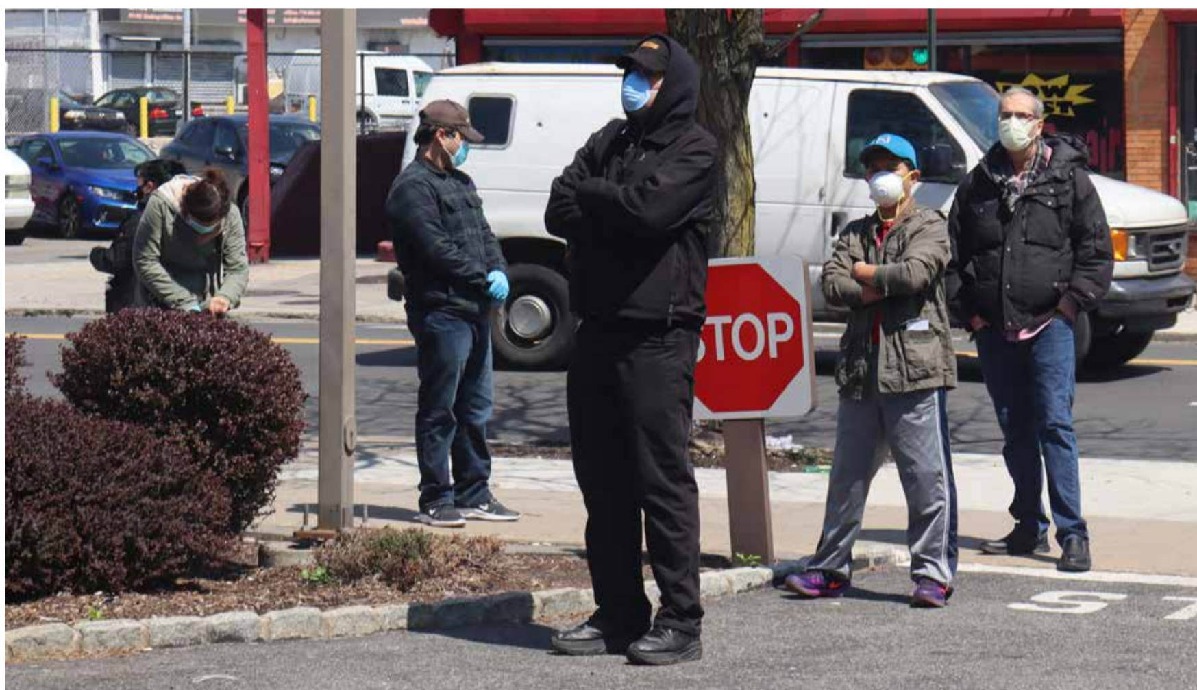
Migrantet/ët në Zvicër me punën e tyre kontribuojnë për funksionimin e shumë shërbimeve shoqërore dhe për vendin

Me rastin e krizës së koronës shumë punëmarrës humbin të ardhurat e tyre deri diku të sigurta. Shumë të huaja dhe të huaj punojnë në sektorët dhe degët me paga të ulëta. Për të mbyllur zbrazëtite buxhetore, ata janë të detyruar të marrin ndihmë sociale. Kjo bien rrezik për sigurinë e lejes së qëndrimit.