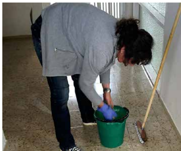
Nevojitet ndihmë e menjëhershme për punëmarrësit