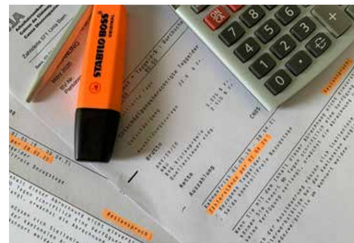
Ndryshimet e të drejtës së përfitimit gjatë pandemisë

Detyrimi, për të kërkuar një vend pune, nuk ndryshon në parim edhe gjatë krizës së koronës, megjithatë Entet regjionale ndërmjetësuese janë inkurajuar të bëjnë këtë, gjatë bisedës për ri inkuadrim dhe strategji aplikimi, duke u përshtatur në situatën e vështirësuar. Për dëshminë e përpjekjeve për të gjetur punë, të cilat zakonisht duhet dorëzuar deri me datën 5 të muajit, është hequr dorë deri në shfuqizimin e Urdhëresës që Qeverisë Federale mbi Covid-19. Dëshmia duhet dorëzua përsëri një muaj pas përfundimit të Urdhëresës në fjalë.