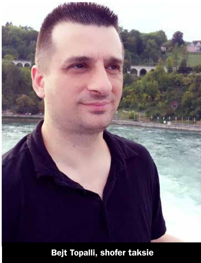
Bejt Topalli, shofer taksie

Ky rast tregon se migrantet/ët, qofshin ata/o punëmarrës/e apo punëdhënës/e me rastin e krizës së koronës janë tejet të sfiduar dhe të disfavourizuar.