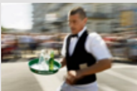
MBROJTJA: Pacientët e rrezikuar nga korona nuk duhet të punojnë në shërbim kamerieri, mirëpo marrin pagën e plotë.