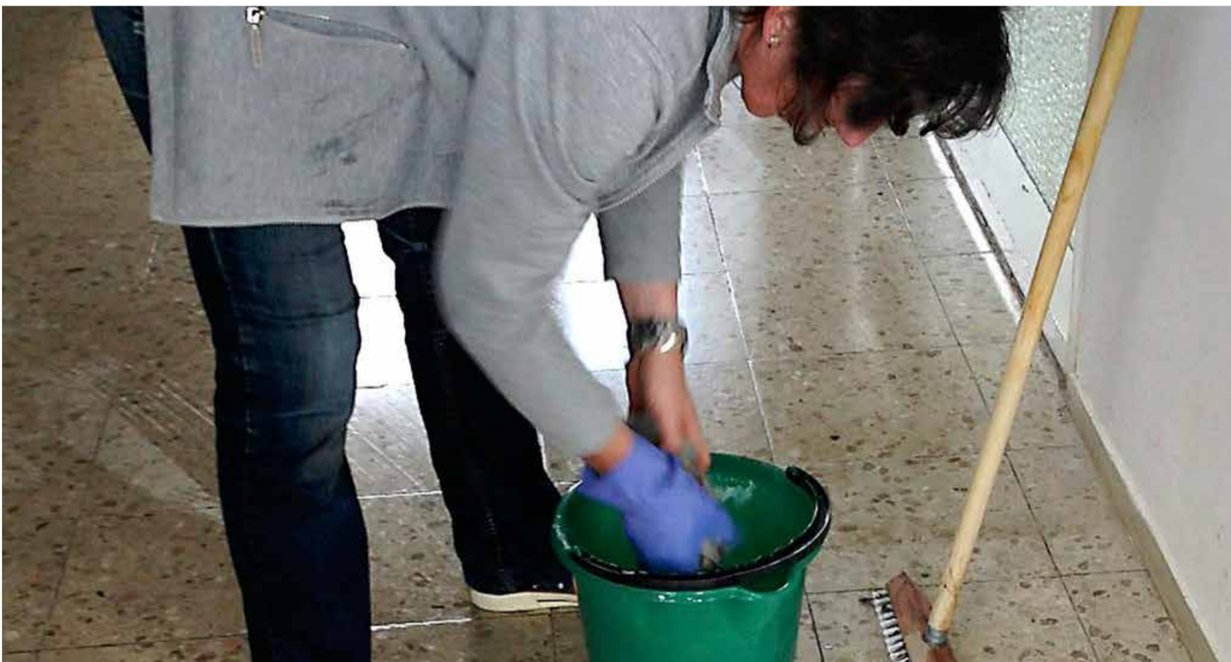
Të punësuarit me kushte të këqija dhe të pasigurta nuk duhet të anashkalohej nga masat mbështetëse.

Unia dhe 22 organizata mbështetëse i bëjnë thirrje qeverisë federale dhe kantoneve të sigurojnë fondet e nevojshme për një fond tejkaluës të Covid-19. Ky fond ka për qëllim të sigurojë mbrojtje sociale dhe ekonomike për grupet e njerëzve, të cilët deri tash janë përjashtuar nga masat aktuale mbështetëse.