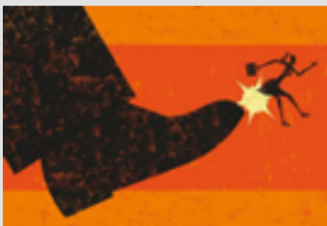
SHKARKIMI: Firma edhe në rast sëmundjeje ti përmbahet afateve të shkarkimit.

Firma ime më ka shkarkuar në mënyrë të rregullt. Pak kohë pas kësaj unë jam sëmurë për 5 ditë. Afati i shkarkimit përbënë një muaj. A është problematike, nëse unë menjëherë pas shërimit të suksesshëm lajmërohem si i papunë?