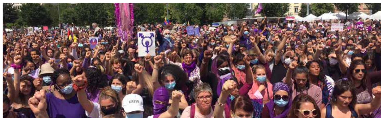
Sindikatat gjate «javes violete» që filloi me 8 qershor, mobilizoi gratë që nga Neunburg-u deri në Bellinzona