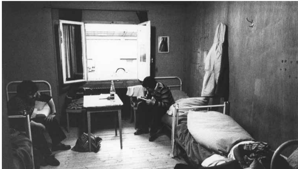
Një status i ri i sezonierëve për të huajt? Kushte të pasigurta të jetesës dhe të punës për të gjithë? Ne themi qartë «Jo» më 27 shtator!

Tempi pasati, gjithashtu? Mjerisht jo! Edhe sot ndërmarrjet në rend të parë janë të interesuara për fuqi punëtore të lirë dhe fleksibile. Dumpingu në paga, kushte të këqija e të pasigurta të punës, diskriminimi dhe papunësia janë pasojat. Dhe sikur atëherë provon të përfitojë një parti ksenofobe.