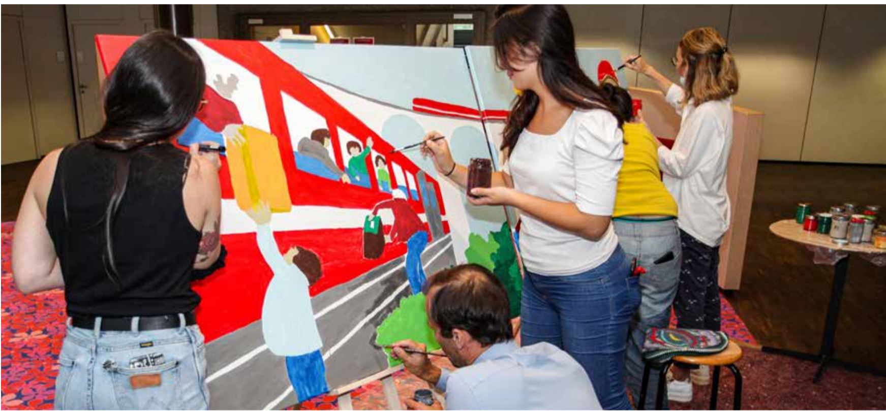
Ana kreative dhe artistike e takimit me përfaqësues të shoqatave të mobilizuara të migrantëve

Në lokalet e Sindikatës Unia në Bernë, të shtunën e 29 gushtit 2020 është mbajtur takimi me parullën «Solidaritet në vend të përkufizimit» që ka të bëjë me votimin kundër iniciativës kontroverze të Partisë SVP/UDC, që është e njohur edhe si «iniciativa e pezullimit të marrëveshjes për qarkullimin e lirë të personave». Në këtë takim ishin të pranishëm rreth 50 përfaqësues dhe përfaqësues të shoqatave të ndryshme të migrantëve në Zvicër, aktivistë të Sindikatës Unia, të sindikatave dhe partive të ndryshme progresive.