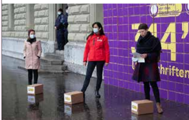
Sindikatat zvicerane dorëzojnë shkresën me 314 000 nënshkrime

Mbi 314 000 njerëz tashmë kanë nënshkruar me sukses apelin e Bashkimit të Sindikatave të Zvicrës (SGB/USS) dhe Unia kundër rritjes së moshës së pensionit për gratë. Parlamenti duhet ta marrë seriozisht këtë shenjë me peshë. Reforma e AHV në kurriz të grave nuk do të ketë asnjë shans.