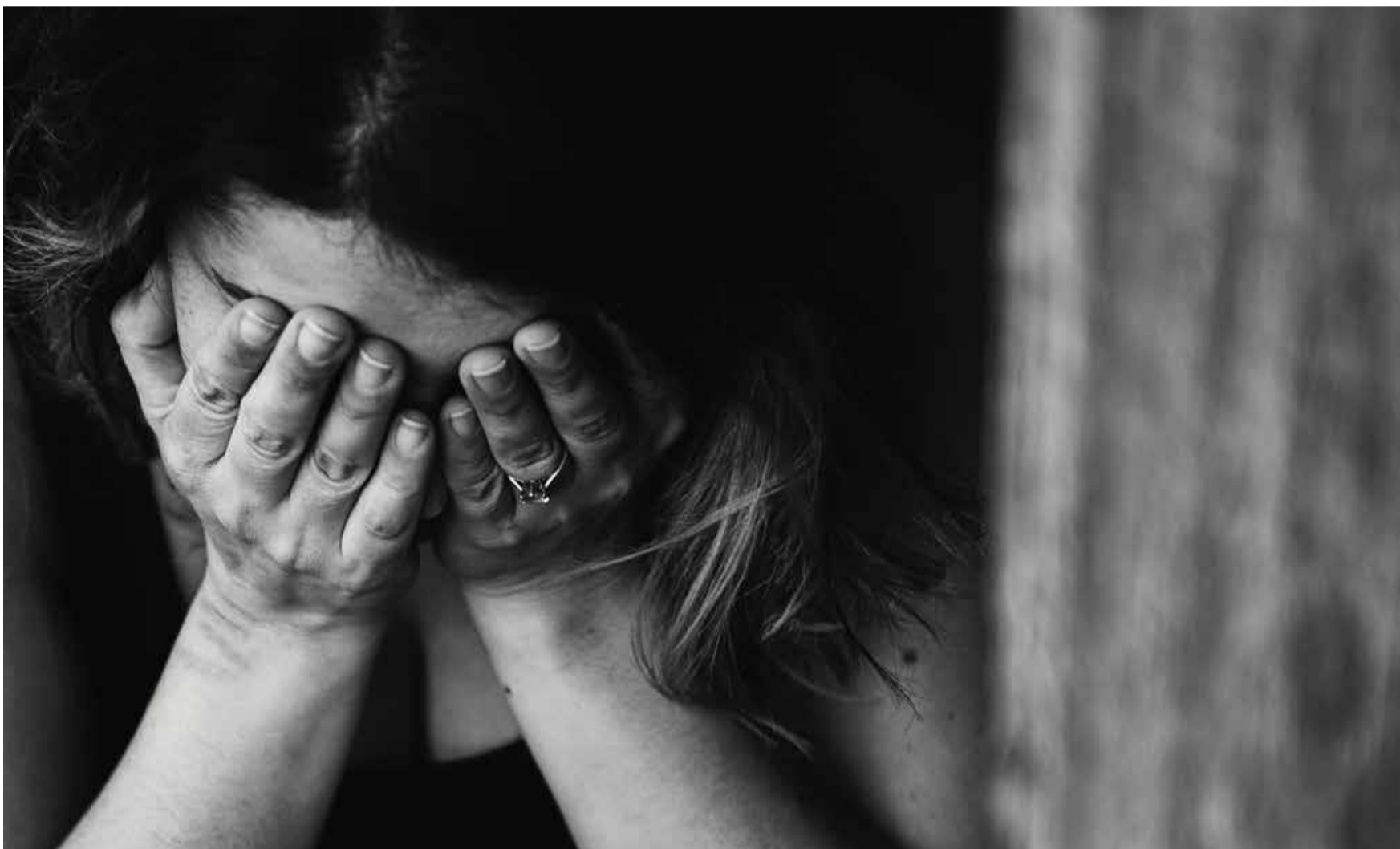
Kriza e koronës ka prekur të gjithë popullatën, por në mënyrë të veçantë dhe rëndë punëmarrëset migrant* e

Pandemie prek fort mbi mesataren njerëzit me paga të ulëta, në marrëdhënie të këqija pune dhe me status të parregulluar apo të munguar të qëndrimit. Me mijëra thirrje dhe kërkesa për mbështetje të anëtarëve në situatë emergjente që një vit janë një dehi e qartë për ketë.