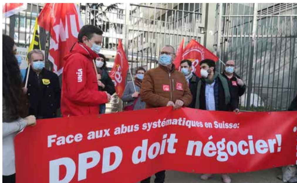
Pamje nga aksioni protestues i shofer*eve të DPD të mbështetur nga Unia

DPD pretendon se të dhënat e dorëzimit nga skaneri nuk u caktohen individualisht shoferëve, kështu që nuk mund të përcaktohet koha e punës. Kjo është gabim që mund të dëshmohet.