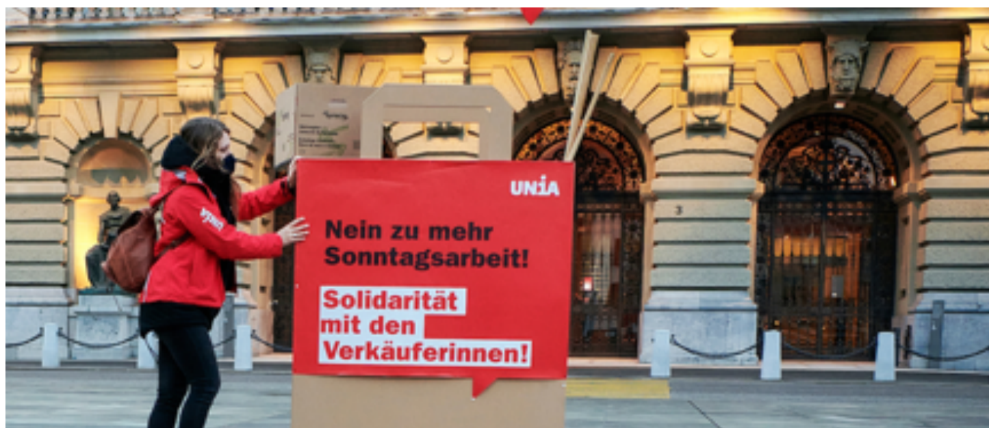
Pamje nga aksioni solidarizues me shitës*et e kundër rritjes së punës të dielave

Qysh në fundjavën votuese janë refuzuar qartazi parashtrës për zgjatjen e orarit të punës së shitoreve apo rritjen e të dielave blerëse.