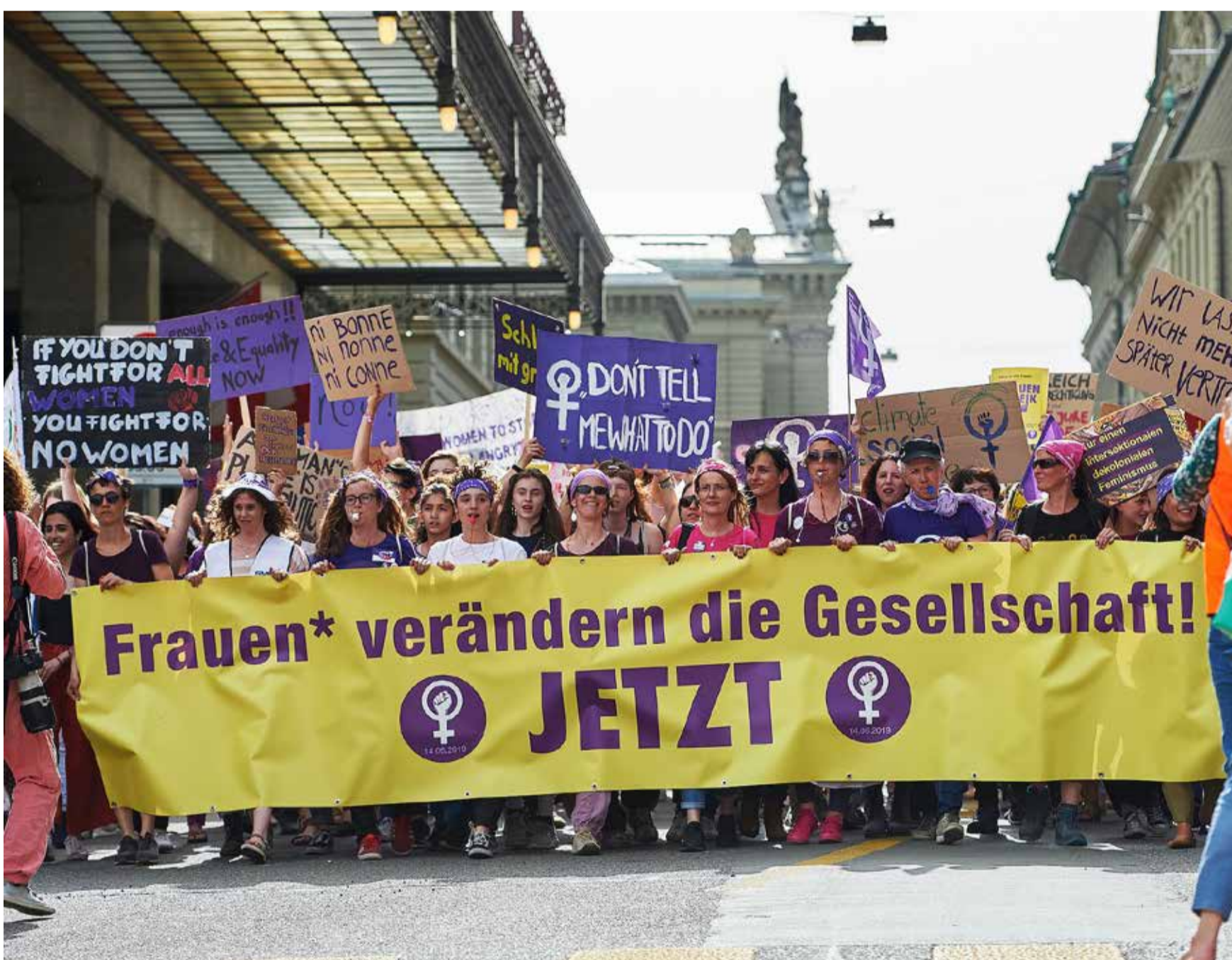
Ova kriza pogađa sve al oni sa niskim primanjima su višestruko pogođeni

Black Lives Matter, štrajk žena, klimatski štrajk. Snažni pokreti za socijalnu pravdu formiraju se pred našim očima. Šta to znači za sindikate: Ove socijalne borbe nas ne razdvajaju, mi smo dio njih.