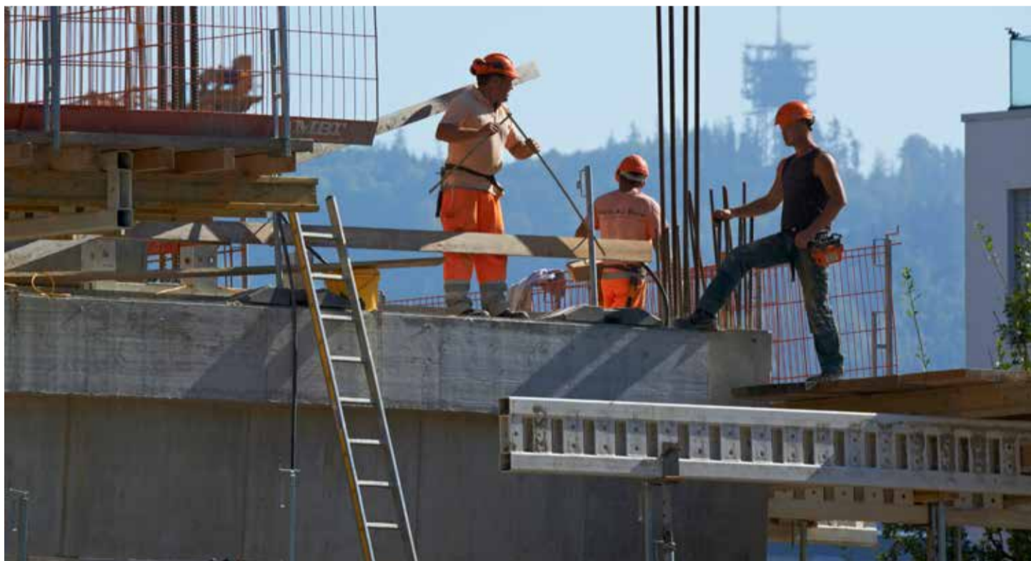
Građevinskim radnicima se ništa ne poklanja i zaslužuju bolje uslove rada

Da li i ti radiš u oblasti građevine? Onda možeš da glasaš ovdje: www.unia.ch/lmv2022 Svaki glas je važan! (na italijanskom: www.unia.ch/cnm2022 )