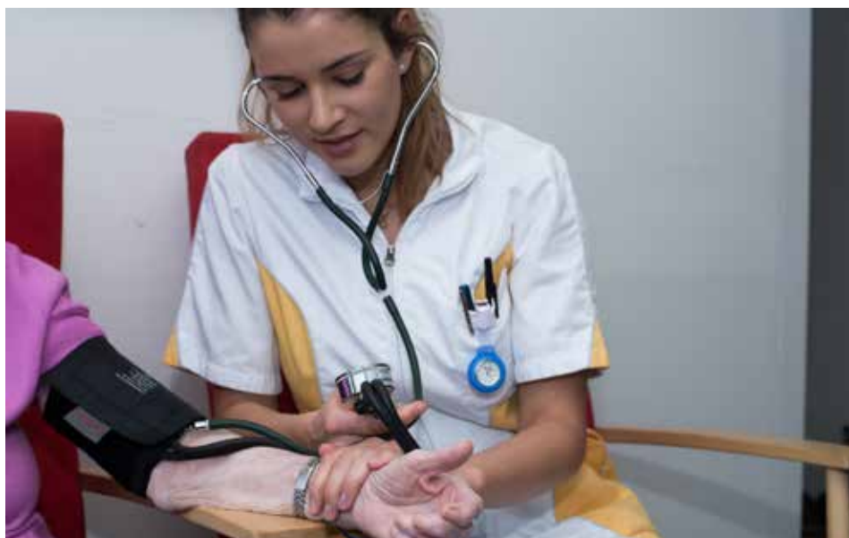
Zdravstveni radnici zaslužuju bolje uslove rada