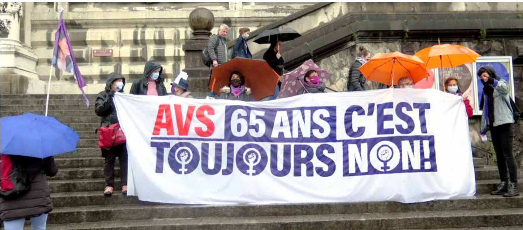
Përpjekja për të të përkeqësuar pensionin e shtyllës së parë kryesore të sigurimeve shoqërore AHV/AVS do të has në kundërshti

Gratë edhe më tej marrin rreth një të tretat (1/3) më pak pension se sa burrat. Megjithatë parlamenti donë të ngritë moshën e pensionit për gratë në 65 vjet. Kështu gratë duhet të paguajnë reformën e AHV/AVS. Rritja e moshës së pensionimit për gratë do të thotë se ato duhet të punojnë më gjatë dhe të marrin pension më të ulët. Kjo është e papranueshme! Një reforme të AHV/AVS në kurriz të grave e kundërshtojnë sindikatat bashkë me organizatat feministe përmes një demonstrata kombëtare me 18 shtator 2021 në Bernë.