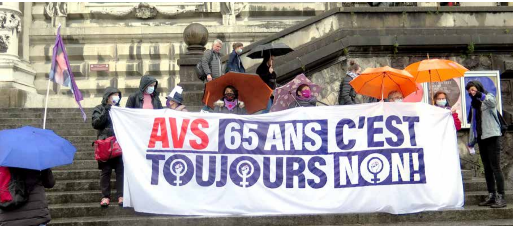
¡No a una reforma del seguro de AHV/AVS a costa de las mujeres! ¡No a un aumento de la edad de jubilación de las mujeres!

Las mujeres siguen recibiendo un tercio menos de pensión que los hombres. A pesar de ello, el Parlamento quiere elevar la edad de jubilación de las mujeres a los 65 años. De esta manera, son ellas las que tienen que cargar con la reforma del seguro de AHV/AVS. Aumentar la edad de jubilación de las mujeres significaría que tendrían que trabajar más tiempo y recibir menos pensión. ¡Esto es inaceptable! Los sindicatos, junto con las organizaciones feministas, se oponen a una reforma del seguro de AHV/AVS a costa de las mujeres. Para protestar frente a ello, han convocado una manifestación nacional para el próximo 18 de septiembre en Berna.