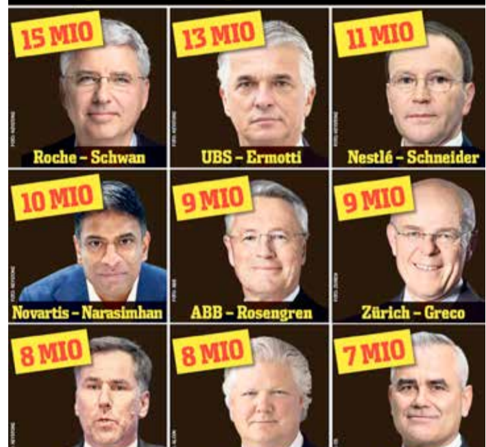
LISTA DE GANANCIAS: A pesar del coronavirus, estos hombres han ganado sumas exorbitantes en 2020. (Montaje: work)

salariales del Estado a causa de la pandemia en 2020, pero siguieron repartiendo sin reparos millones de francos en dividendos.