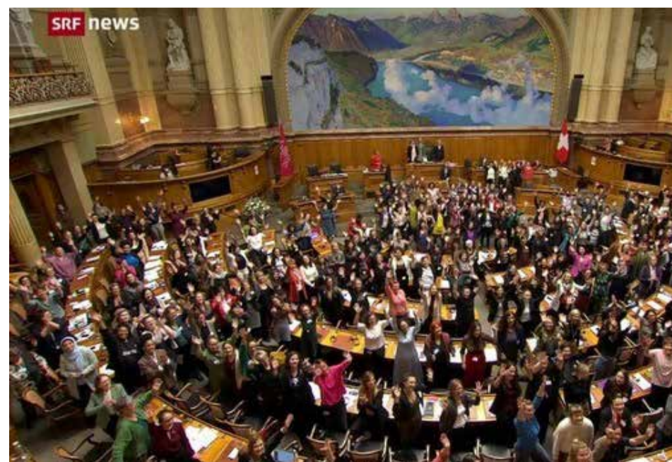
Pamje e njërit nga sisionet e grave në Parlamentin Federal të Zvicrës

Në fund të sesionit janë aprovuar 22 peticione për parlamentin nacional. Parlamentar*et, të cilat kanë marrë pjesë në sesionin e grave do ti ndjekin më tej zhvillimet rreth peticioneve në parlament. Ne pjesëmarrës*et do të jemi vigjilent edhe më tej për kërkesat tona.