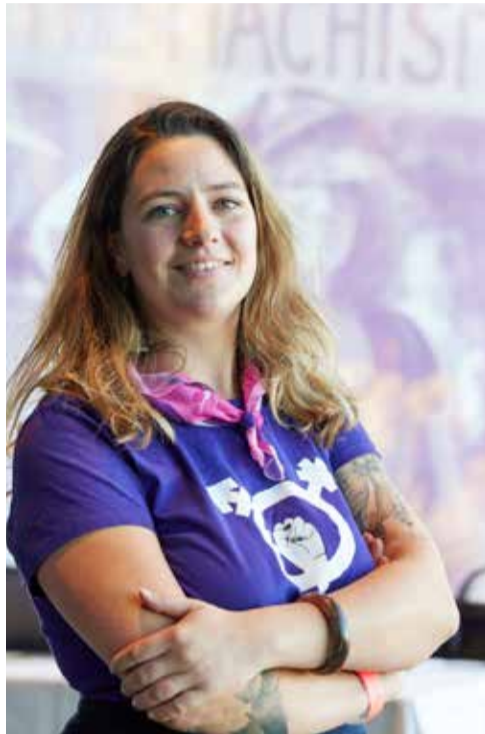
Kongresi i grave të SGB/USS u zhvillua me 12 e 13 nëntor 2021 në Gurten

Shumë kërkesa dhe shumë punë para nesh. Mirëpo, para së gjithash kongresi ishte një shenjë e fuqishme e angazhimit feminist e sindikalistë dhe solidaritet!