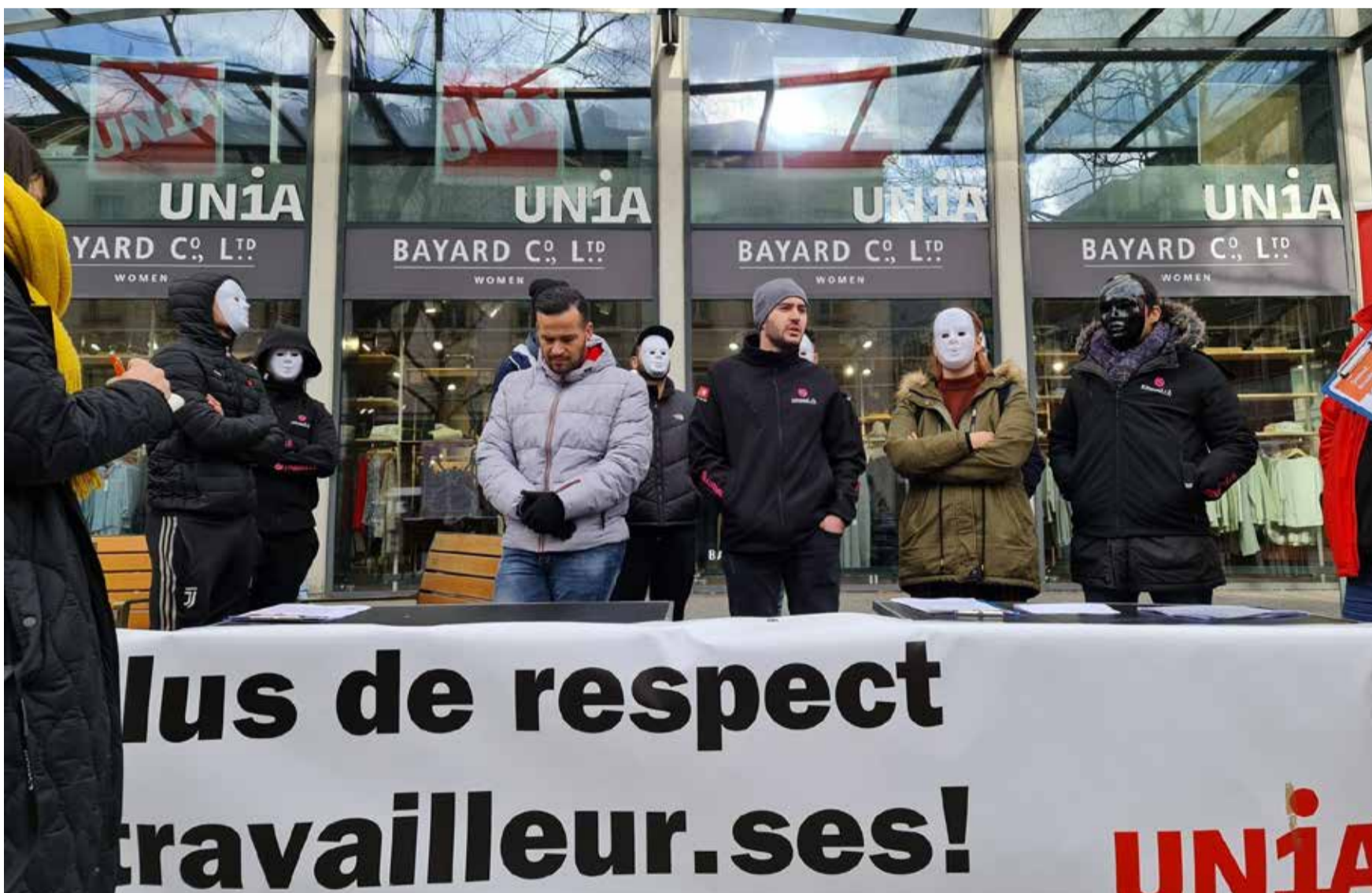
Pamje nga greva aktuale e kurir:eve të Smood në njërin nga qytetet e Zvicrës

Që nga 2 nëntori janë në grevë kurir*et e shërbimit të dërgesave Smood – në ndërkohë në 11 qytete të Zvicrës perëndimore. Ata kërkojnë që të marri fund shfrytëzimi dhe kushte korrekte të punës. Mbështetja publike është e madhe: Një delegacion i grevist*eve me 23 nëntor i kanë dorëzuar Smood-it një peticion, i cili është nënshkruar nga 12 247 persona. Smood duhet menjëherë të filloi të bisedoi me të punësuarit dhe sindikatat Unia e Syndicom.