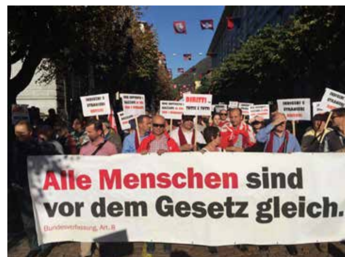
Pamje nga një manifestim i grupit të itneresit për migacion të Unia në Belinzona: Të gjithë njerëzit janë të njëjtë para ligjit (Neni 8 i Kushtetutës)