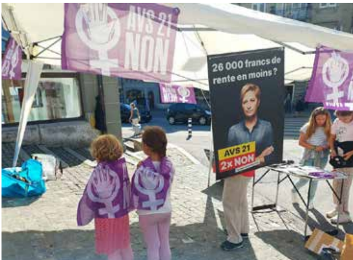
Göçmenlerin kendilerini ifade edebilmeleri için «İşyerinde Demokrasi» etkinliği

Unia Ticino ve Moesa, 22-27 Ağustos 2022 tarihleri arasında, AHV 21'e karşı ulusal eylem haftasının bir parçası olarak çalışanlarla birlikte bir girişimde bulundu. Bu önemli konuda göçmen-