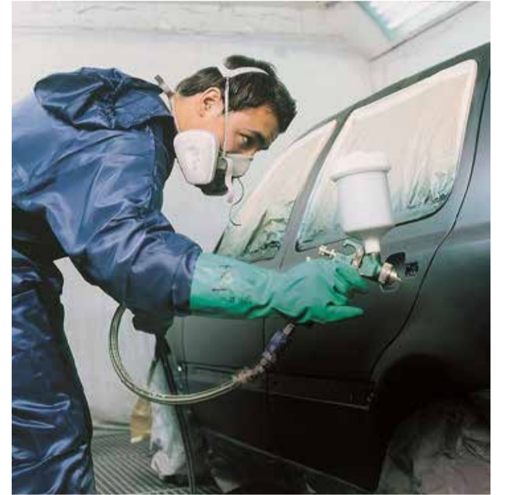
Kaporta sanayinde 4000'in frankın altında ücret ödenmeyecek