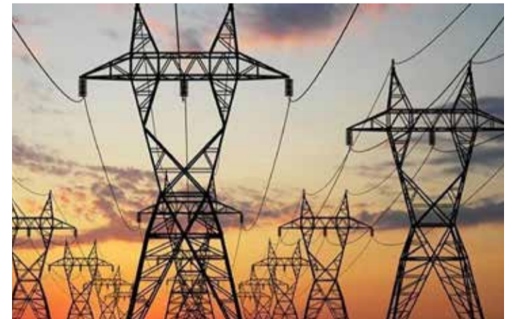
Elektrik fiyatlarına zam, özel haneler en az yüzde 39 daha fazla ödeme yapmak zorundalar.

Zürih halkı şaştan çok mantığa sahip. Son on yılda 11 kez Graubünden hidroelektrik yatırımı için, oy kullandılar. Bu nedenle kırmızı Zürih'in elektrik fiyatlarını artırması gerekmiyor. Hidroelektrik ve nükleer santral sahipleri, bizi dolandıran petrol şirketlerinden bile daha fazla kâr ediyorlar. Şaşırtıcı bir şekilde, İsviçre'de hiç kimse fiyat denetçisi için fazladan bir kâr vergisi veya daha fazla yetki talep etmiyor.