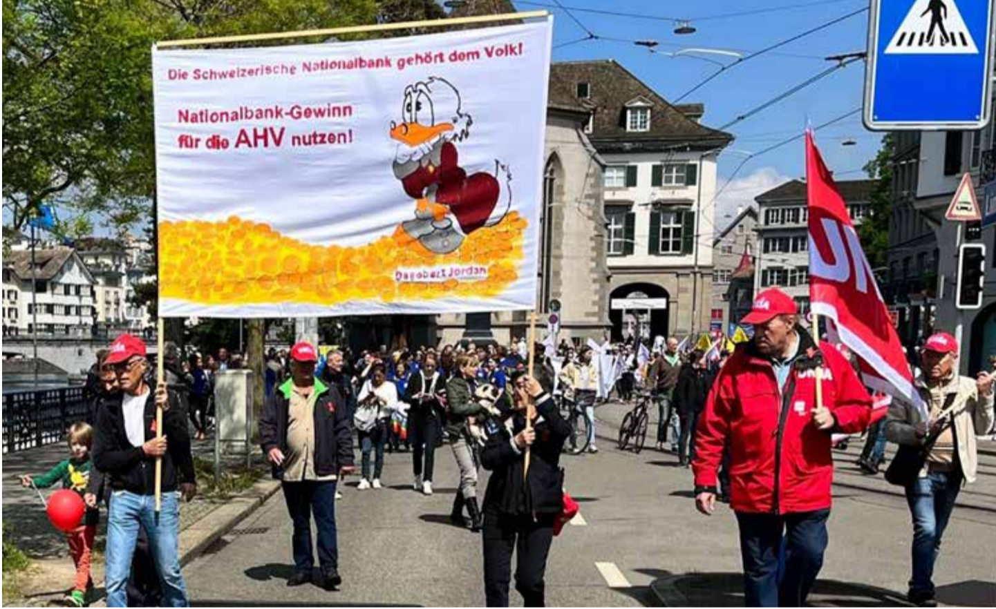
Unia yaşlı hakları için mücadele ediyor: yoksullukla; yeterli emekli maaşı; yeterli sağlık hizmeti; sağlıklı barınma; yaşama tam katılım

Manifestoyu burda okuyabilirsiniz: Ferpa's Manifesto – Ferpa