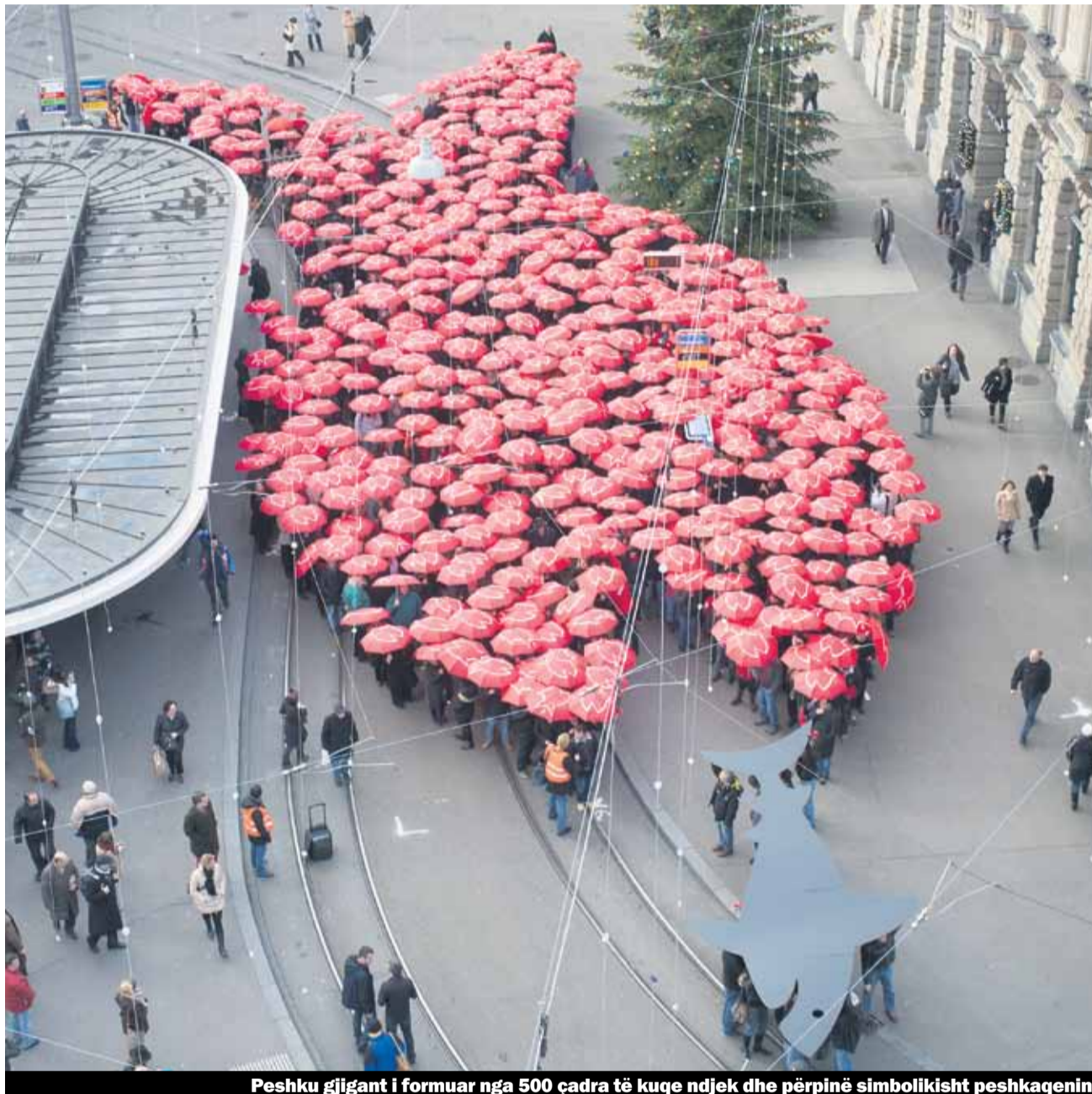
Peshku gjigant i formuar nga 500 çadra të kuqe ndjek dhe përpinë simbolikisht peshkaqenin

Në fjalën e tij përshëndetëse drejtuar Kongresit ministri i qeverisë zvicerane Alain Berset iu falënderua sindikalistëve për punën e tyre të rëndësishme për demokracinë. Ai ndanë me ta qëllimet e përbashkëta për të garantuar sigurinë sociale. Një grup i përzier sindikalistësh aktiv para tij shprehën pakënaqësinë tyre në formë proteste, pasi që Enti Federal për Sigurimet Shoqërore kundërshton edhe më tej zbatimin e Marrëveshjes për Sigurimet Shoqërore me Kosovën edhe përkundër vendimeve të plotfuqishme gjyqësore, dhe pos kësaj u protestua kundër planeve të paralajmëruara për rritjen e moshës së pensionit në 65 vjet për gratë.