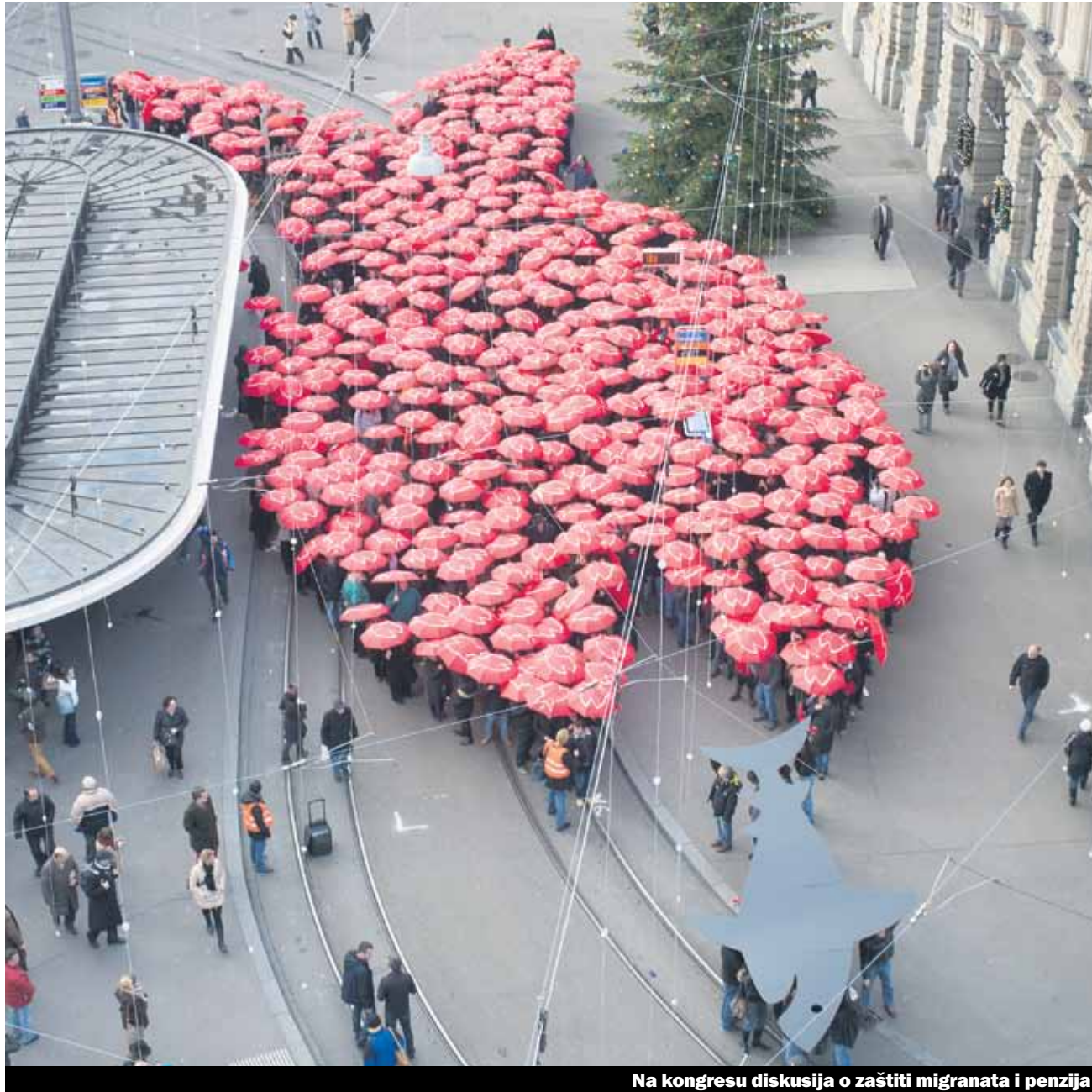
Na kongresu diskusija o zaštiti migranata i penzija

U svom obraćanju na kongresu savezni poslanik Alain Berset se zahvalio svim aktivnim sindikalcima za njihov, za demokratiju, važan rad. On je podržao i podijelio cilj sindikalaca da se garantuje socijalna sigurnost. Jedna miješana grupa od aktivista je izrazila svoje nezadovoljstvo što je savezna kancelarija odbija primjenu socijalnog sporazuma sa Kosovom, uprkos pravosnažnim sudskim presudama, i osim toga su protestovali protiv najavljenih planova da se starosna granica za penzionisanje žena podigne na 65 godina.