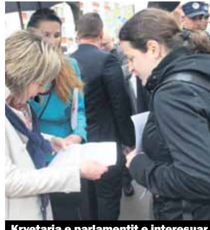
Kryetarja e parlamentit e interesuar