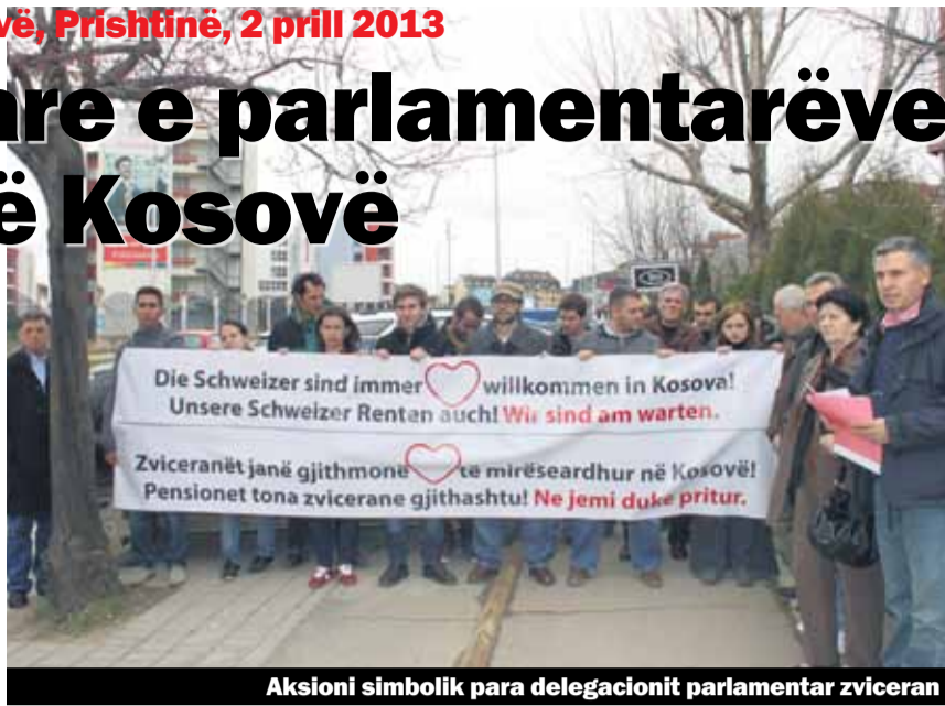
Aksioni simbolik para delegacionit parlamentar zvicëran

Një delegacion zyrtar i Parlamentit Zvicëran, kryesuar nga kryetarja e Këshillit Nacional dhe e Kuvendit Federal të Zvicrës, z. Maya Graf, po qëndron për një vizitë këtu të Kosovës zyrtare nga 1 deri më 4 prill 2013.