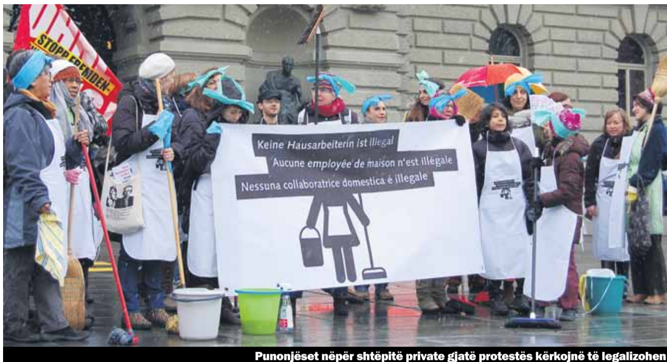
Punonjëset nëpër shtëpitë private gjatë protestës kërkojnë të legalizohen

Punonjësit shtëpiak kontribuojnë në shtimin e kualitetit jetësor të njerëzve të panumërt në Zvicër: Ato mundësojnë harmonizimin e jetës profesionale dhe asaj familjare ose angazhimin në profesione ambicioze. Pa migrantët në përgjithësi dhe pa personat pa letra në veçanti ky sektor nuk do të funksiononte. Një koalicion i gjerë i organizatave, të cilit i takon edhe Unia, nisi për këtë në mars kampanjë e cila kërkon nga qeveria që për punonjësit pa leje qëndrimi më shumë të drejta dhe rregullimin e lejes së qëndrimit.