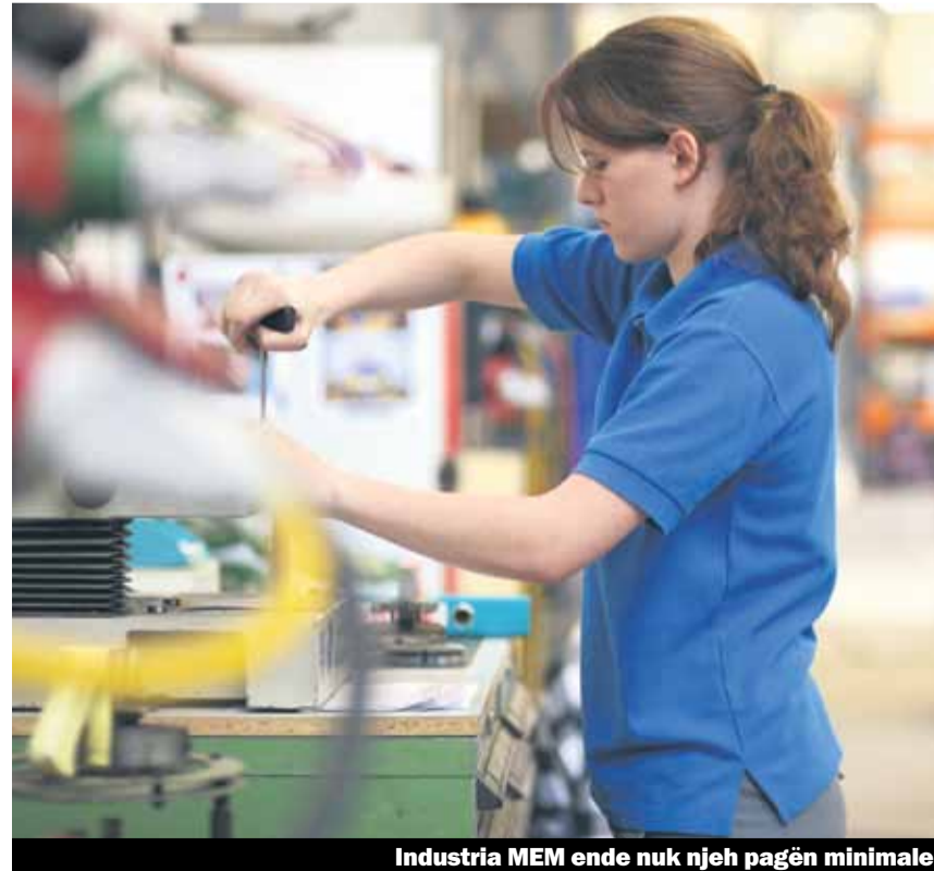
Industria MEM ende nuk njih pagën minimale

Shumice e organizatave të punëmarrësve kërkojnë shumë më pak se sa