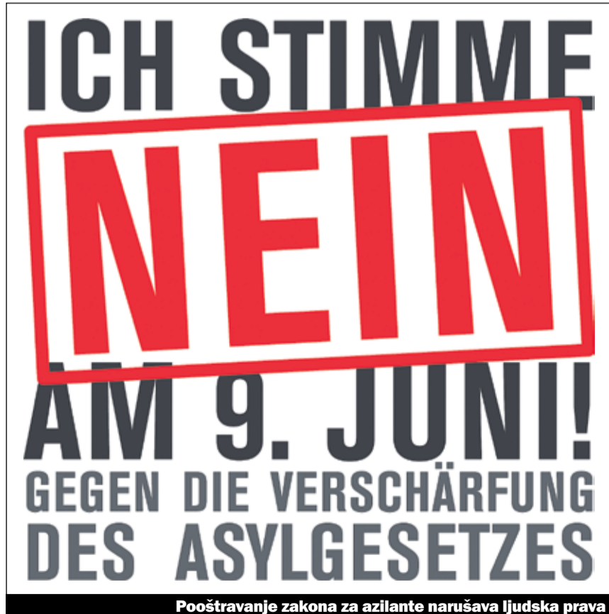
Pooštroyvanje zakona za azilante narušava ljudska prava

Posebno su značajne dvije promjene. Ukidanje postavljanja zahtjeva za azil u konzularnim predstavništvima, dakle mogućnost da se u nekom konzulatu preda zahtjev za azil. Na to su posebno primorane žene i djeca za koje je putovanje veoma rizično uzme li se u obzir da je sve više organizovanih šleper bandi – mnoge umiru tokom ovakvog putovanja. Osim toga se više ne uvažava razlog za azil ukoliko neko navede da je odbio ratovati koji nisu usaglašeni sa međunarodnom pravdom a isto tako ni po sadržaju. Mladi ljudi su često primorani da učestvuju u ratovima i u dugogodišnjim oružanim sukobima u svojoj domovini. Odbijanje učešća u ratu je često jedini način da se živi dostojanstveno ali u tom slučaju oni moraju računati da moraju napustiti zemlju jer će biti proganjani kao izdajnici.