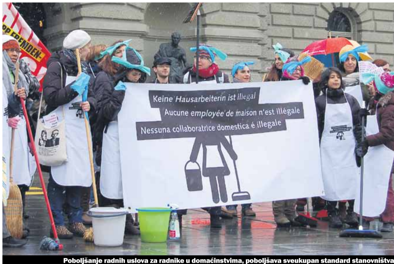
Poboljšanje radnih uslova za radnike u domaćinstvima, poboljšava sveukupan standard stanovništva

Radnici u domaćinstvima doprinose u poboljšanju kvaliteta života mnogih ljudi u Švajcarskoj: Oni omogućuju da se kombinuje porodica i posao isto tako da se posao obavlja u zahtjevnim zanimanjima. Bez migranata i uopšte bez radnika bez regulisanog statusa (bez papira) zapravo ovaj sektor ne bi mogao funkcionisati. Široka koalicija organizacija kojem pripada i Unia, krajem marta su lansirali kampanju kojom se za radnike u domaćinstvima bez regulisanog statusa boravka zahtijeva više prava i regulisan boravak.