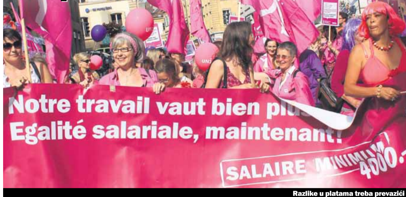
Razlike u platama treba prevazići

Kao i svake godine žene i muškarci u cijeloj Švajcarskoj obilježavaju 14. juni dan štrajka žena. Ove godine će Unia imati razne akcije u svim regionima povodom tog dana, kao npr. večer roštilja za žene «Barbeculture» sa feminističkim doprinosom u Bazelu. Jer žene su i dalje neproporcionalno pogodjene siromaštvom.