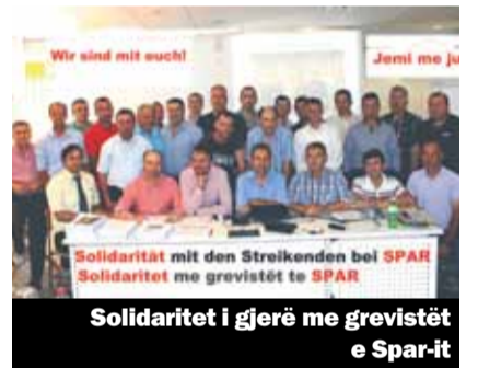
Solidaritët i gjerë me grevistët e Spar-it