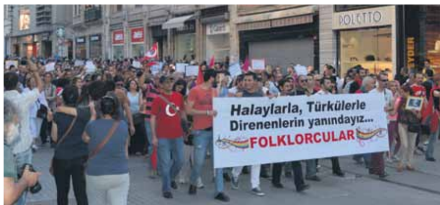
Pamje nga protestat paqësore për më shumë demokraci të qytetarëve në Turqi

Në Turqi aktualisht është formuar një lëvizje e gjerë sociale e demokratike. Shkaktar ishte rindërtimi në «Gezi-Park» – një nga parqet e pakta të mbetura në zemër të qytetit. Sipas planeve të qeverisë (AKP) edhe ky park duhet të ndryshojë në një qendër shitblerjeje dhe kompleksi ndërtesash. Për herë të parë në historinë e re të Turqisë grupe të ndryshme kanë arritur që të bashkohen në korniza të gjëra dhe jashtë kohës së zgjedhjeve të ndryshojnë gjërat.