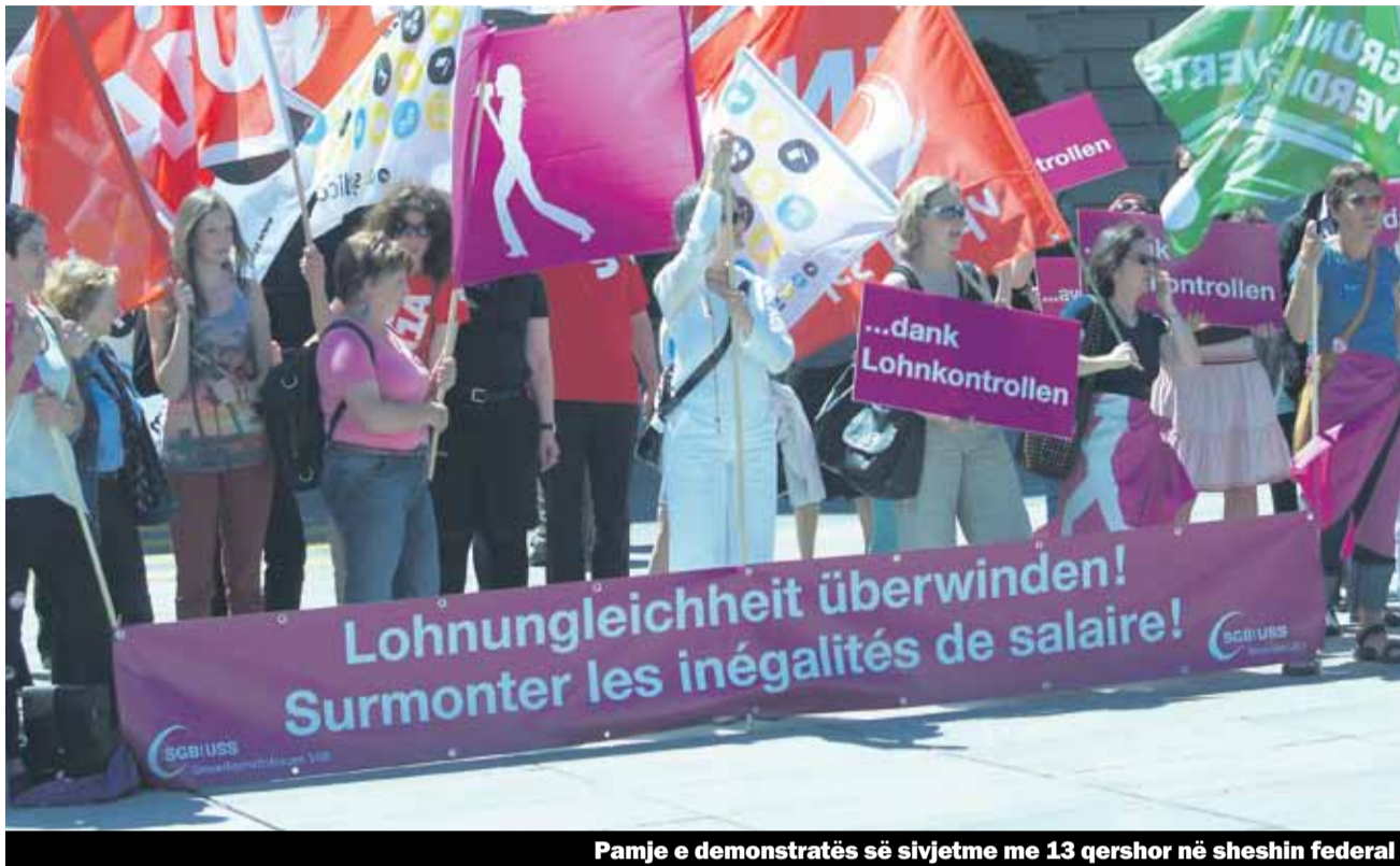
Pamje e demonstratës së sivjetme me 13 qershor në sheshin federal

Edhe njëherë gratë, me rastin e 22 vjetorit «të 14 qershorit», festuan për më shumë pagë dhe për barazi. Në vijim do tu prezantojmë një raport mbi aksionet e sivjetme të Komisionit për Gra të Unionit të Sindikatave të Zvicrës, i cili u zhvillua më 13 qershor në sheshin federal në Bernë.