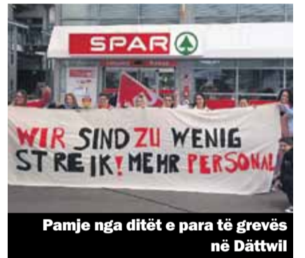
Pamje nga ditët e para të grevës në Dättwil

Në rastin e Spar greva vijon edhe më tej deri sa të gjendet një zgjidhje. Përpasororit me orë e tepërta të paligjshme të punës, vijnë edhe rrogat e këqija. Shumë tëpunësuar me arsimim të kryer profesional marrin pagë sikur të ishin të pa arsimuar. Pastaj sikur në rastin e Matro Boutique, shumica e të punësuarve kanë kontratë më së shumti 80% të punësimit, me një pagë mujore bruto prej 2880 frangave.