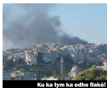
Ku ka tym ka edhe flakë!