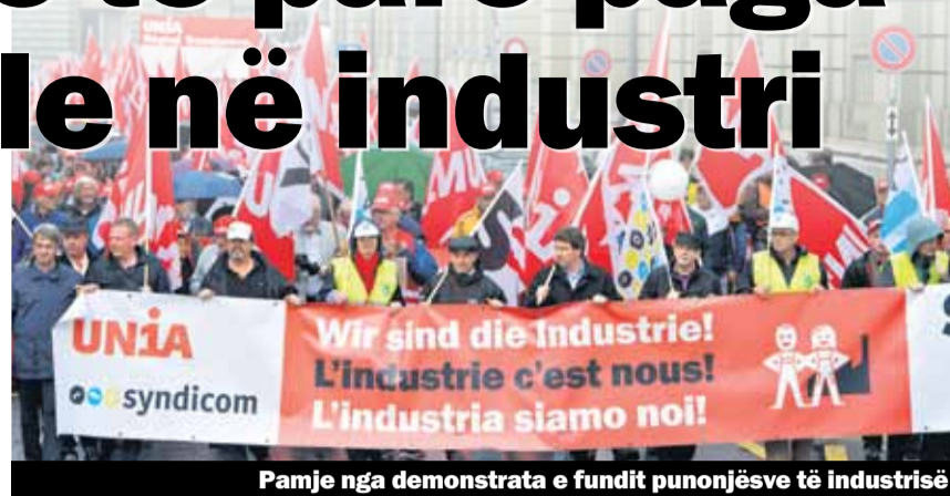
Pamje nga demonstrata e fundit punonjësve të industrisë

Në Kontratë e re të Përgjithshme të Punës për industrinë e makinave, atë elektrike dhe metalike për herë të parë përcaktohen pagat minimale. Ka 75 vite që punëmarrësit kanë bllokuar tërësisht pagat minimale me KPP. Tani u arrit ky përparim.