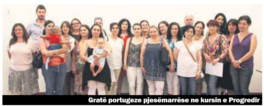
Gratë portugeze pjesëmarrëse ne kursin e Progredir

«Pilot projekti ynë është një sukses, falë angazhimit të të gjithëve, posaçërisht falë pjesëmarrësve të kursit.