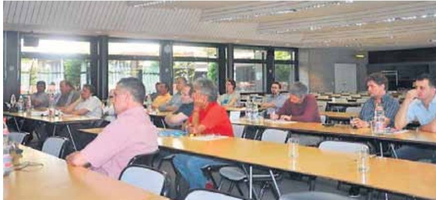
Pamje nga pjesëmarrësit e konferencës mbi situatën sociale në Kosovë

Brym e vuri Kosovën në kontekstin e politikës neoliberale në Evropë, me ç'rast ai theksoj: «Kosova ishte dhe mbetet një eksperiment neoliberal në Evropë. Kosova është vendi më i varfër i Evropës, mirëpo gjithnjë e më shumë shtete në Evropë në kuadër të krizës kapitaliste po afrohen standardeve të Kosovës. Është e nevojshme rezistenca ndërkombëtare e lëvizjes punëtore kundër KOSOVARIZIMIT të pjesëve tjera të Evropës. Gjithkund duhet të ketë rezistencë sociale».