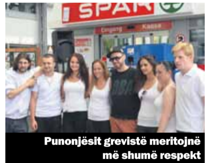
Punonjësit grevistë meritojnë më shumë respekt