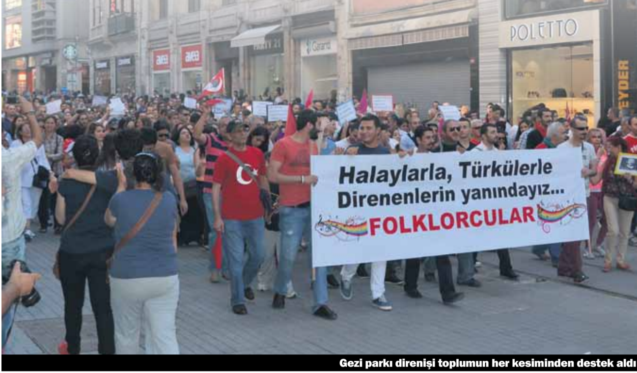
Gezi parkı direnişi toplumun her kesiminden destek aldı