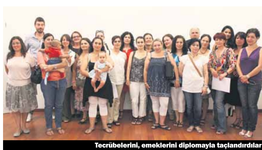
Tecrübelerini, emeklerini diplomayla taçlandırdılar