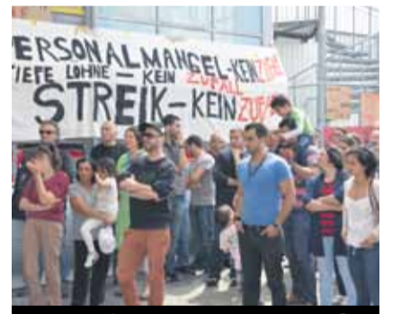
Grevle haklarını elde ettiler