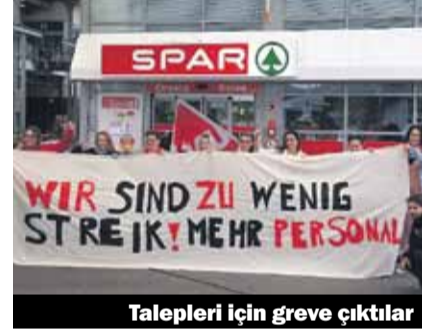
Talepleri için greve çıktılar