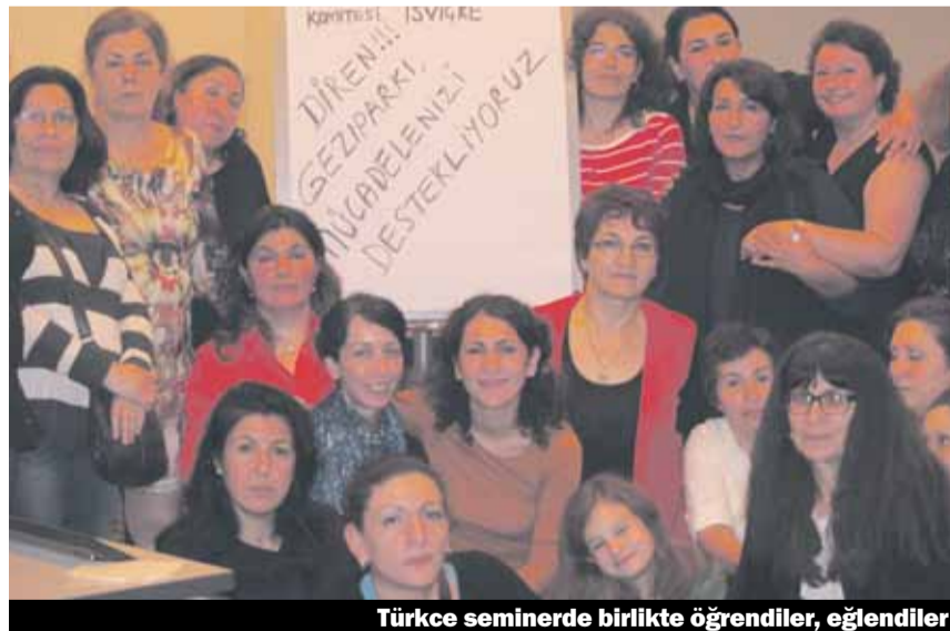
Türkçe seminerde birlikte öğrendiler, eğlendiler

İlk günün akşamında ortak alınan bir karar sonucu Türkiye'deki Gezi Parkı protestolarını destek amaçlı bir