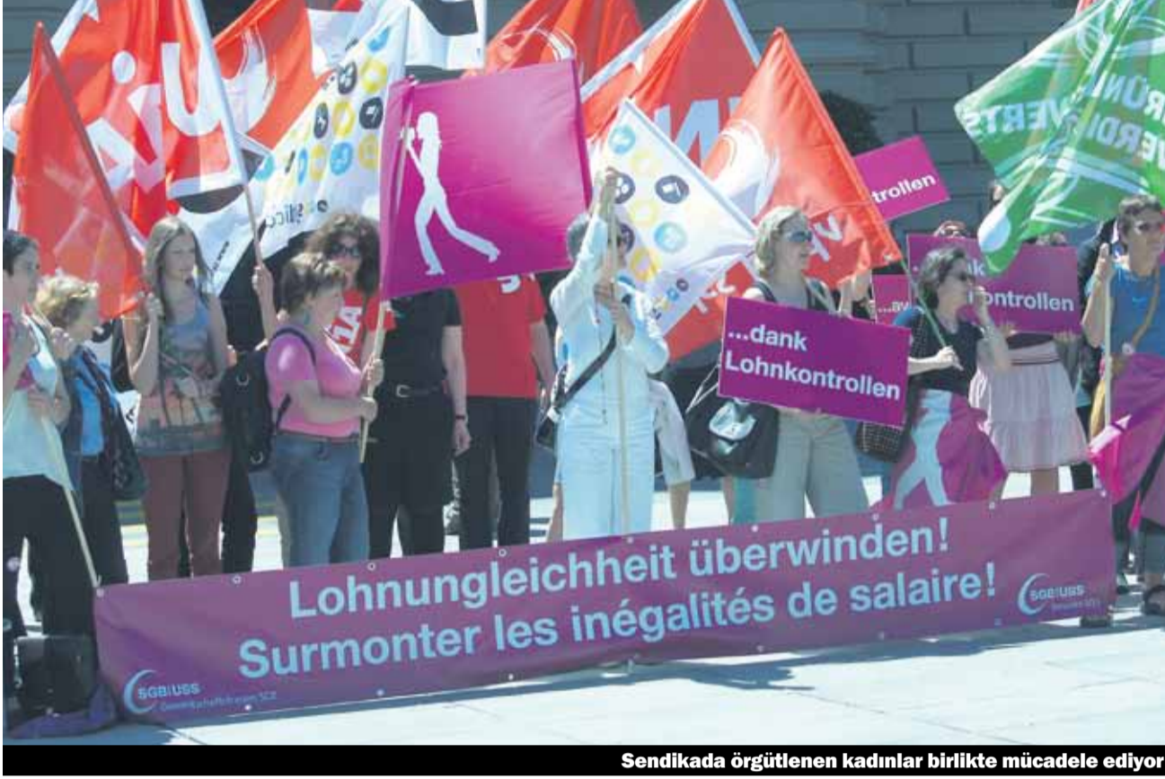
Sendikada örgütlenen kadınlar birlikte mücadele ediyor

Kadınlar her yıl olduğu gibi bu yılda 14 haziran kadın grevinin yıl dönümünde talepleri için gösteriler düzenledi. İsviçre Sendikalar Birliği Kadın Komisyonu tarafından organize edilen gösteride kadınlar eşit haklar ve daha fazla ücret talep ettiler.