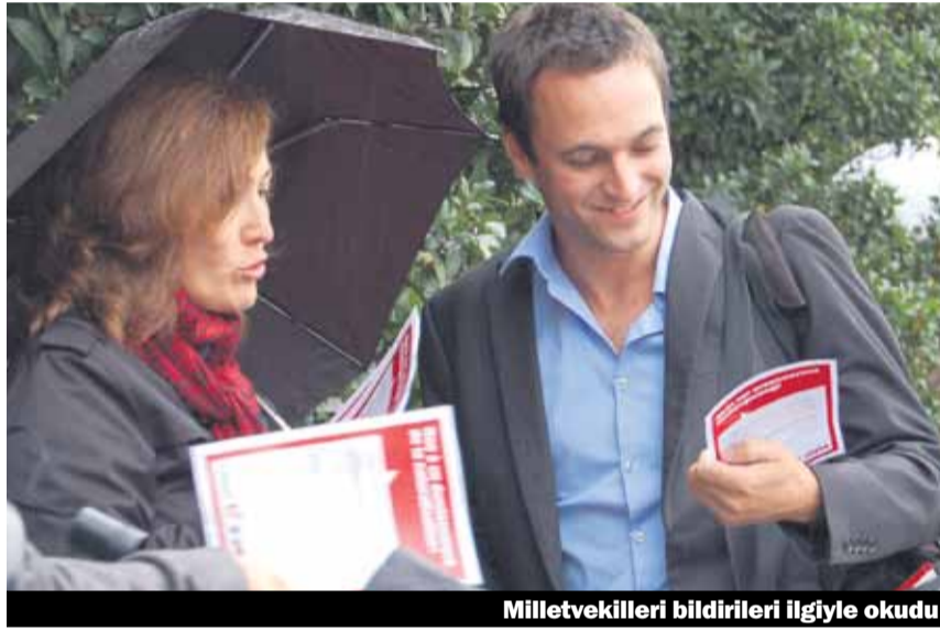
Milletvekilleri bildirileri ilgiyle okudu