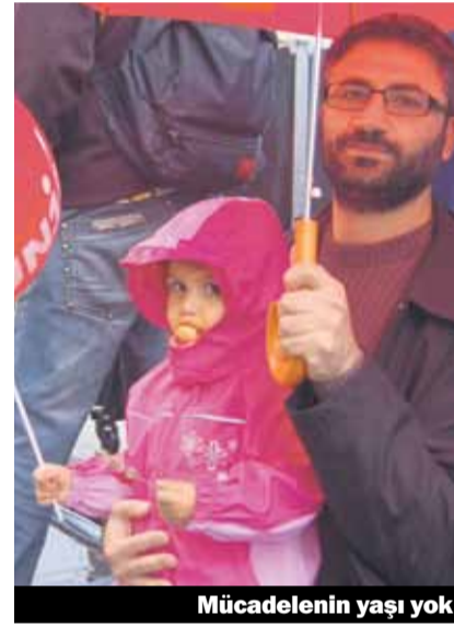
Mücadelenin yaşı yok