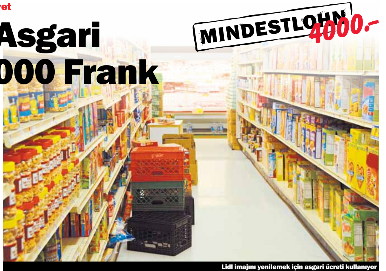
Lidl imajını yenilemek için asgari ücreti kullanıyor

Meslek eğitimi görmeyenlere 4000 Frank maaş: Bu İsviçre'de perakendecilik alanında yapılan Toplu İş Sözleşmesinde belirlenen en yüksek maaş. Lidl'e göre bu uygulama aralık ayından itibaren yürürlüğe girecek. Bu kararın kamuoyuna yansımalarının ardından, Lidl bu maaş artışı ile ilgili sürekli olarak reklam yapıyor: «Lidl'e değer-bizde çalışanlar içinde». Bu yeni haber sevindirici olmasına rağmen, haberin açıklığı kavuşturulması gereken yanlarında var: Bu uygulama sadece yüzde yüz çalışanlar için geçerli. Bilindiği gibi perakendecilik alanında çalışanların çoğunluğu part time (yarım gün), en fazla %60 çalışıyor. Buda gösteriyorki, çalışanların çok az bir kesimi asgari ücretten yararlanabiliyor.