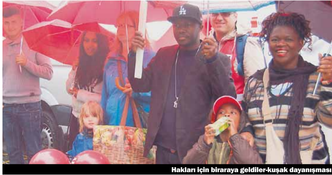
Hakları için biraraya geldiler-kuşak dayanışması

Vatandaşlık yasası tamamen revize edilmek isteniyor. Bu yıl Kantonlar Meclisi ve İsviçre Federal Parlamento'su yasa taslağını görüştü. Kantonlar Meclisi eylül ayında yaptığı görüşmede vatandaşlık yasasında bazı maddelerin sertleştirilmesini kabul etti.