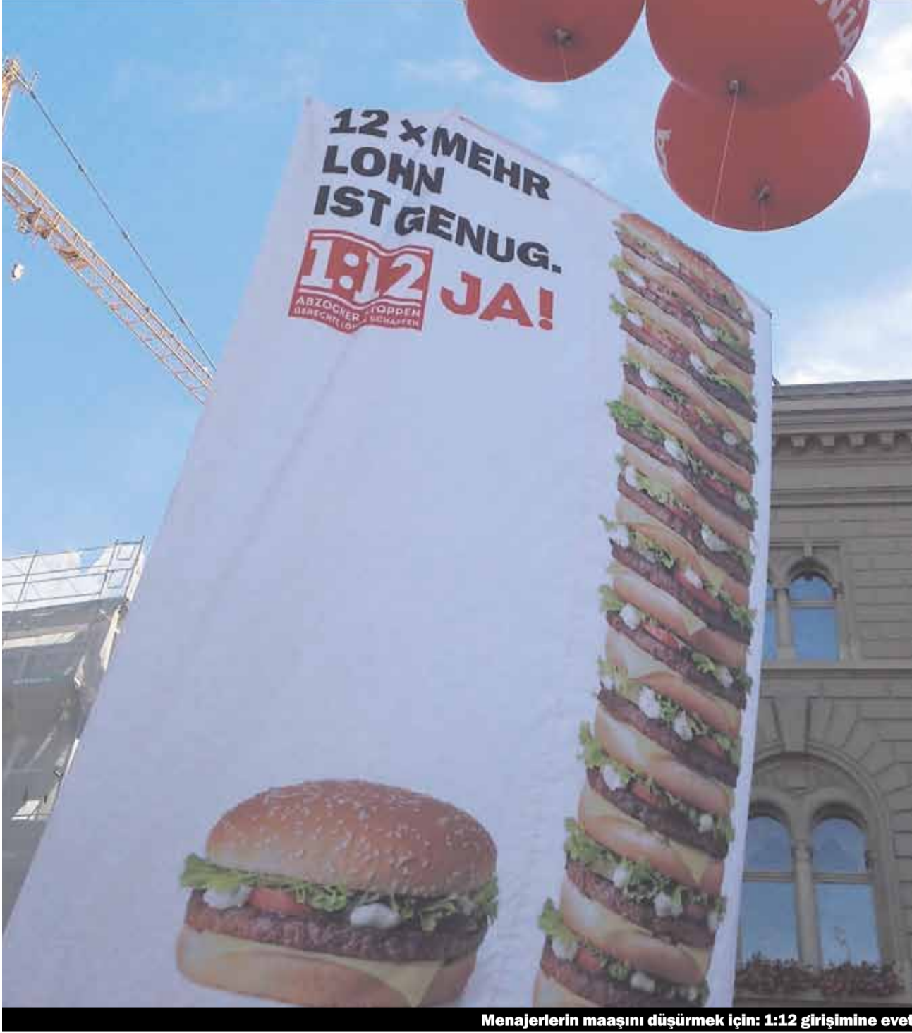
Menajerlerin maaşını düşürmek için: 1:12 girişimine evet

24 kasımda üç girişim için oy kullanılacak. Genç sosyalistlerin talebi olan 1:12 girişimi kasım ayında halk oylamasına sunulacak. Eylül ayında yapılan halk oylamalarının bir kaçını kayıp ettik: Züriç'te göçmenlere seçme hakkı talep eden girişim büyük bir çoğunluk tarafından reddedildi. Benzin istasyonlarının açık olma süresinin uzatılmasını talep eden girişim kabul edildi. Alışveriş merkezlerinin açık olma saatlerinin serbestleştirilmesi tartışması devam edecek.