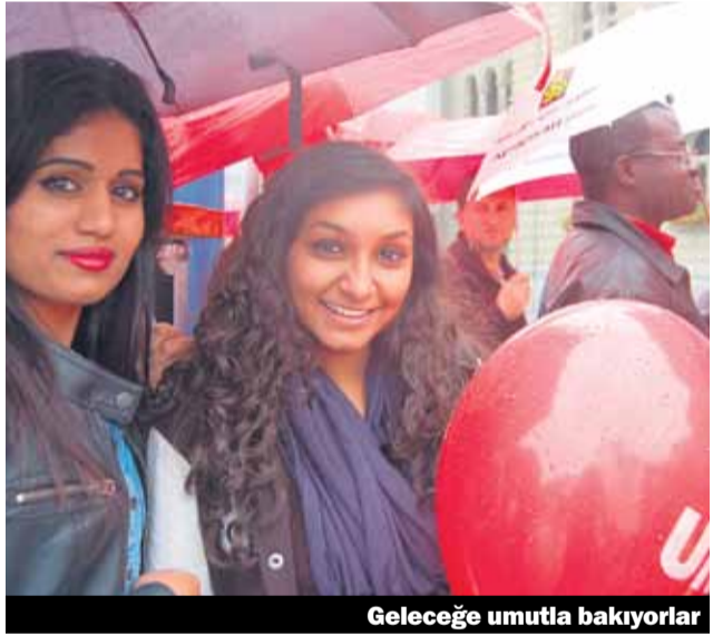
Geleceğe umutla bakıyorlar