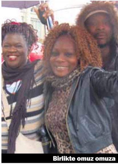
Birlikte omuz omuza