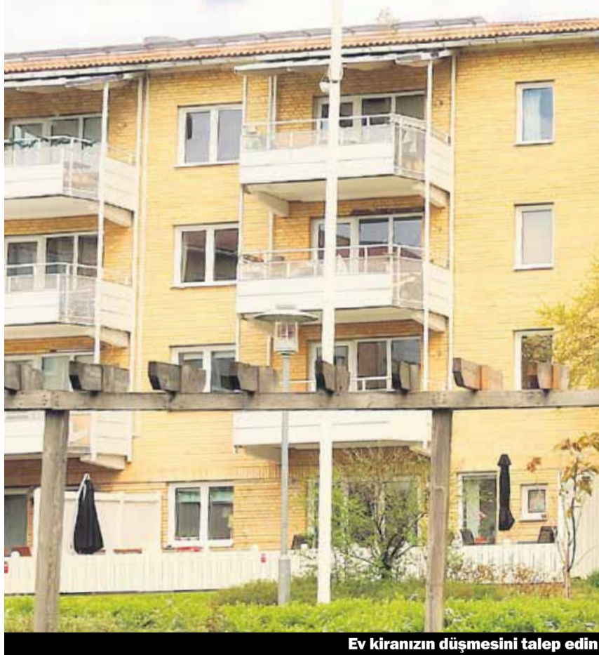
Ev kiranızın düşmesini talep edin

Konut referans faizleri sürekli olarak düşüyor. Buna bağlı olarak, ev sahibinizden kiranızı düşürmesini talep ettiğiniz an, kiranızda düşer.