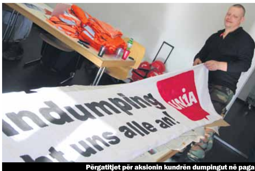
Përgatitjet për aksionin kundër dumpingut në paga