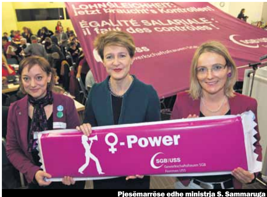
Pjesëmarrëse edhe ministria S. Sammaruga

Të 200 delegatet e Kongresit të Grave të SGB-së, i cili zhvilloj punimet me 15 e 16 nëntor në Bernë nuk donë të pres më shumë: Punëdhënësit si