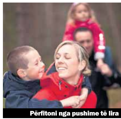
Përfitoni nga pushime të lira