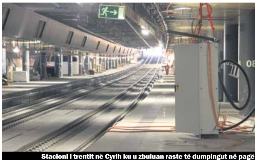
Stacioni i trenit në Cyrih ku u zbuluan raste të dumpingut në pagë

10 ditë u mblodhën 10656 nënshkrime. Peticioni kërkon nga qeveritari përgjegjës i Cyrihut Ernst Stocker një përgjigje publike në dy pyetje: Përse Enti për Punë dhe Ekonomi nuk përdorë të gjitha mjetet për ndalimin e dumpingut në paga; dhe, si do të mbrohen në të ardhmen pagat dhe kushtet e punës nga dumpingu i pagave.