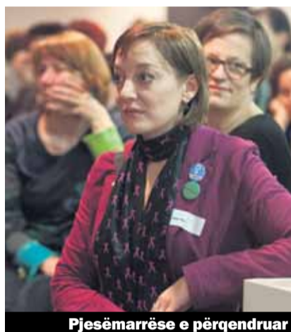
Pjesëmarrëse e përqendruar

duket nuk janë të gatshëm që vullnetarisht të zbatojnë barazinë në paga. Tani vlen vetëm implementimi i ligjit përmes kontroleve dhe sanksioneve. Edhe mysafirja referuese ministria federale Simonetta Sammaruga ishte e këtij mendim. Ajo tha se ka ndërmend të zbatojë masat shtetërore për të arritur barazinë në paga. Para përfundimit të vitit 2014 do ti bëhen pro-