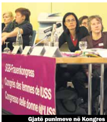
Gjatë punimeve në Kongres