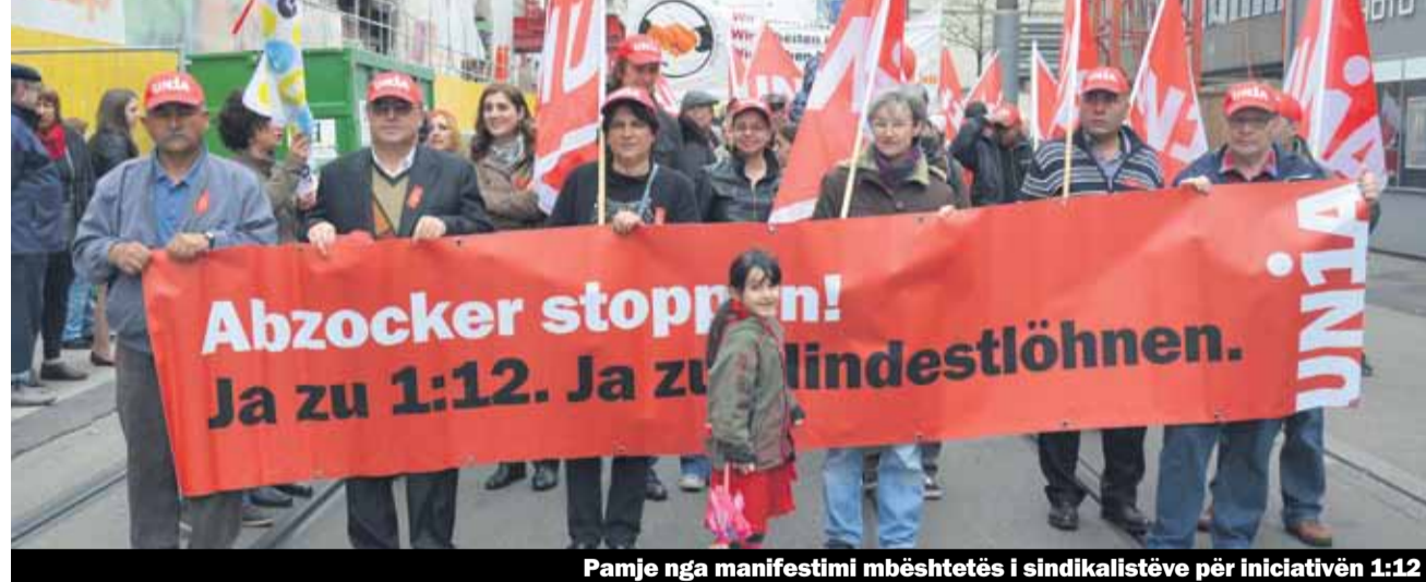
Pamje nga manifestimi mbështetës i sindikalistëve për iniciativën 1:12

Populli zviceran më 24 nëntor 2013 tha tri herë JO. Iniciativa e familjes e SVP-së, e cila parashihte lehtësim në tatim për familjet, të cilat përkujdesen vet për fëmijët e tyre si dhe shtrenjtimi i taksës vjetore për autostradë u refuzuan. Mjerisht populli zviceran nuk aprovoi edhe iniciativën 1:12 të socialistëve të rinj.