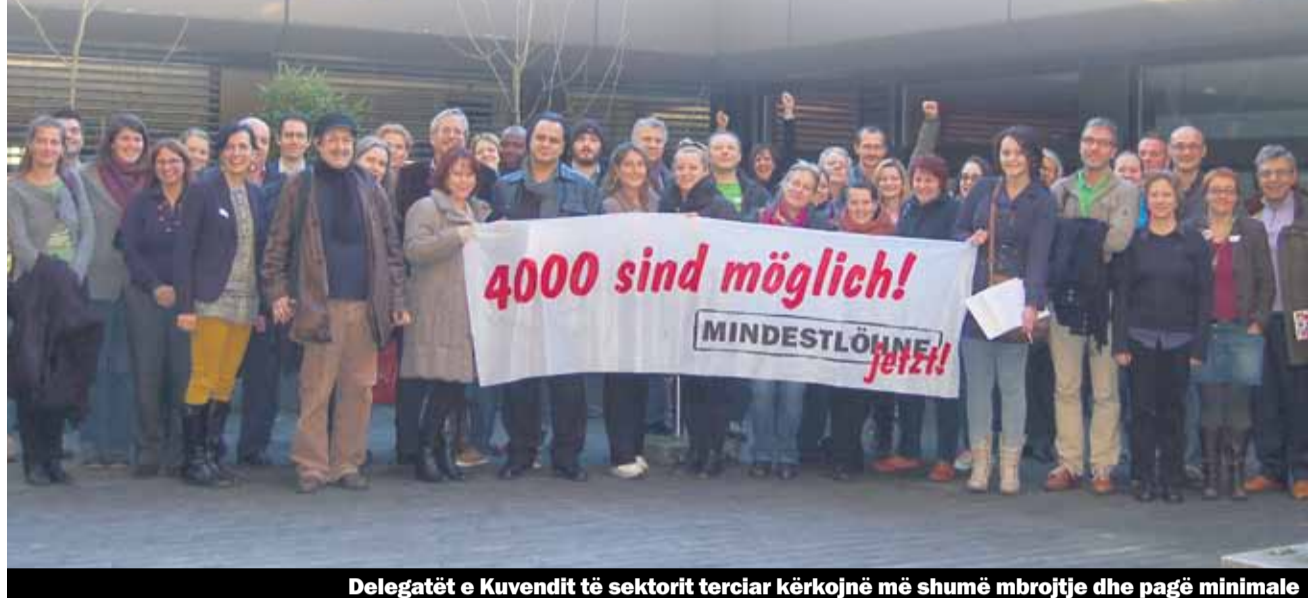
Delegatët e Kuvendit të sektorit terciar kërkojnë më shumë mbrojtje dhe pagë minimale

Plani zhvillimor (EWP) 2013–2016 tani do të presohet drejtorisë qendrore të Unia-s dhe kryesisht qendrore ndërsa më pas duhet të konkretizohet dhe të zbatohet nga regjionet e veçanta në formë të planeve zhvillimore regjionale. Plani zhvillimor do të përqendrohet posaçërisht në temat vijuese: ngritjen e prezencës