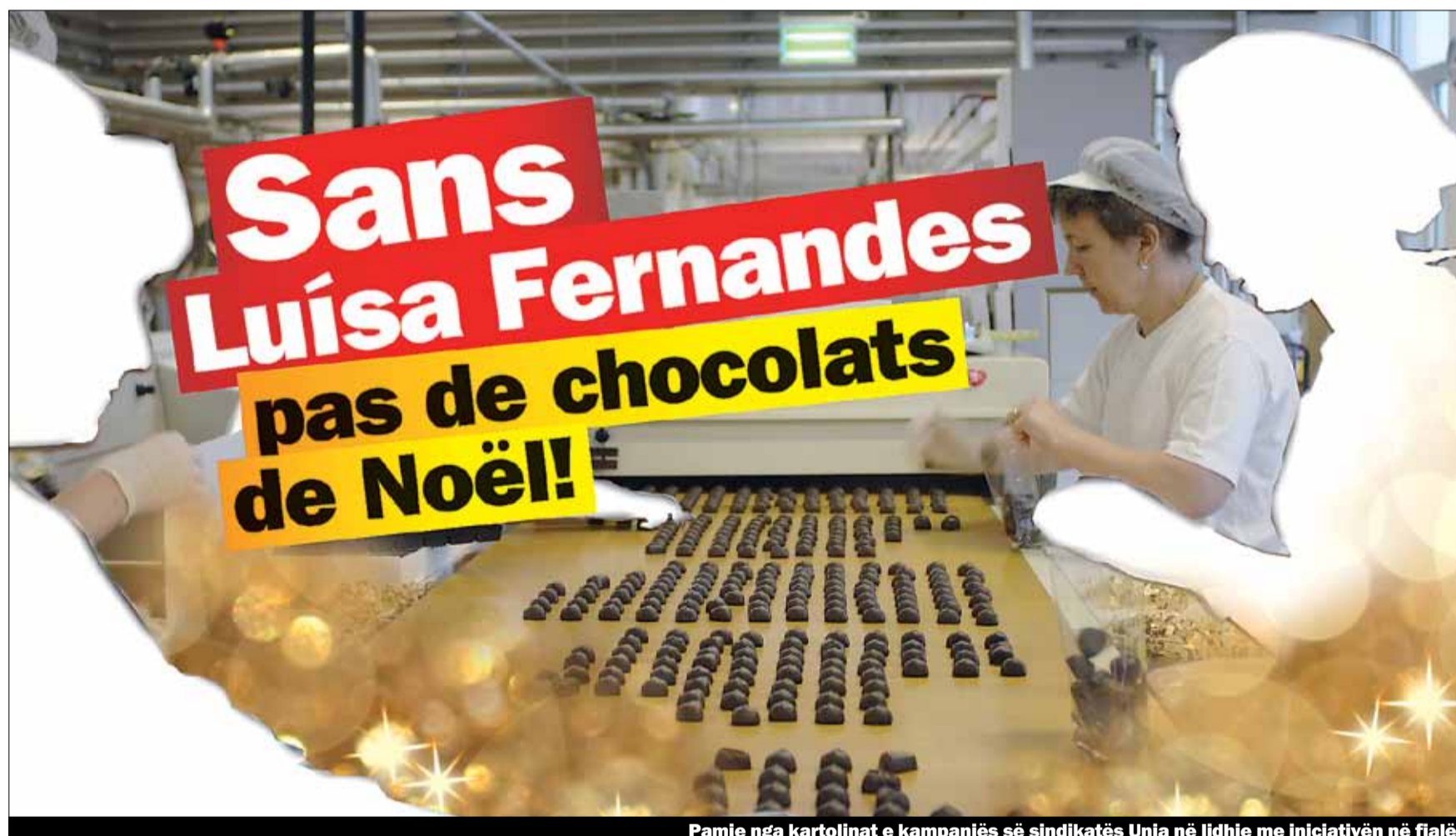
Pamje nga kartolinat e kampanjës së sindikatës Unia në lidhje me iniciativën në fjalë

Më 9 shkurt populli zviceran do të votoj për iniciativën e SVP-së (shkurtesa në gjermanisht e Partisë Popullore të Zvicrës) «kundër imigrimit masiv». Ky shabllon dokument ksenofob dëshiron që migracionin ta rregulloj përmes kontingjentëve. Provon të shesë kontingjentet si zgjidhje të të gjitha problemeve. Ksenofobia dhe përjashtimi e izolimi nuk janë zgjidhje: Ne kemi nevojë për masa shoqërore shtesë të mira dhe të fuqishme (shkurtesa në gjermanisht: FlaM). Andaj ne më 9 shkurt themi JO!