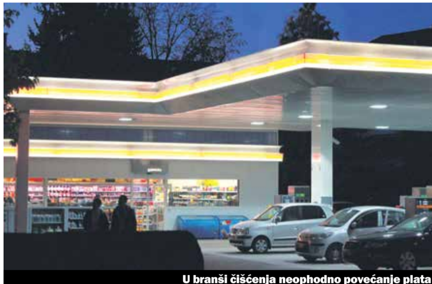
U branši čišćenja neophodno povećanje plata

Činjenica da se socijalno partnerstvo prihvata ozbiljno i da je veoma korisno govori primjer novog Opšteg kolektivnog ugovora firme Belimed Sauter, koja se bavi poslovima sterilizacije koja zapošljava oko 300 zaposlenih. Novi opšti kolektivni ugovor je već na snazi i važi do 2019. godine. Novo je i to da pod odredbe ugovora spadaju i temporer zaposleni radnici i učenici i da je veća transparentnost u platama za nekvalifikovane i za