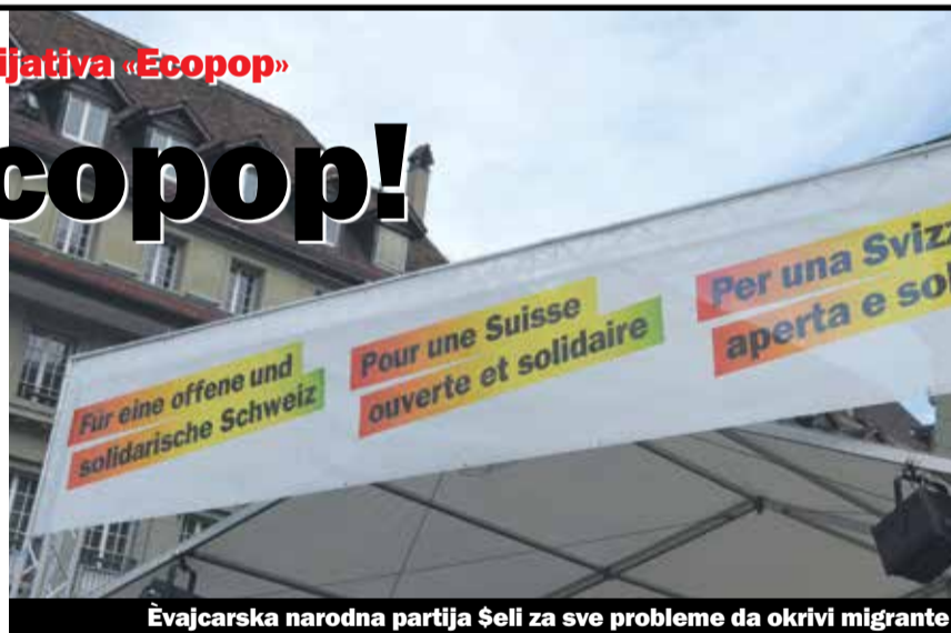
Švajcarska narodna partija Seli za sve probleme da okrivljuje migrante

Konkretno to zahtijeva, da stalno stanovništvo Švajcarske u prosjeku od tri godine ne bi smjelo da raste više od 0,2% zbog doseljavanja i da najmanje 10% od državnih novčanih sredstava za pomoć razvoja die «dobrovoljno planiranje porodice» za nerazvijene zemlje.