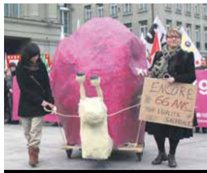
Strpljenje nas je izdalo