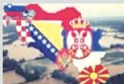
Pomoć poplavljenima se nastavlja – solidarnost na visokom nivou

nako, svima koji su pogodjeni bez obzira na vjeru, nacionalnost itd. Nadajmo se da će ta solidarnost i ostati i da će pomoći da se nedaće što prije prevaziđu.