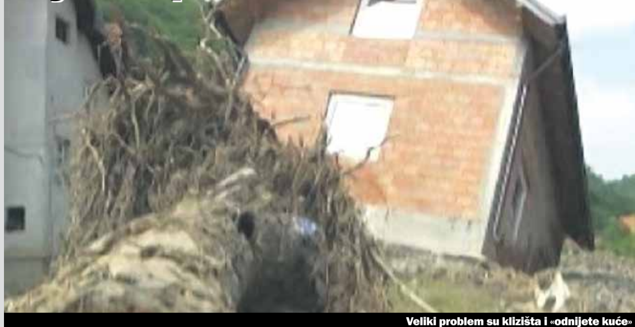
Veliki problem su klizišta i «odnijete kuće»

Područja koja se još nisu oporavila od rata zahvatila nova katastrofa. Naime poplavama smo mogli vidjeti kraj ali klizišta i posljedice poplava će još dugo da traju. Naime postoje sela, mjesta za koje javnost malo zna, koja su bukvalno ostala bez svega. Zamislite ljude koji su 50 godina sakupljali ciglu po ciglu da sagrađe sebi krov nad glavom i jednim potezom im to nestane. Da li se Bog «naljutio» reče jedan naš sagovornik.