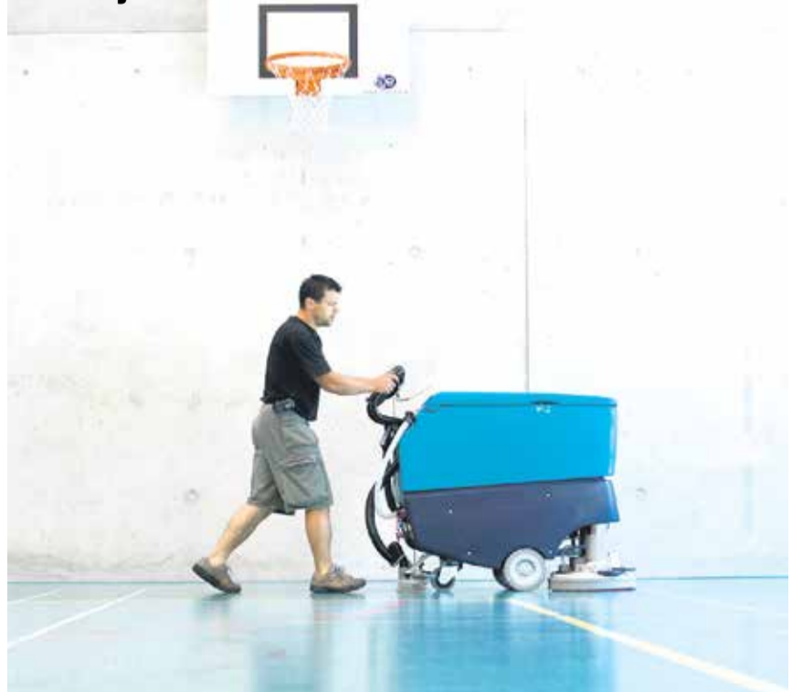
Desničarska inicijativa krivi migrante za sve probleme

Ovi ciljevi treba da omoguće da formalno i neformalno stečeno znanje treba biti priznato. Projektna grupa je aktivna u Švajcarskoj, Francuskoj, Austriji, Italiji, Holandiji, Njemačkoj i Sloveniji.