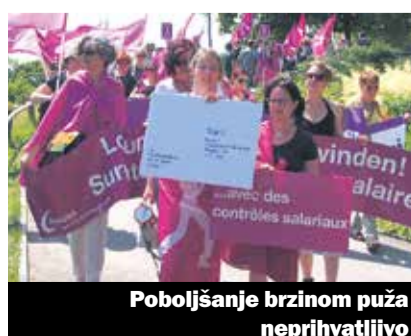
Poboljšanje brzinom puža neprihvatljivo