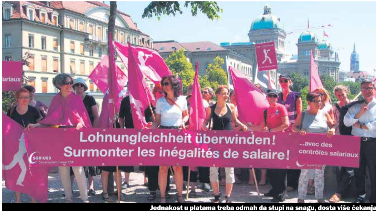
Jednakost u platama treba odmah da stupi na snagu, dosta više čekanja

Ova situacija je pokrenula žene Švajcarskog saveza sindikata, sada mo-