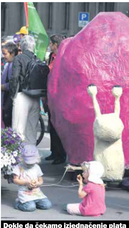
Dokle da čekamo izjednačenje plata