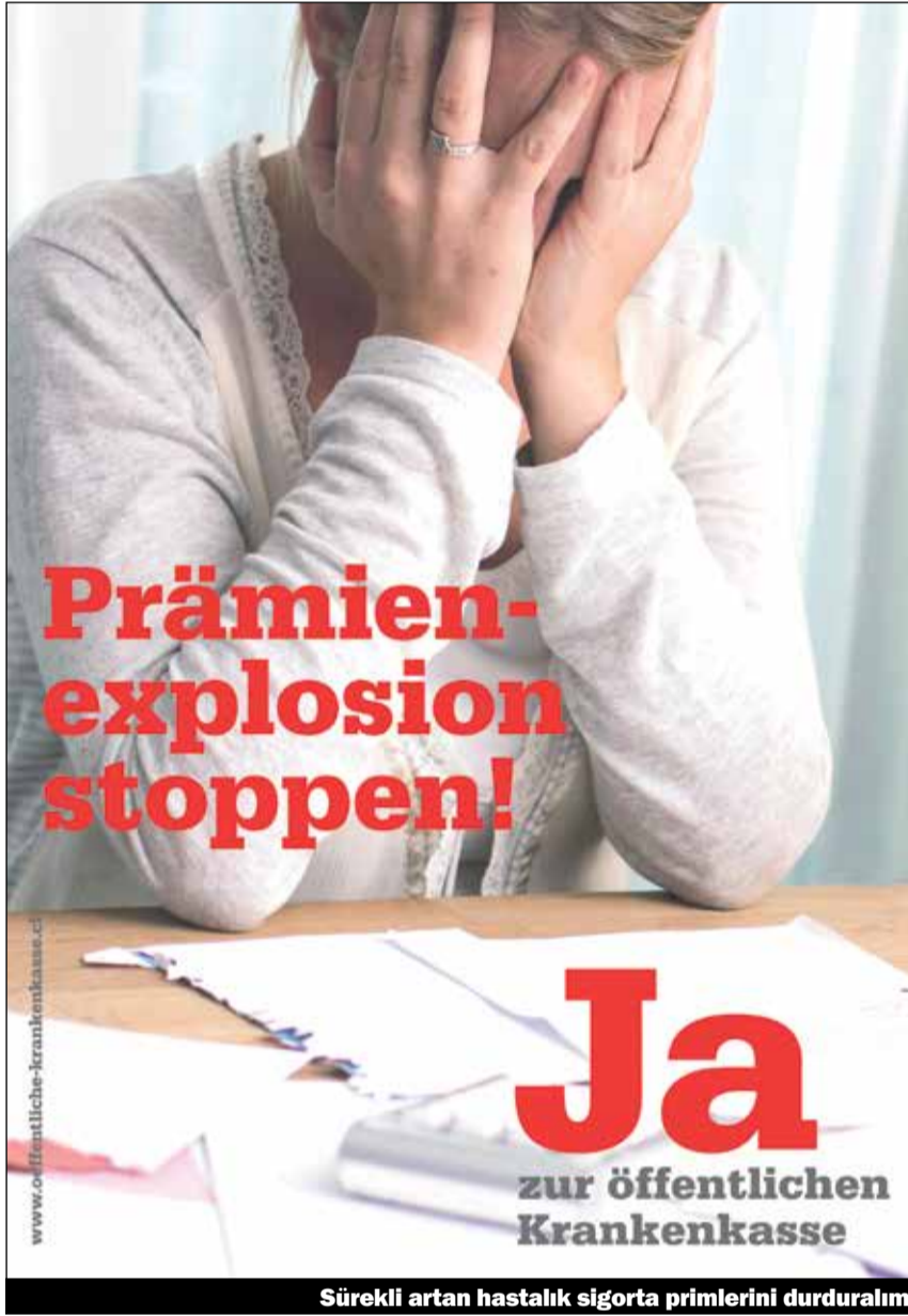
Sürekli artan hastalık sigorta primlerini durduralım

hastalık sigorta primlerinin miktarını sigorta yönetim kurulu ve hastalık sigortası lobicileri değil, hükümet ve kanton temsilcileri birlikte belirleyecekler.