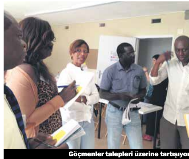
Göçmenler talepleri üzerine tartışıyor

Göçmenler meclisi kurmanın amacı, göçmenlerin İsviçre politik sistemini tanımasını sağlayarak, politik