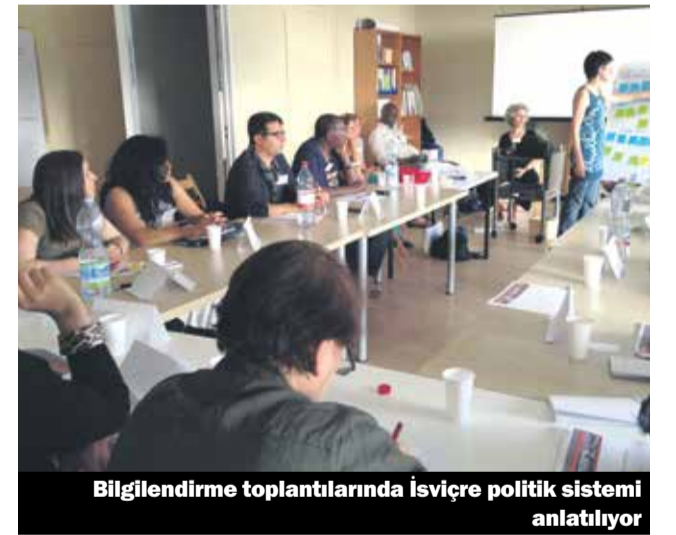
Bilgilendirme toplantılarında İsviçre politik sistemi anlatılıyor

2013 de, göçmen dernekleri, organizasyonları ve ilgi duyan gruplar bir araya gelerek, göçmenler ağını oluşturdular. 10 göçmen, kordinatör olarak, İsviçre'nin Almanca, Fransızca ve İtalyanca konuşulan bölgelerinde toplantılar düzenleyerek göçmenleri biraraya getirdi. FİMM'in amacı organize edilen aktivitelere çok sayıda göçmenin katılımını sağlamak ve