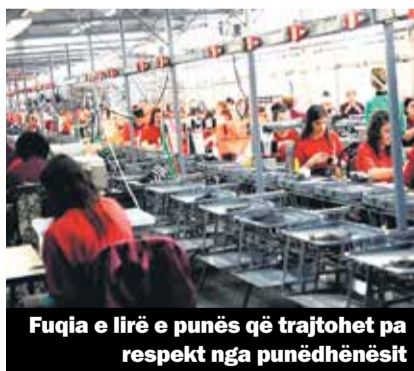
Fuqia e lirë e punës që trajtohet pa respekt nga punëdhënësit

Sindikata e Pavarur e Sektorit Privat të Kosovës ka publikuar të gjetura të shumta sa i përket raportit punëdhënës – punëmarrës. Sipas këtyre të dhënave, SPEVZ tregon se ka shumë parregullsi në raportin punëdhënës – punëmarrës. Ka punëtorë që paguhet me vetëm 120 euro në muaj, si dhe të tillë që nuk kanë marrë rrogë që shtatë muaj.