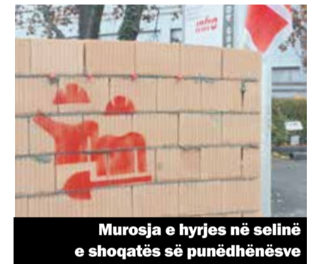
Murosja e hyrjes në selinë e shoqatës së punëdhënësve