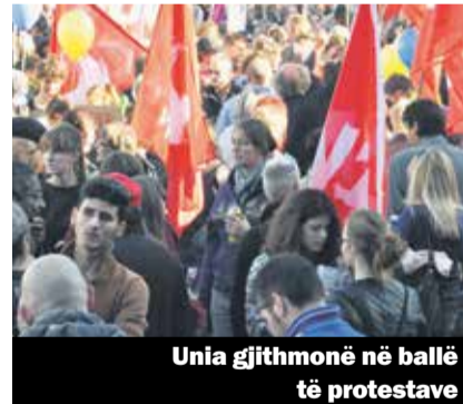
Unia gjithmonë në ballë të protestave

përket lejeve dhe statuteve të qëndrimit për migrantet.