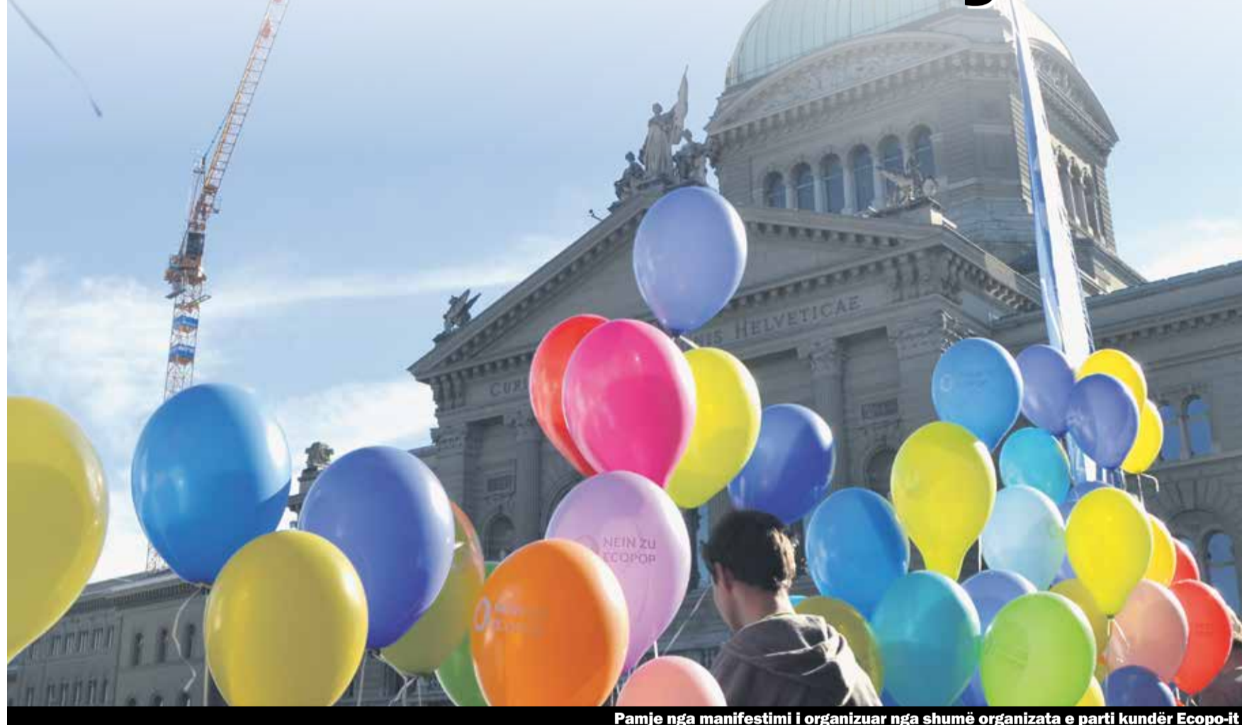
Pamje nga manifestimi i organizuar nga shumë organizata e parti kundër Ecopop-it

Pas kampanjës intensive forcat progresive të vendit mund të marrin frymë lirshëm. Ecopop u hodh poshtë qartas me 74,1% të votave. Edhe pse ky rezultat mund të konsiderohet si i suksesshëm, migrantët edhe më tej do të shërbejnë si dele e zezë. Andaj edhe përkundër kësaj nevojitet edhe më tej angazhimi ynë i përbashkët si në rastin e zbatimit të Iniciativës për migrimin masiv ku duhet kundërshtuar kontingjentet dhe lejet diskriminues të qëndrimit ashtu edhe për votimet tjera relevante të politikës së migracionit.