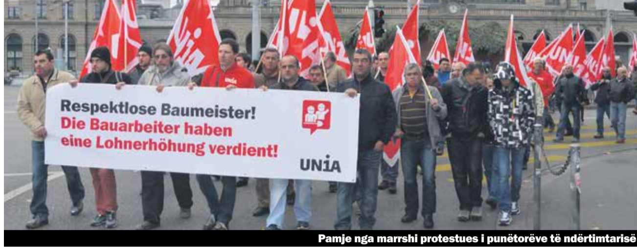
Pamje nga marrshi protestues i punëtorëve të ndërtimtarisë

Bisedimet mbi pagat në ndërtimtarinë janë duke çaluar, gjithashtu edhe bisedimet për ripërtëritjen e Kontratave Kolektive të Punës (KKP) për personelin e huazuar janë ndërprerë. Të dy shembujt tregojnë: Bisedimet për paga dhe për kontrata nuk janë gjithmonë të thjeshta dhe përmirësime mund të arrijmë vetëm nëse punëmarrësit bashkohen dhe luftojnë për tu arritur ato.