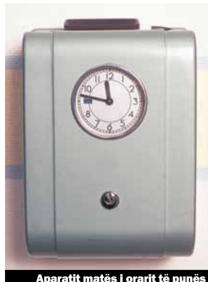
Aparatit matës i orarit të punës

Delegacioni i Unia-s kërkon për të gjitha profesionet e sektorëve të shërbimeve përllogaritje të detajuara dhe përmirësim të kontrollit të orarit të punës, ditë të lira fikse nga puna për të punësuar me orar të reduktuar si dhe përllogaritje të kohës së trajnimit dhe shërbimit kujdestar. Këto preokupime duhet të zbatohen përmes zgjerimit dhe forcimit të Kontratave Kolektive të Punës.