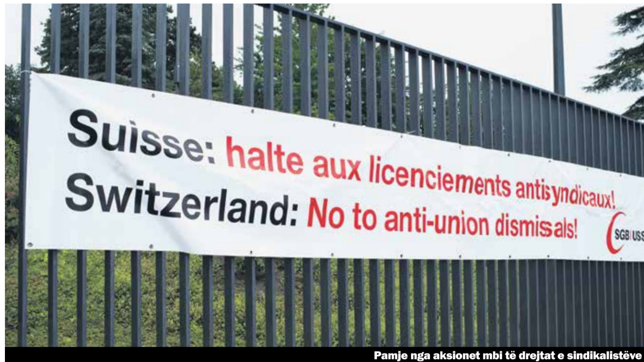
Pamje nga aksionet mbi të drejtat e sindikalistëve

Derisa zhvillohej një betejë për të drejtat në punë, Radio Freiburg i largon nga puna dy përfaqësues të personelit. Padrejtësisht, thekson gjyqi federal.