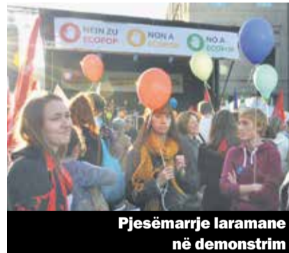
Pjesëmarrje laramane në demonstrim

Pas refuzimit të Ecopop-it Unia do të angazhohet tani edhe më fuqishëm me rastin e zbatimit të iniciativës mbi migrimin masiv kundër rregullave të reja diskriminuese si a