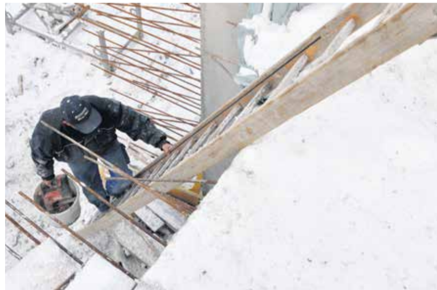
Punëtorët e ndërtimtarisë u nënshtrohen rreziqeve të shumta

pritet puna. Ndërtuesit (ndërmarrës) nuk ndërpresin punën vetvetiu edhe në kushte të mjerueshme moti. Megjithatë punëmarrësi ka të drejtë të dëgjohet në situata të tilla nga ana e punëdhënësit.