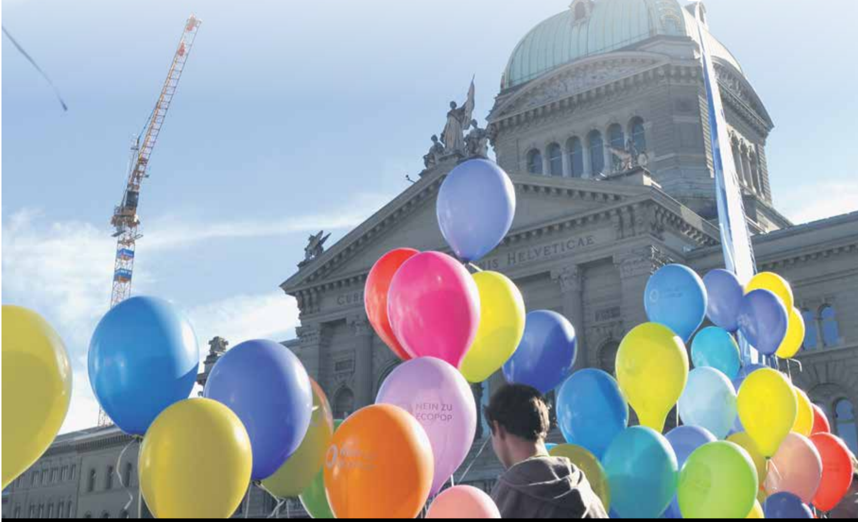
Mücadele edildi: Yabancı düşmanı ecopop inisiyatifi reddedildi

Ecopop inisiyatifi %74,1 ile reddedildi. Yürütülen yoğun bir kampanyanın ardından, İsviçre'nin ilerici güçleri rahat bir nefes aldı. Bu başarılı sonuca rağmen, göçmenlerin haklarına, göçmenlere yönelik saldırılar devam edecektir. 9 şubatta kabul edilen kitlesel göç inisiyatifinin uygulanmasında kontenjana, ayrımcı, dışlayıcı uygulamalara karşı mücadele sürdürülmelidir.