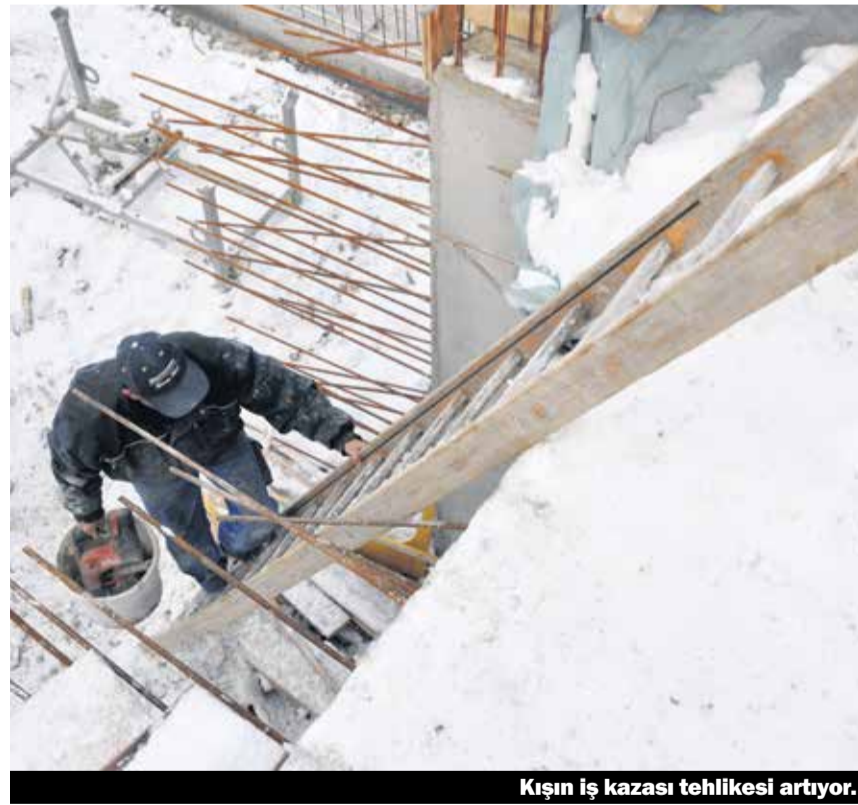
Kışın iş kazası tehlikesi artıyor.

Önemli: Soğuk, kar ve yağmurdan dolayı tehlike var ise, işe son verilebilir. İnşaat patronları, kötü hava koşullarında işi her zaman durdurmuyor. Bu durumlarda, işveren, işçilerin başvurusuna dikkat etmek zorundadır.