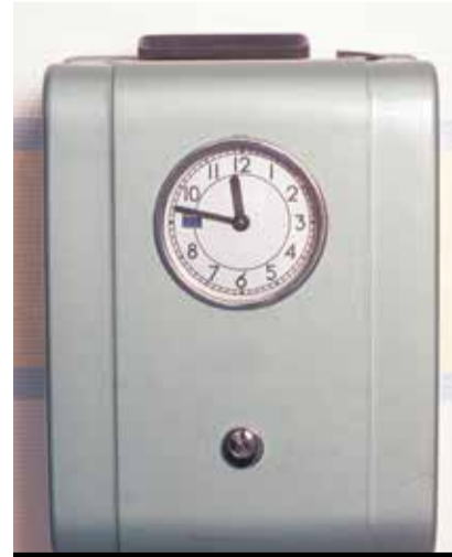
Çalışma saatleri doğru kayıt edilmeli

Unia delegeleri, hizmet sektörüne bağlı bütün branşlarda, çalışma saati kontrolünün daha iyi yapılmasını, yarım gün çalışanlar için sabit-ış gününün belirlenmesini, eğitim ve fiili olarak çalışmak için geçen bekleme süresinin hesaba dahil edilmesini talep ettiler. Bu talepler, toplu iş sözleşme kapsamında genişletilerek ve güçlendirilerek uygulamaya konmalıdır.