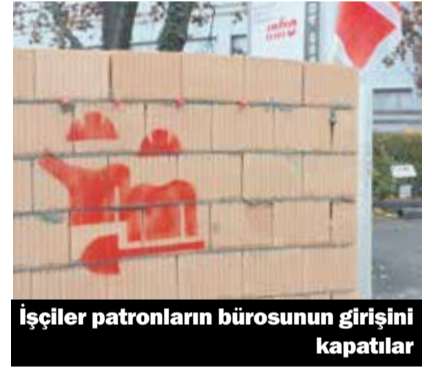
İşçiler patronların bürosunun girişini kapattılar