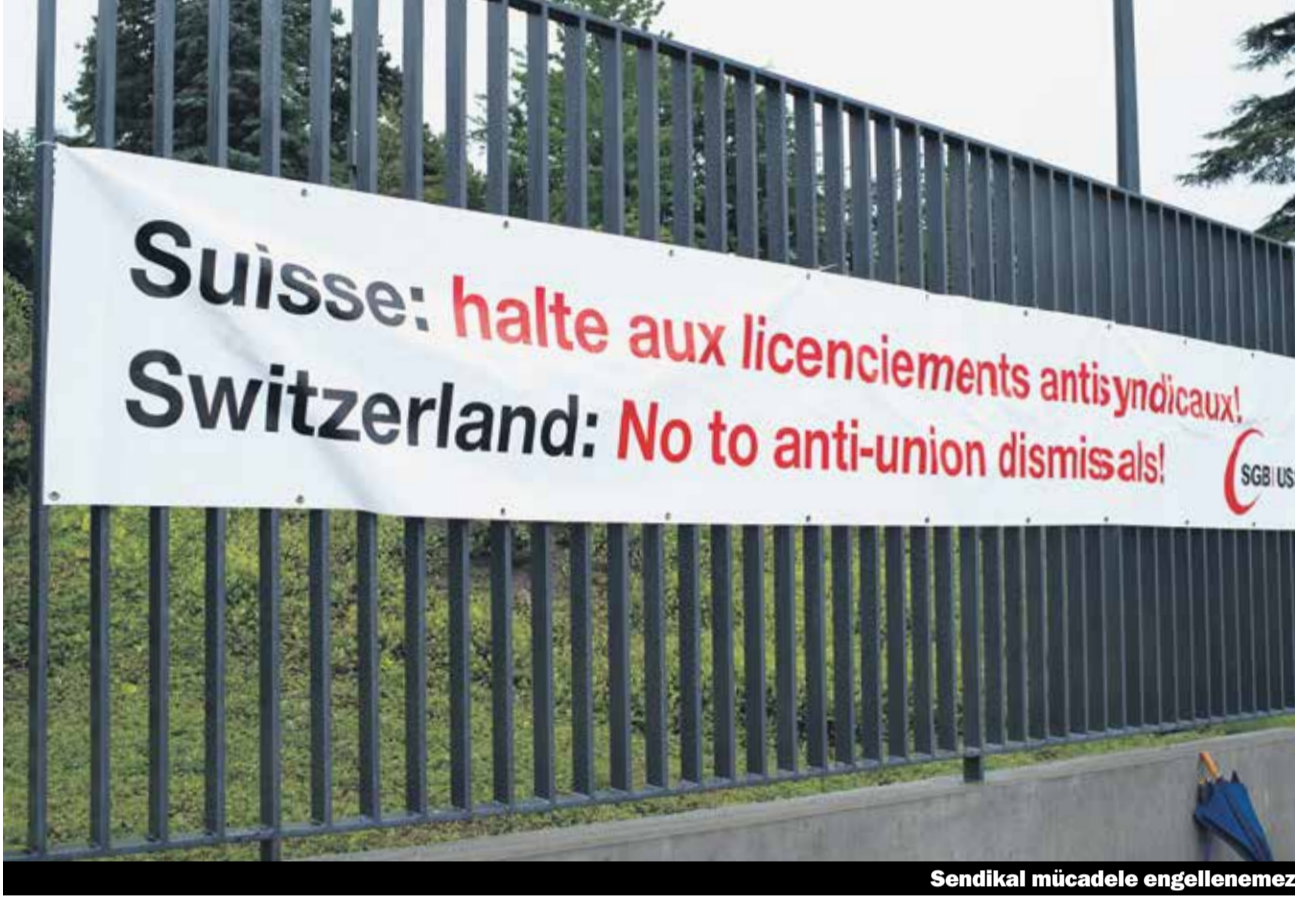
Sendikal mücadele engellenemez

Freiburg radyosu iki işçi temsilcisine çıkış verdi. Federal mahkeme bu kararın haksız olduğunu söyleyerek bozdu.