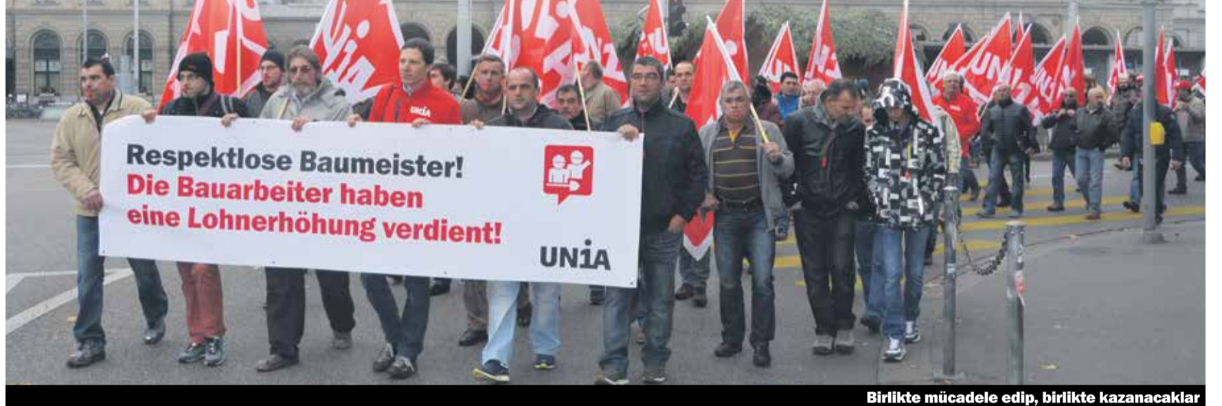
Birlikte mücadele edip, birlikte kazanacaklar

İnşaat işçilerinin maaş görüşmesi çıkmaza girdi, temporer işçilerin toplu iş sözleşmesi durduruldu. Bu iki örnekte anlaşılacağı gibi, maaş ve toplu iş sözleşme görüşmeleri işverenler tarafından sürekli olarak engellenmeye çalışılıyor. Fakat işçiler birlikte haklarını almak için mücadeleye hazırlanıyorlar.