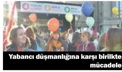
Yabancı düşmanlığına karşı birlikte mücadele

Ecopop inisiyatifinin reddedilmesinden sonra, kitlesel göçü engelleme inisiyatifinin yürürlüğe konması için adımlar atılacak. Unia, inisiyatifin talep ettiği ayrımcı uygulamaların ve göçmen işçilerin çalışma mücadelerinin kötüleştirilmesine karşı çı-