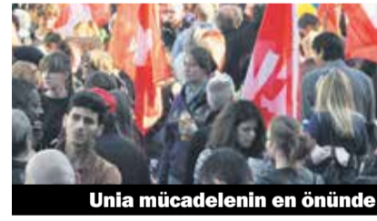
Unia mücadelenin en önünde

karak, bu taleplerin uygulanmasını engellemek için mücadele edecektir. Unia, serbest dolaşım hakkını, işçilerin temel hakkı olarak kabul etmektedir. Bu temel hakkın sorunsuz bir biçimde uygulanabilmesi için, İsviçre'de geçerli olan iş koşullarının, ve maaşların garanti altına alınması ve çalışanların işten çıkarılmaya karşı korunması gerekmektedir. Bunun içinde ek önlemlerin güçlendirilmesi ve toplu iş sözleşme kapsamında var olan önlemlerin genişletilmesi zorunludur.